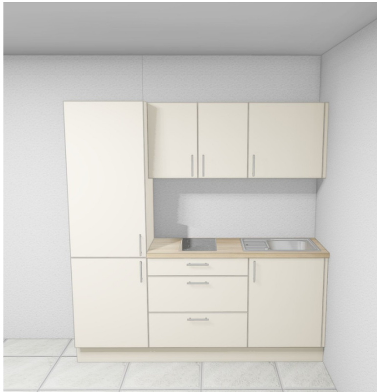
Küche App. 3 NEU