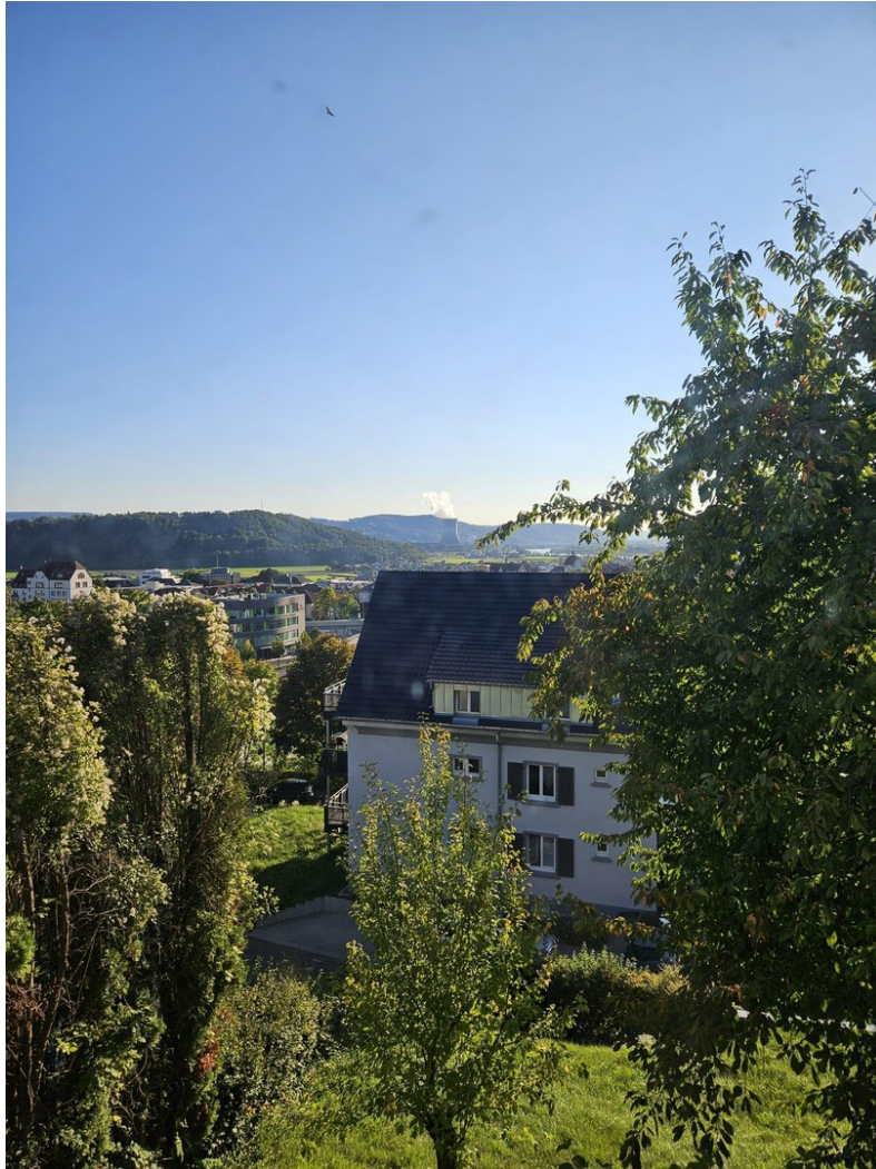
Aussicht über Waldshut