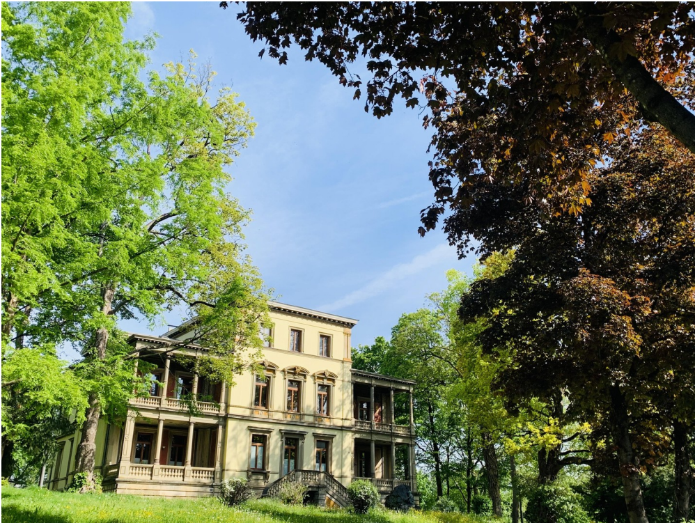
Park um Villa Louis Laiblin