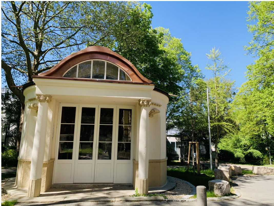
Park um Villa Louis Laiblin