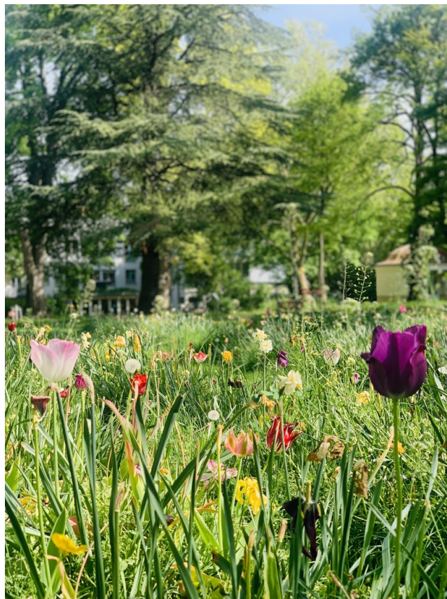
Park um Villa Louis Laiblin