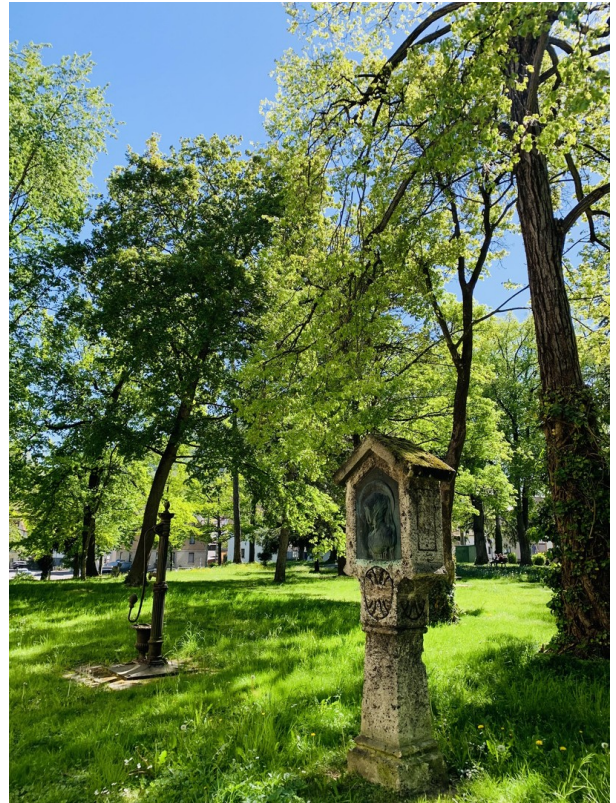
Park um Villa Louis Laiblin