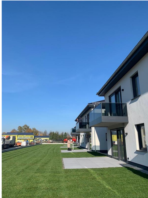
Rückseite der Liegenschaft