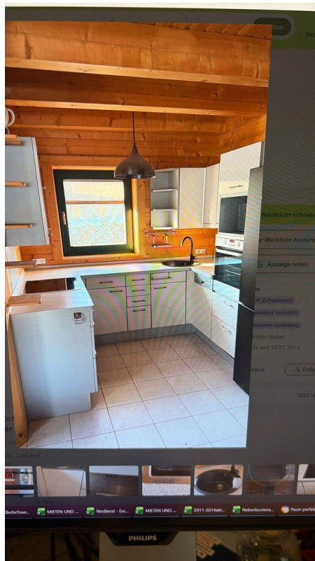
diese Küche wird eingebaut