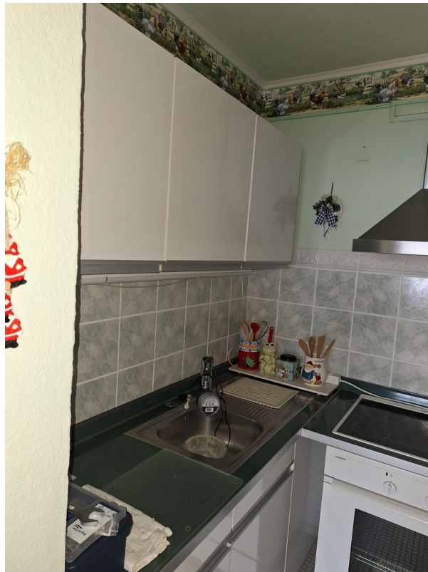
alle Küche wird ersetzt