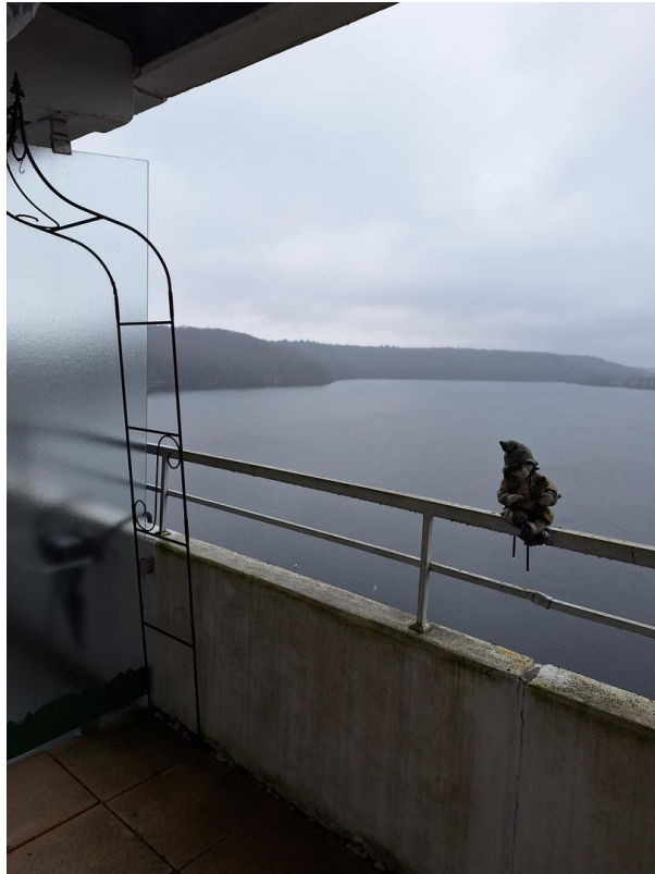
Blick v. Balkon