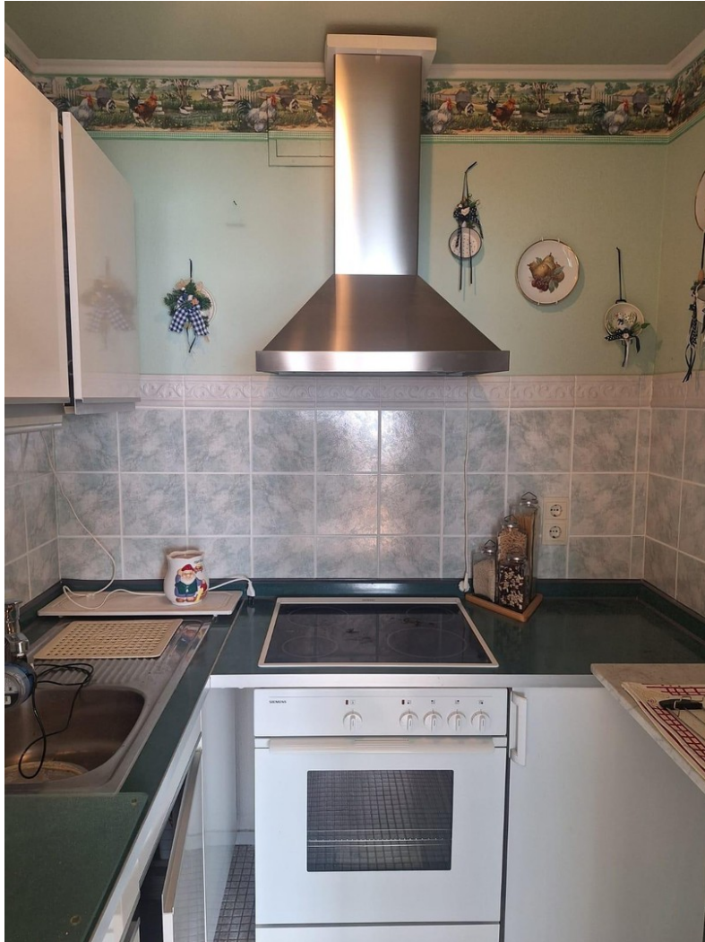
Küche wird noch renoviert