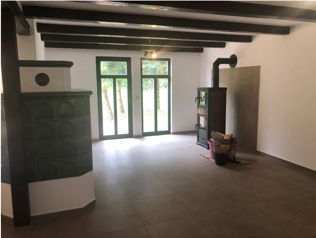
Wohnzimmer mit Kaminofen