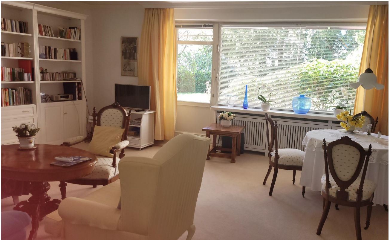
großzügiges Wohnzimmer mit Bli