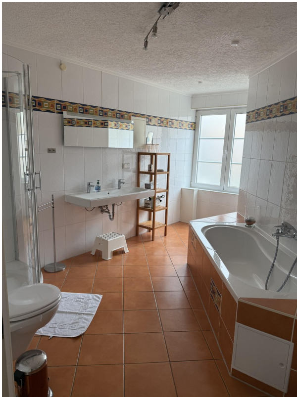
Ensuite Bad mit Fenster