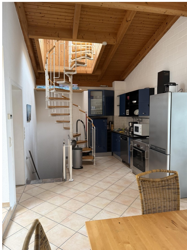
Wendeltreppe zur Dachterrasse