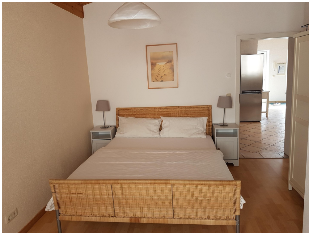
Kinder/ Arbeitszimmer 1. OG