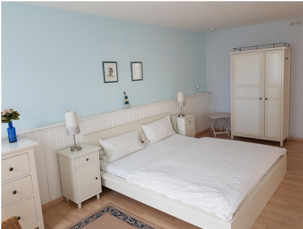
Schlafzimmer 2 EG