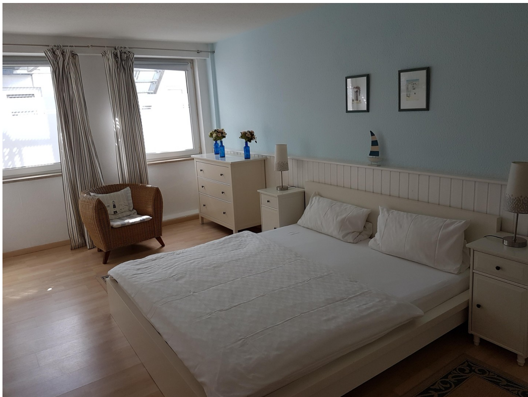
Schlafzimmer 2 EG