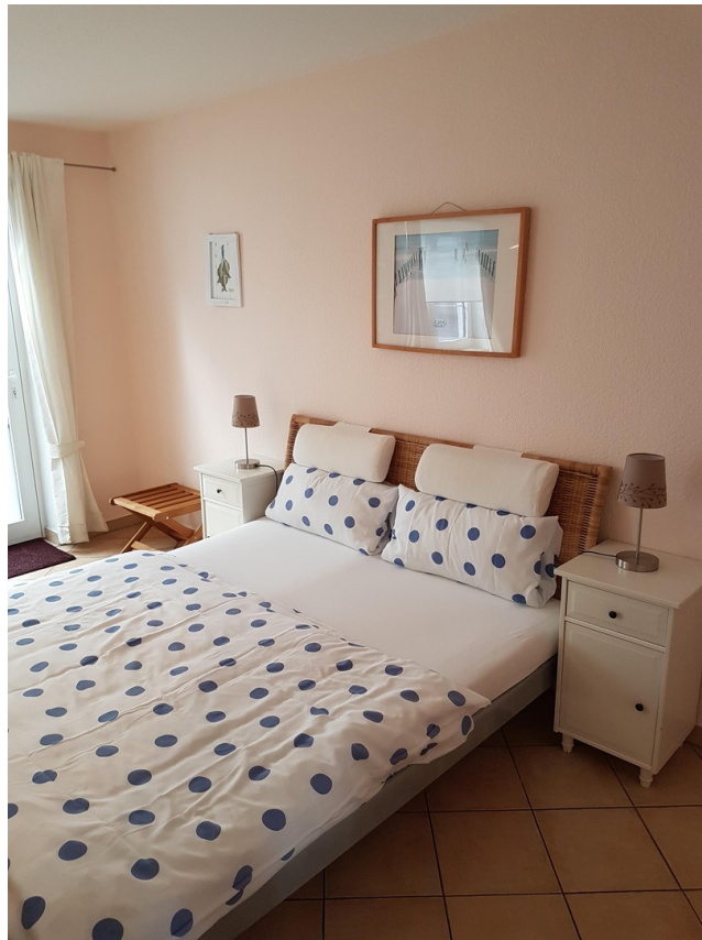
Schlafzimmer 1 EG