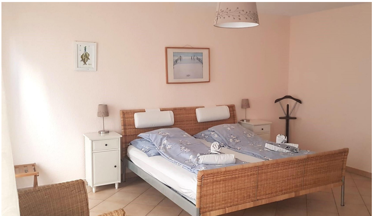
Schlafzimmer 1 EG