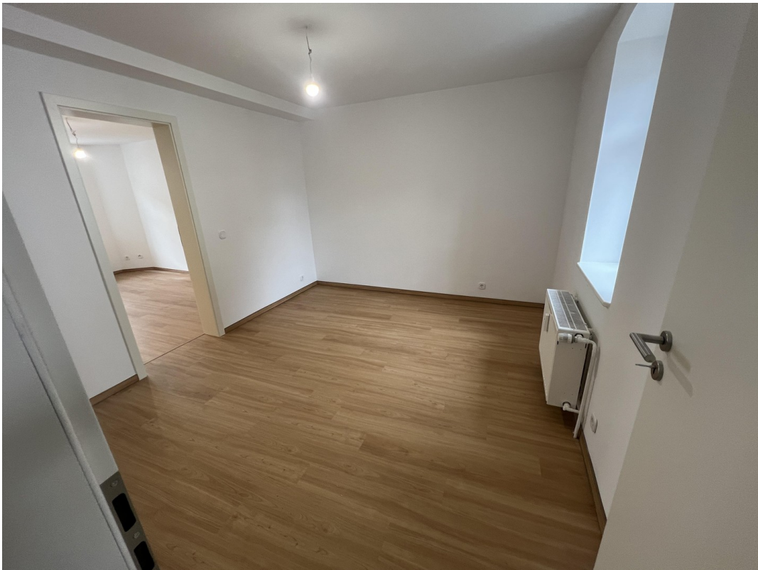
Schlafzimmer Bild 2