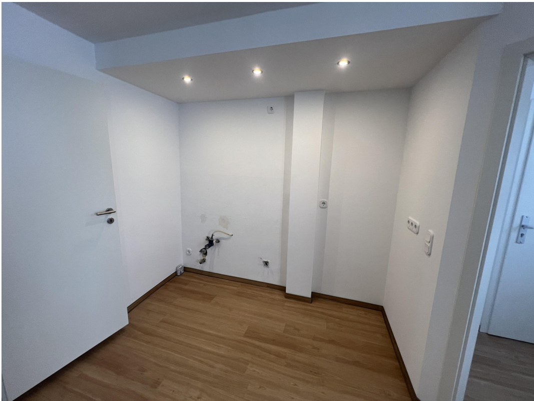
Küchennische im Wohnzimmer