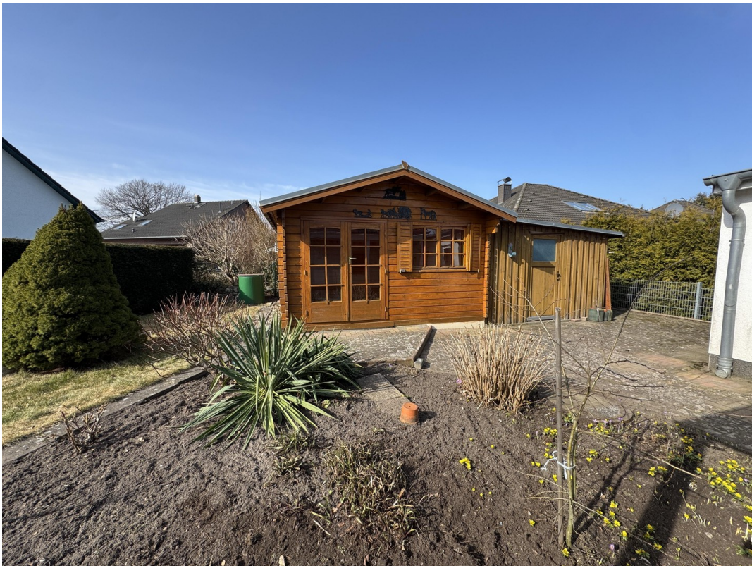
Gartenhaus mit Geräteschuppen