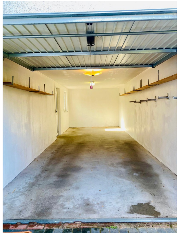
Garage 8,60 m lang