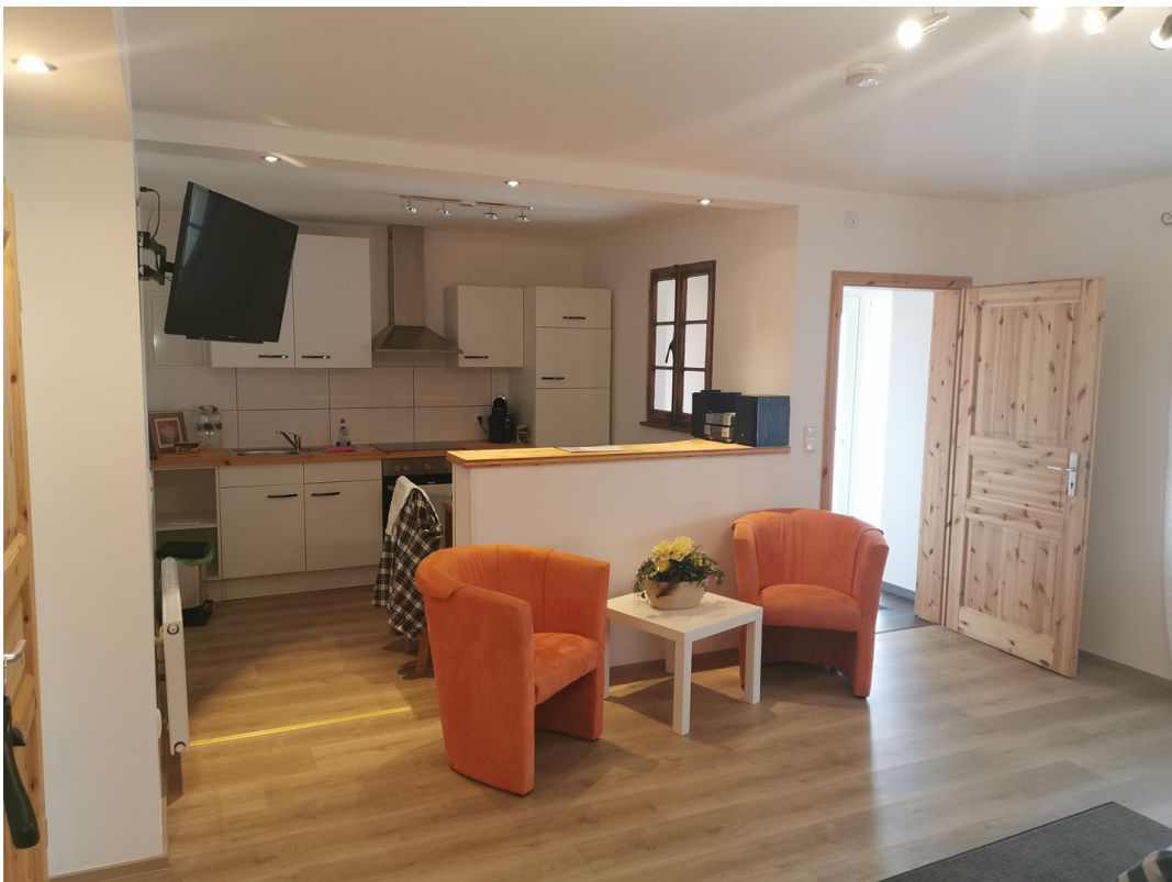
Aufenthalt und Küche von einer