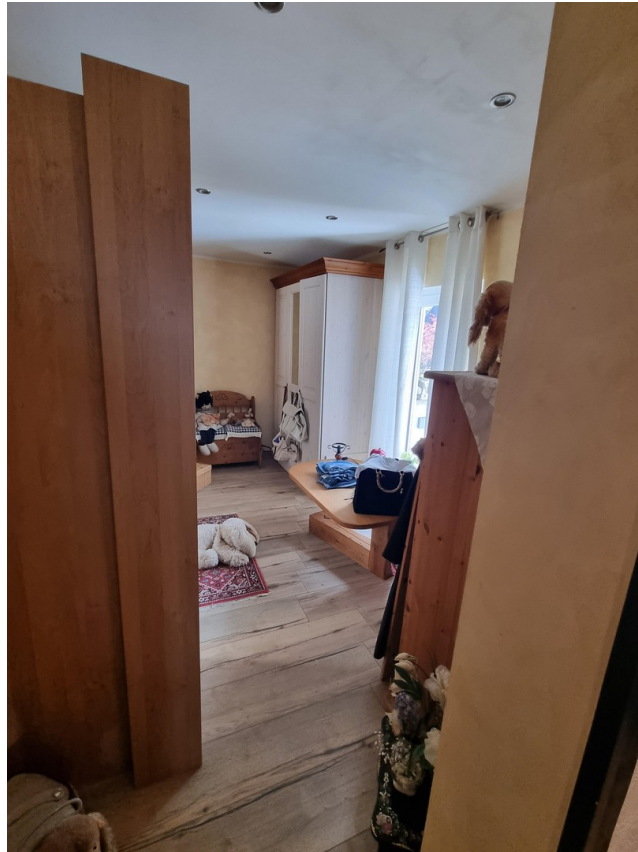
Ankleide Privat klimatisiert