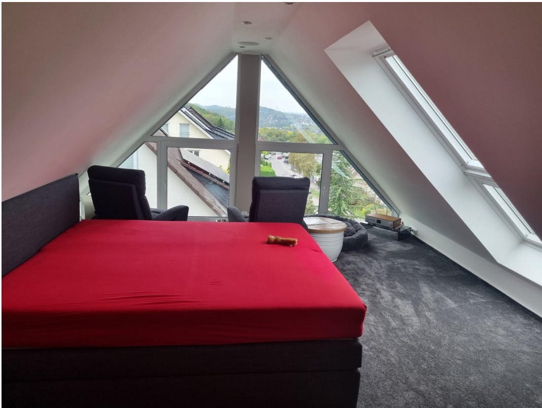
obere Etage Dachgeschoss