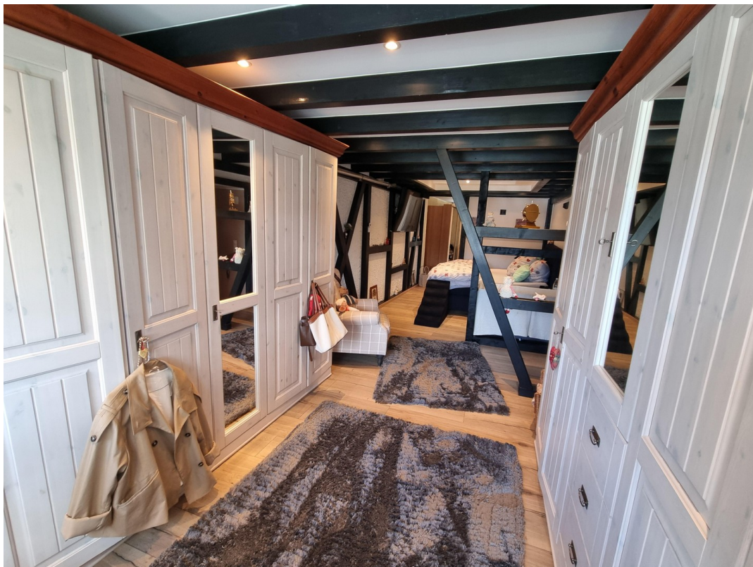
Schlafen Privat klimatisiert