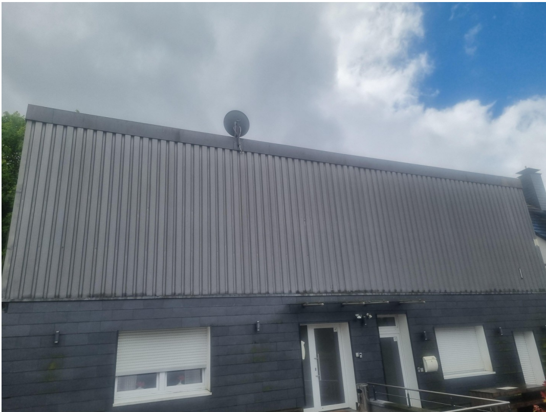
Lgerhalle oberer Bereich