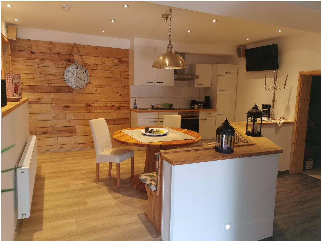
Aufenthalt und Küche von einer