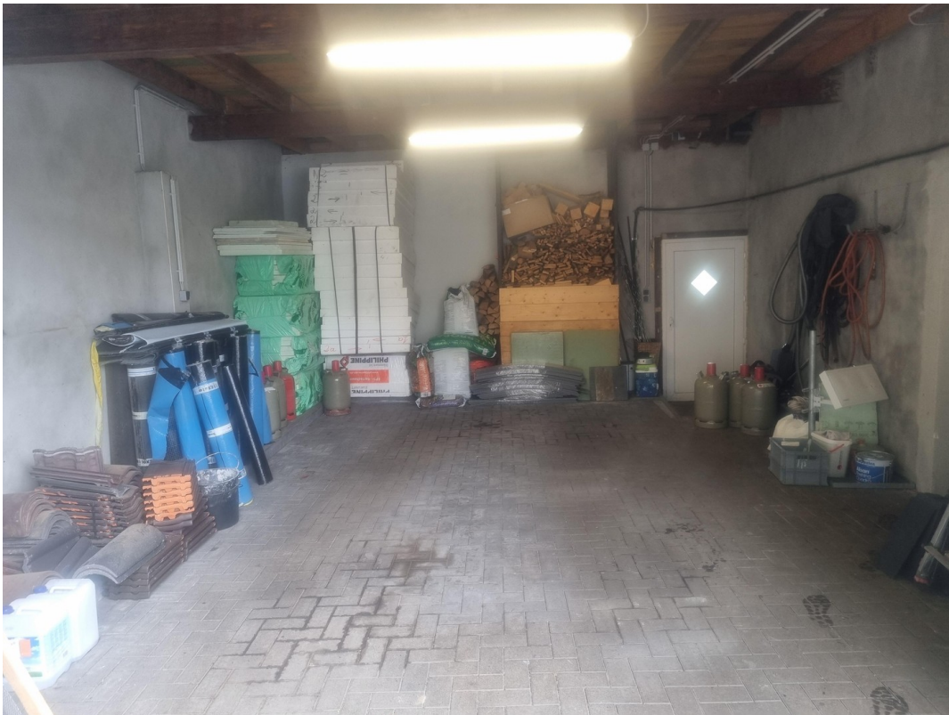
kleine Halle mit Rolltor