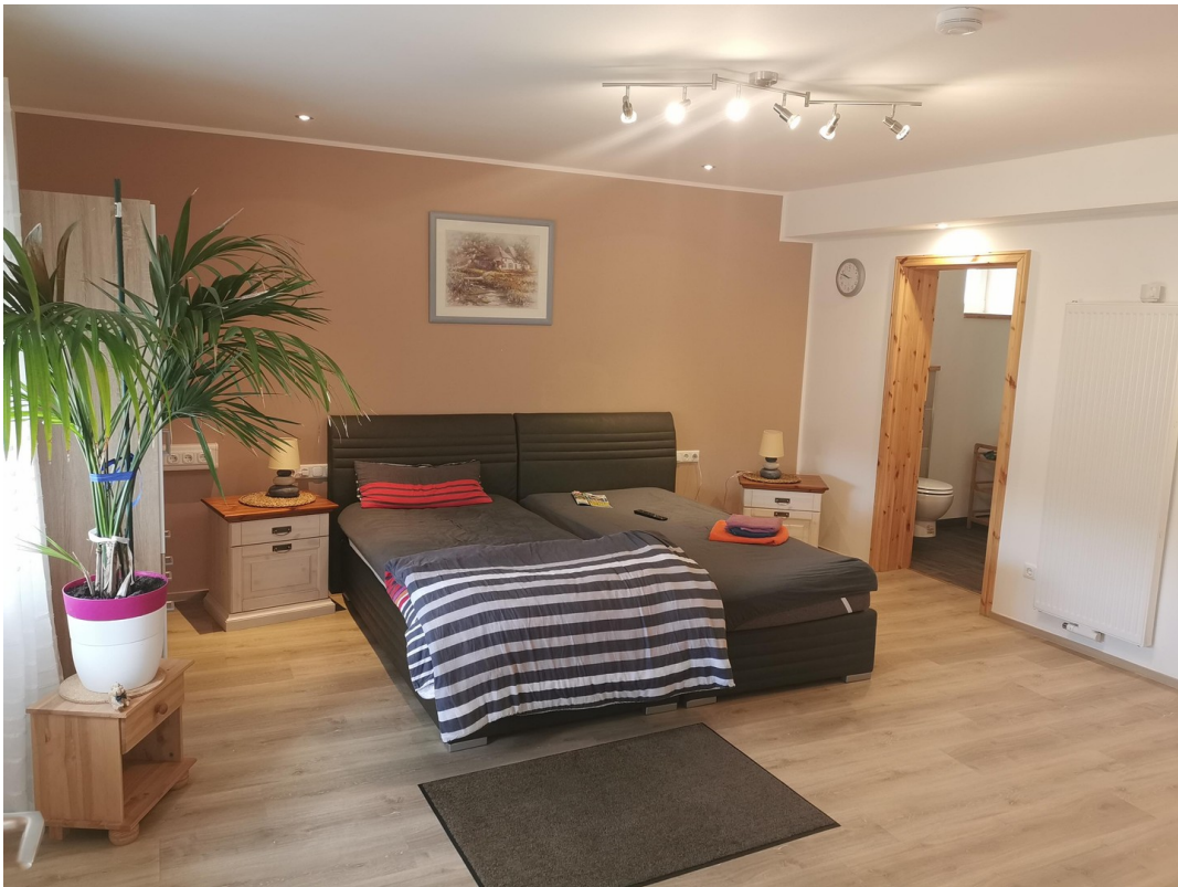
1 Doppelzimmer Ferienwohnung