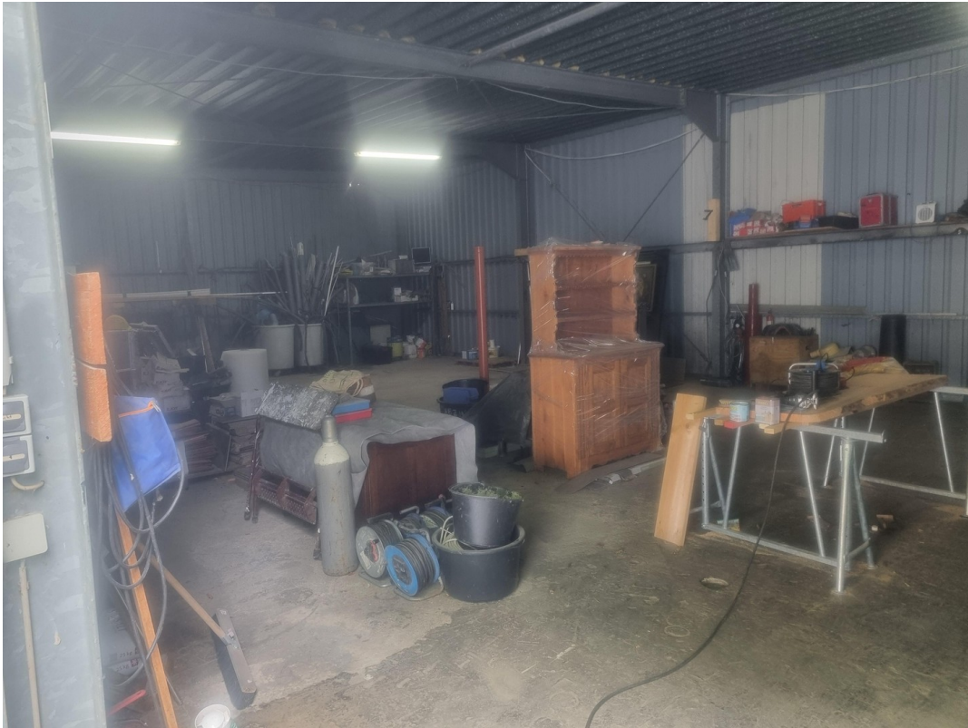
Lager oder Produktionshalle