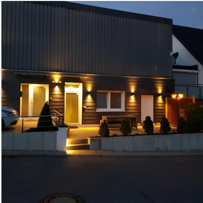
Außenansicht Pension und Ferie