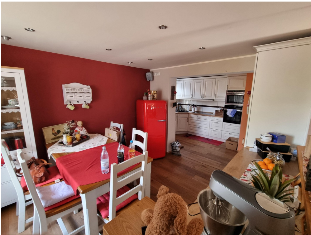
Küche Privat klimatisiert