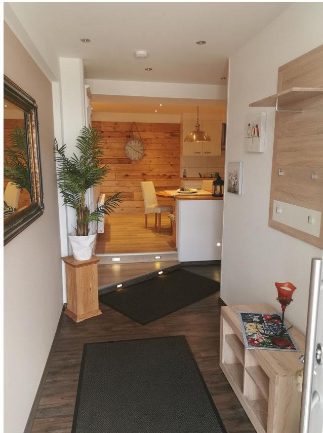
Flur einer Ferienwohnung