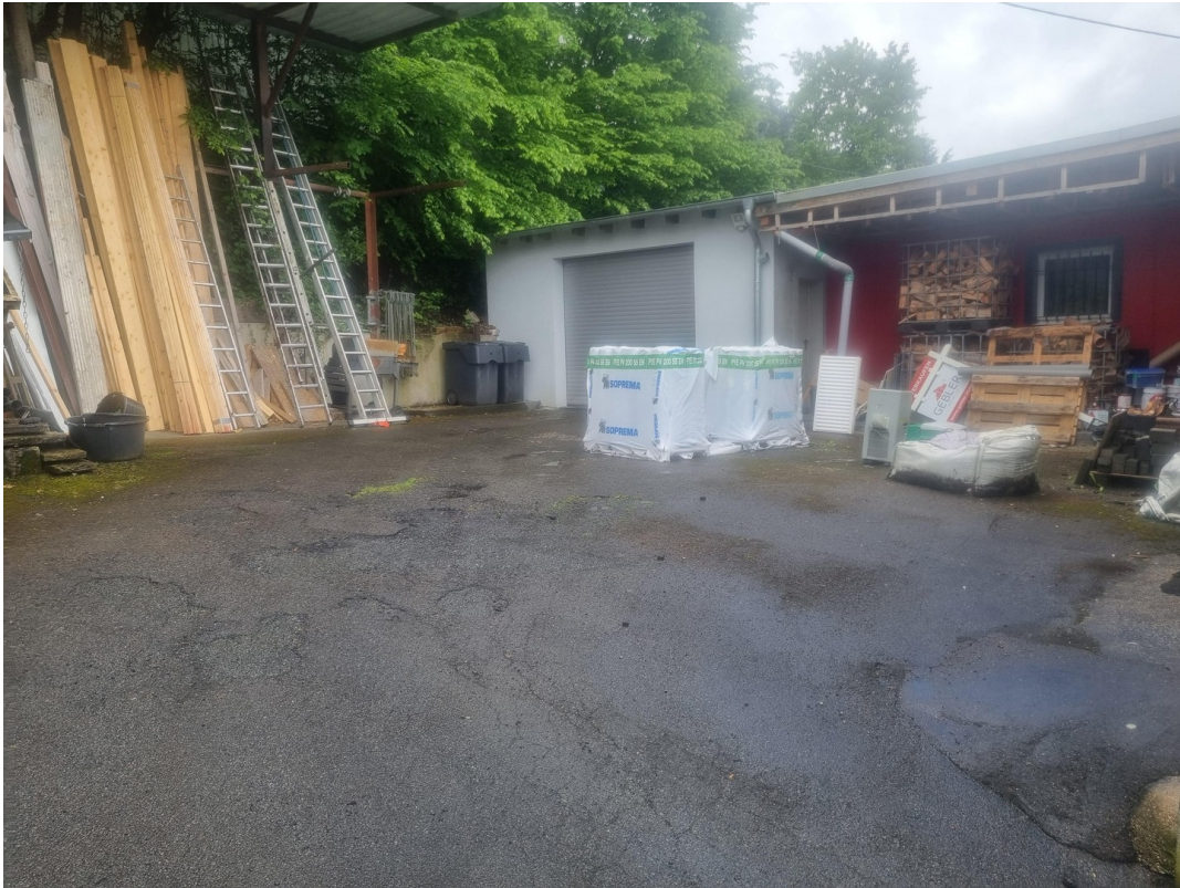
Lagerplatz incl. Zufahrt