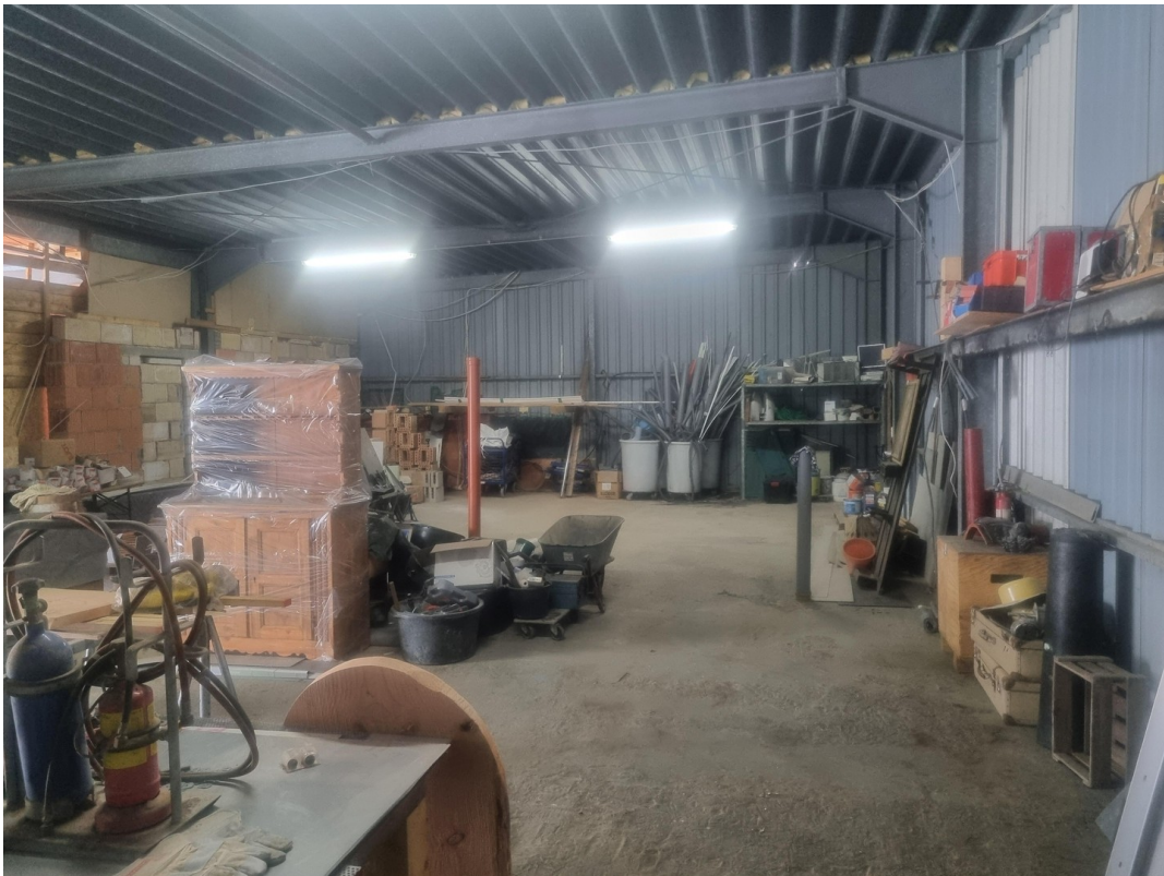
Lager oder Produktionshalle