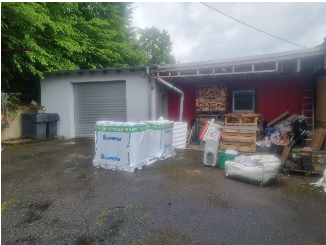
Lagerplatz incl. Zufahrt