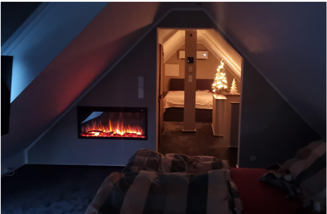
obere Etage Dachgeschoss