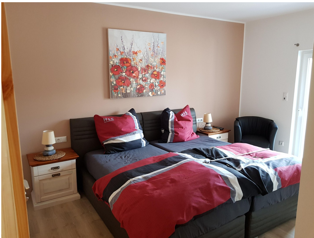
1 Doppelzimmer Ferienwohnung