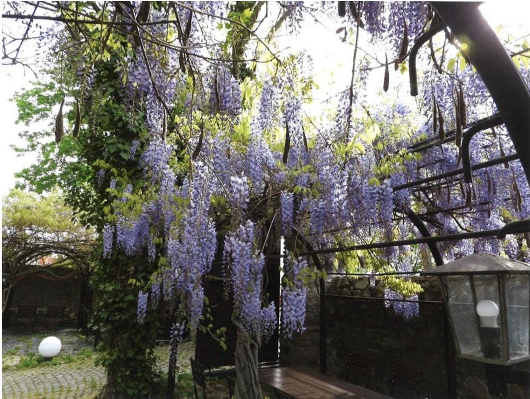
Innenhof im Sommer