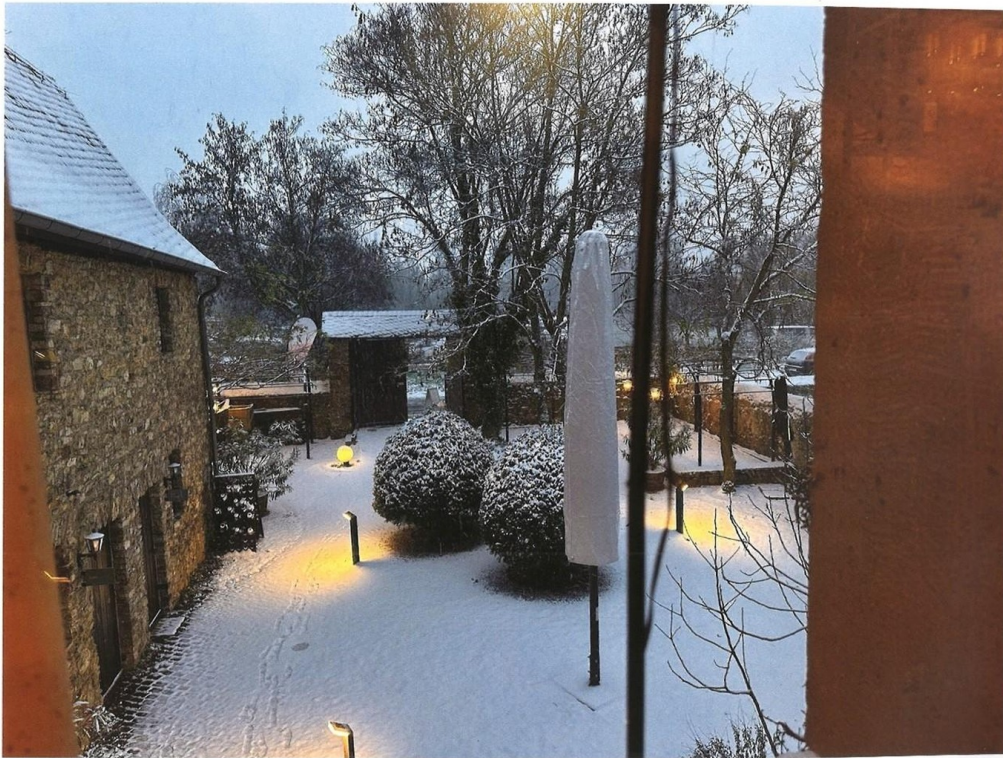
Innenhof im Winter