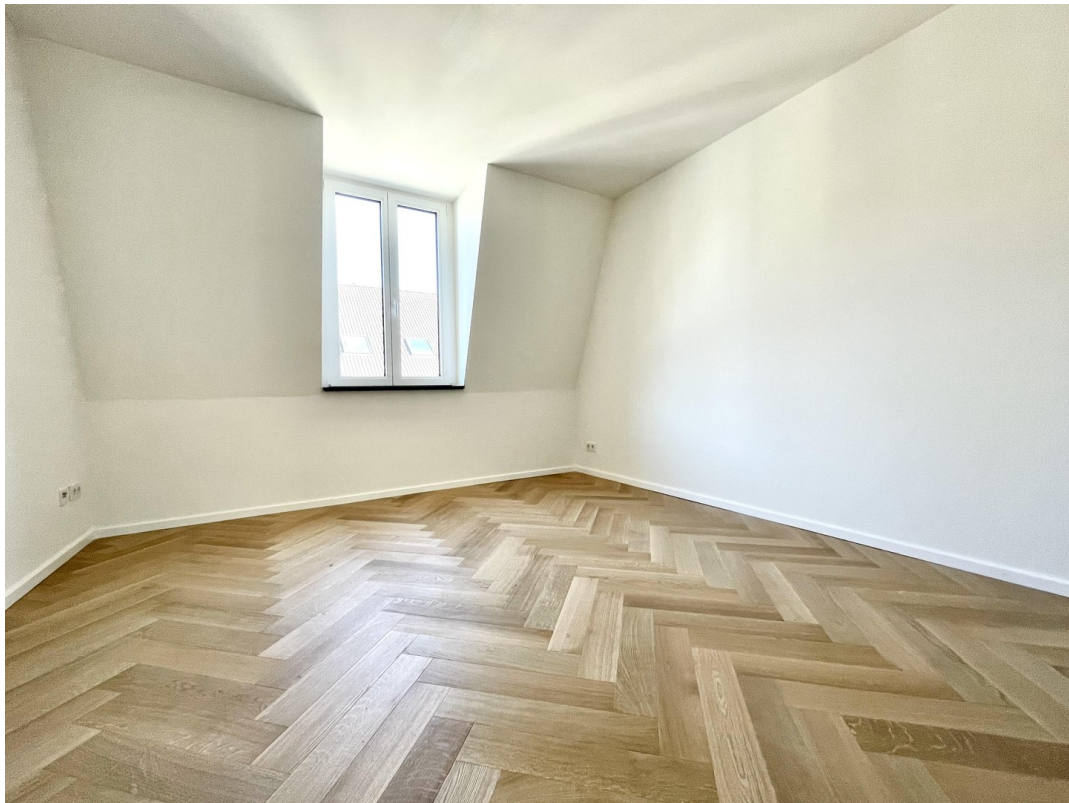
3 Schlafzimmer plus Büro