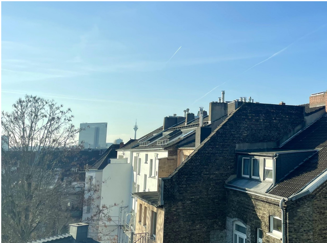
Blick über die Dächer