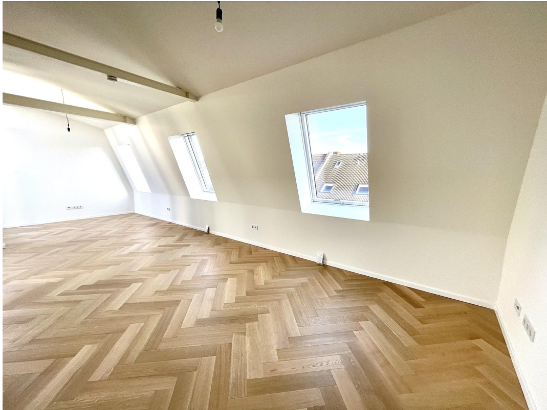
tolles Platzangebot Wohnraum