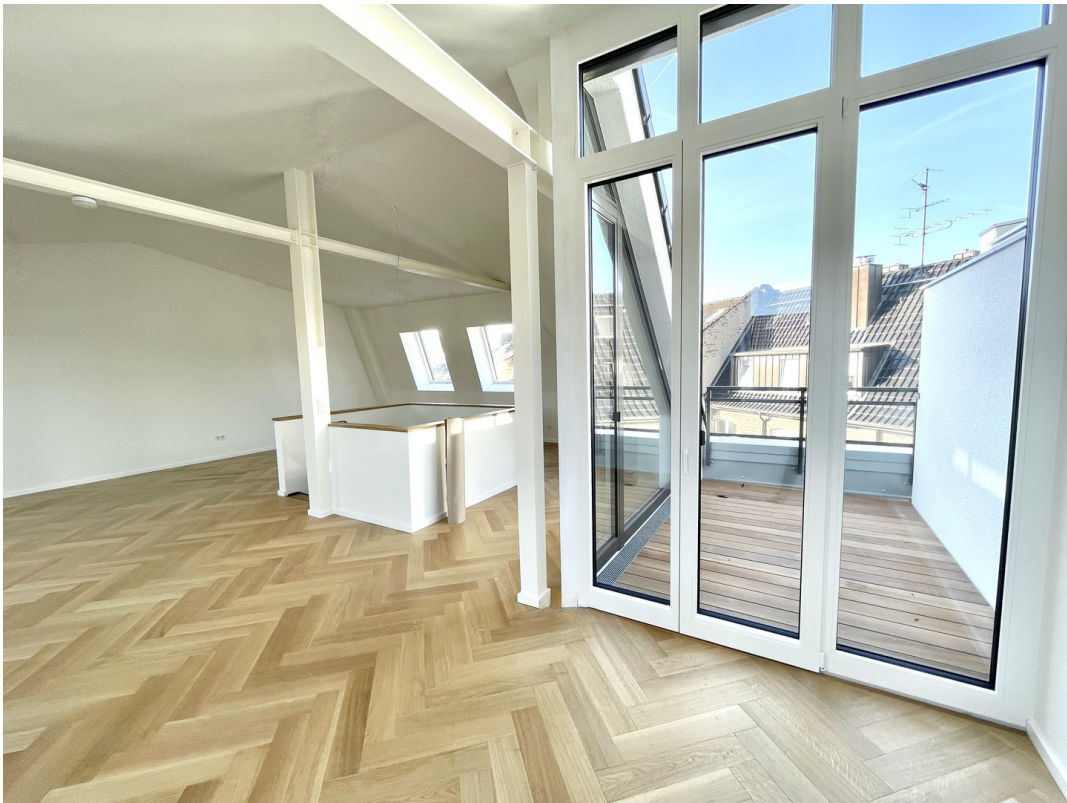
3,20m hohe Decken