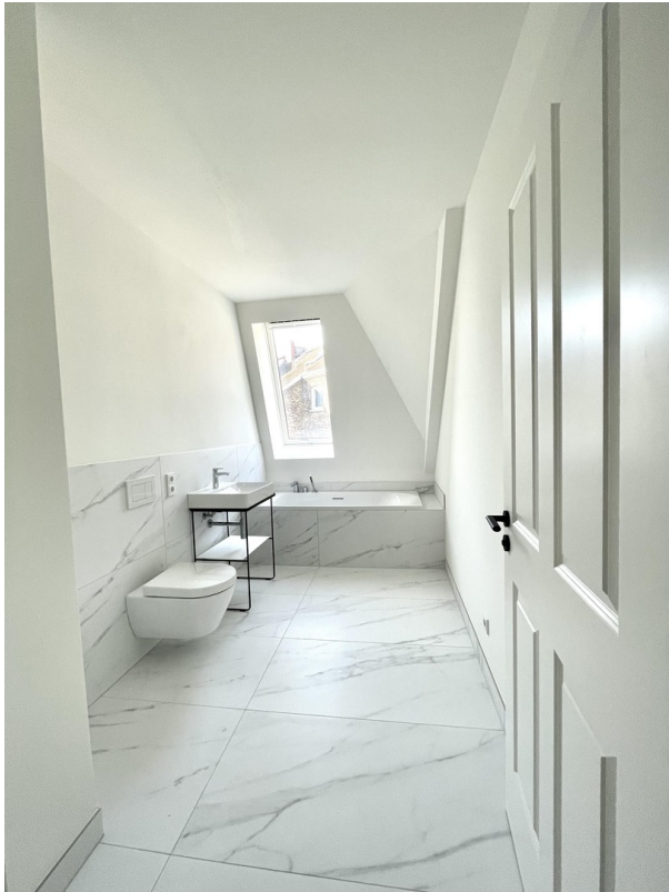
2 Bäder mit Fenstern