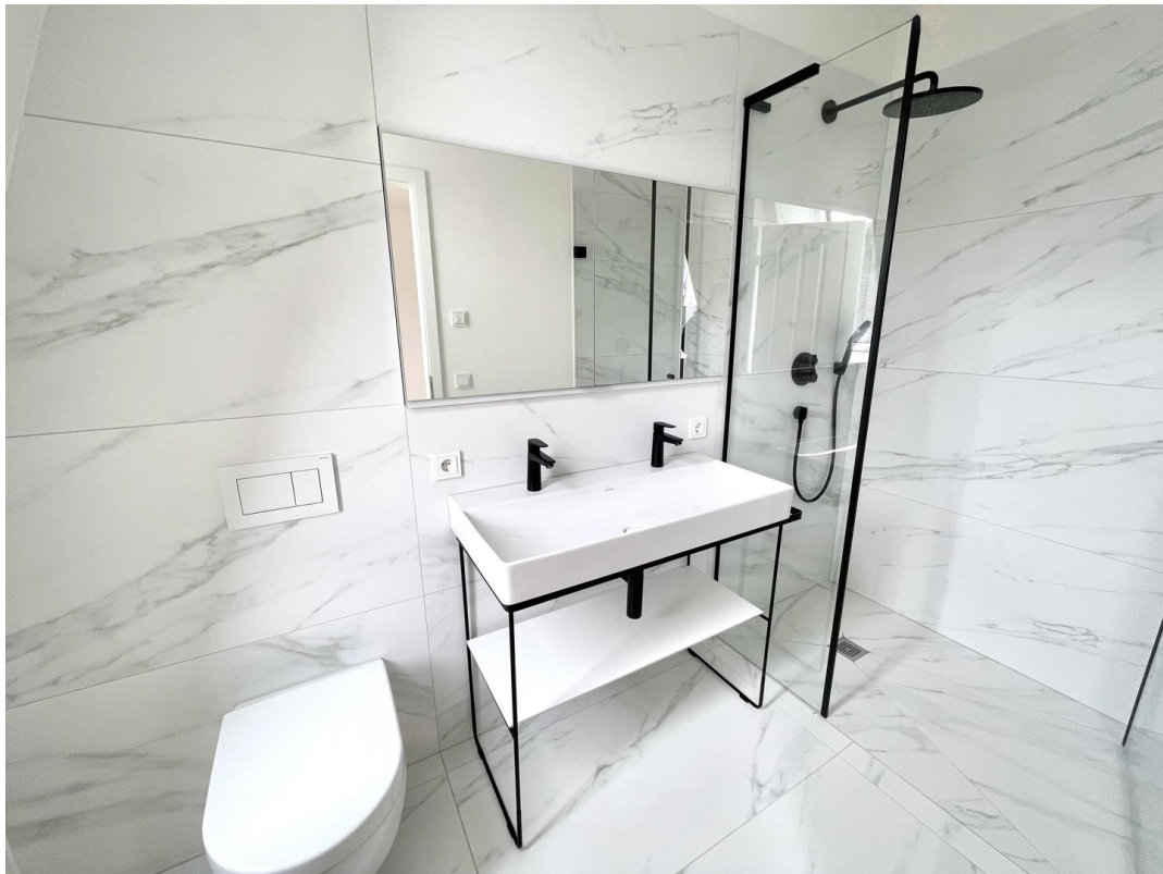
Ensuitebad mit bodengl. Dusche