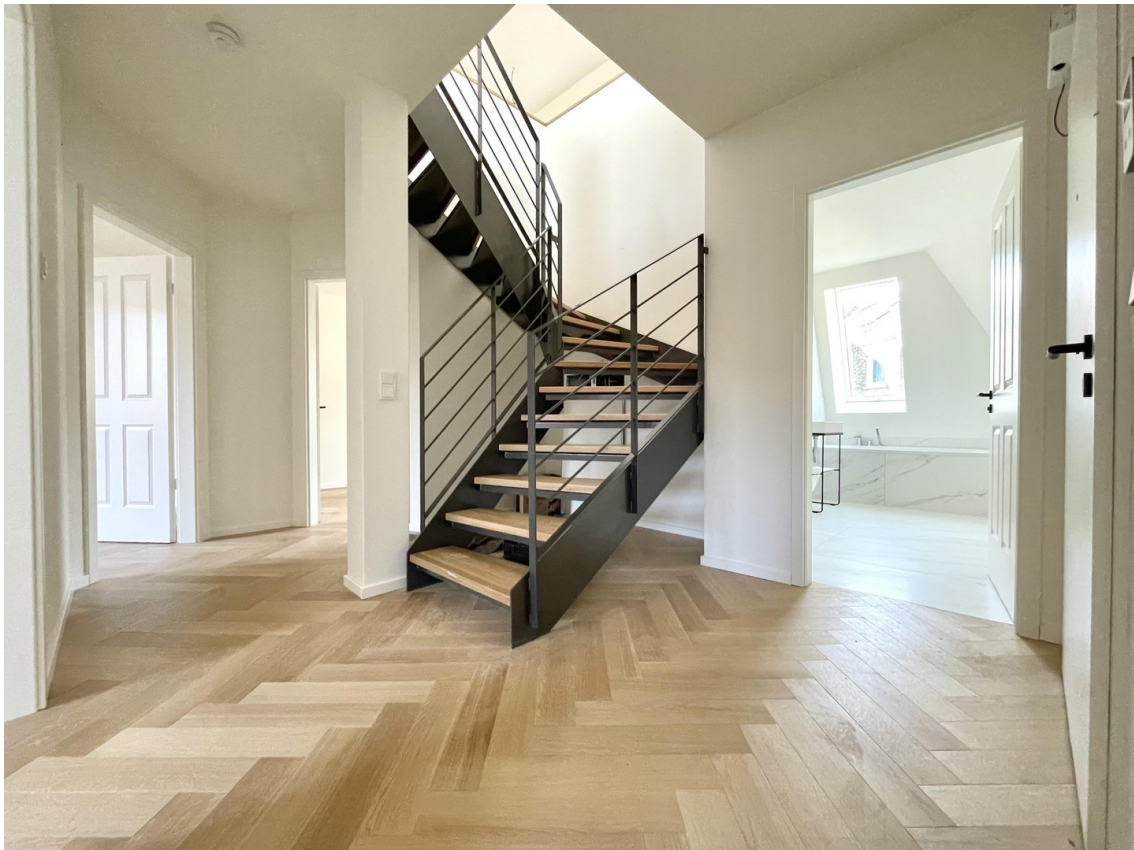
Neubau - Haus im Haus