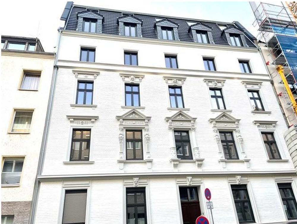
Stilaltbau von 1895