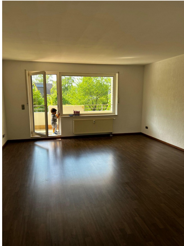
Balkonblick auf das Wohnzimmer