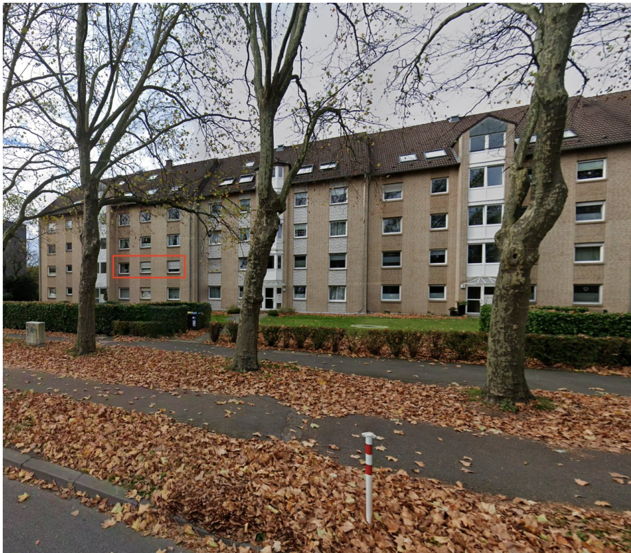
Außenansicht des Gebäudes