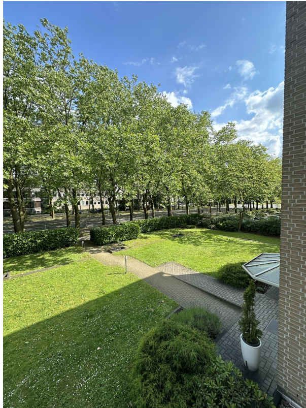
Vorderansicht der Wohnung