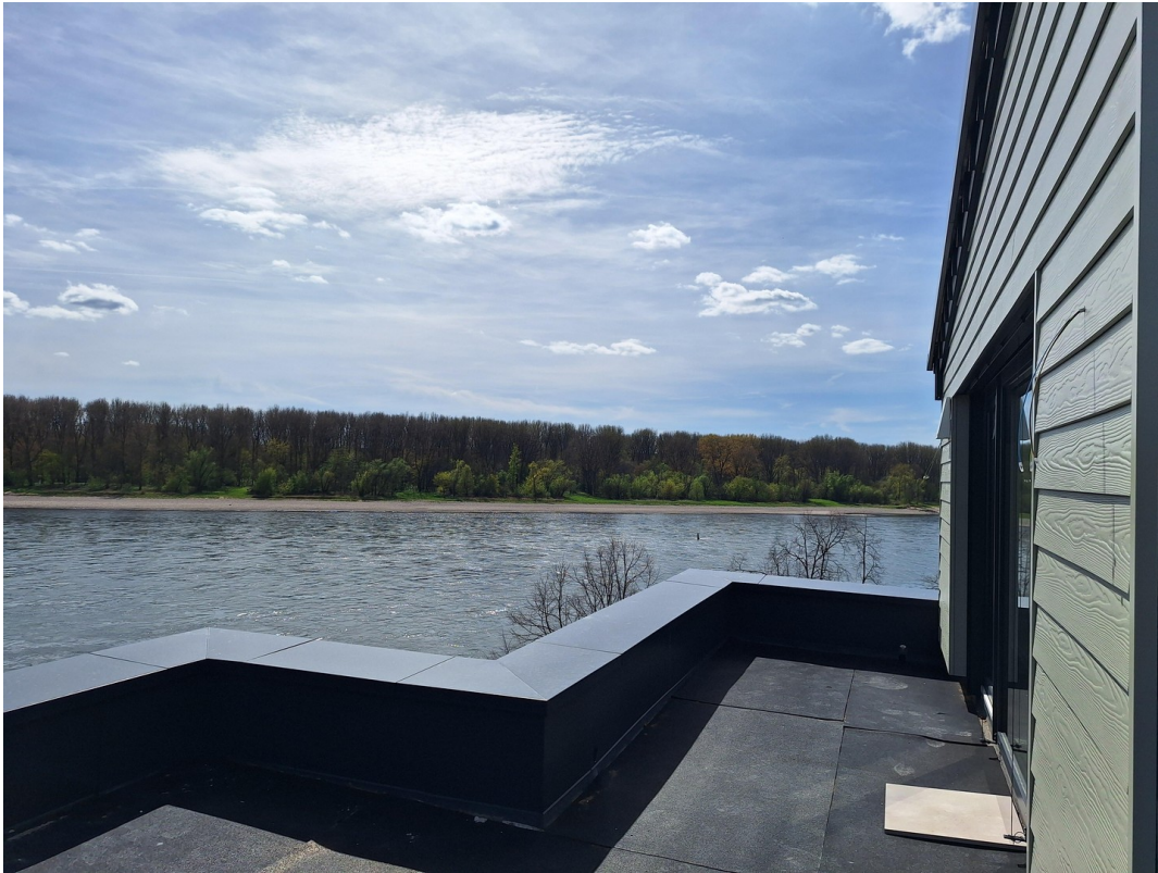
Penthouse Blick von Terrasse