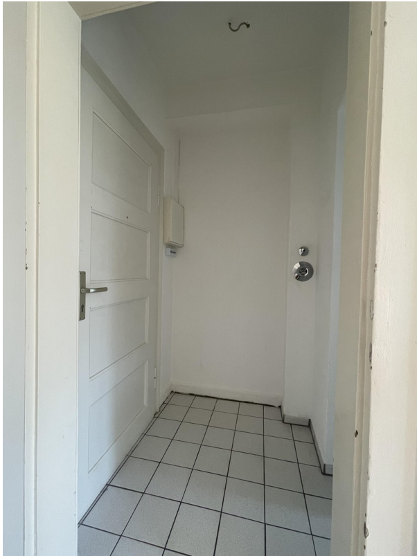
Flur und Wohnungstür