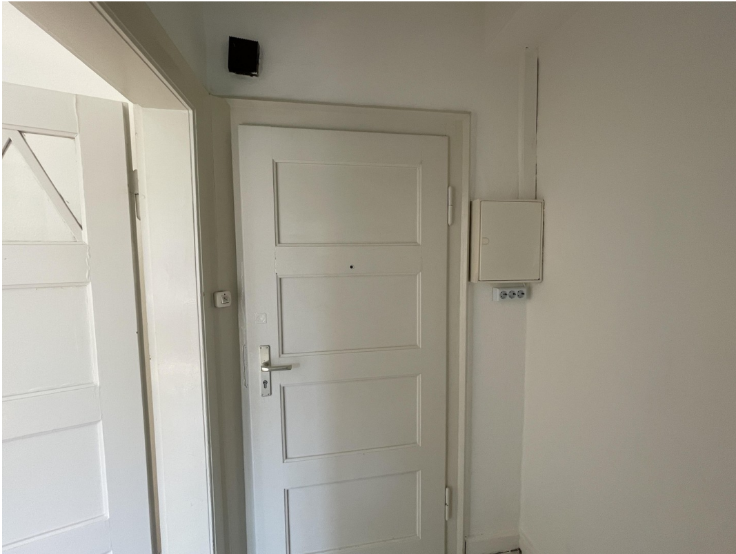
Flur und Wohnungstür