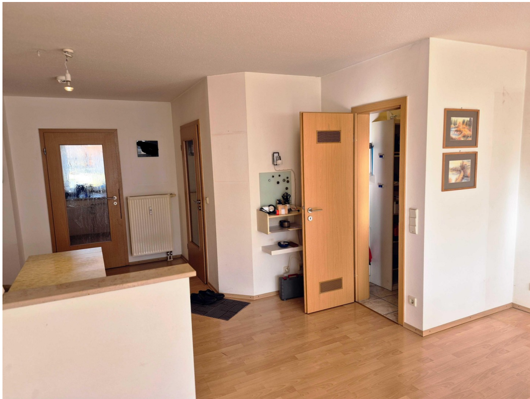
Wohnen + Abstellkammer