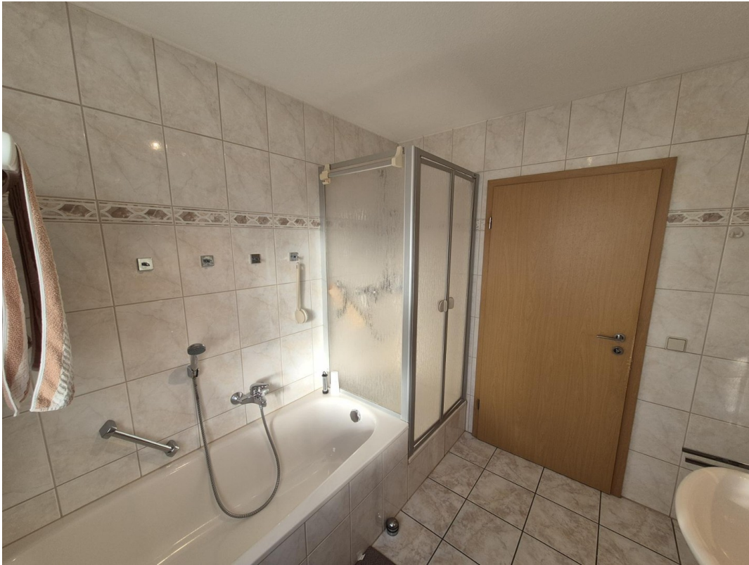
Bad Wanne + Dusche