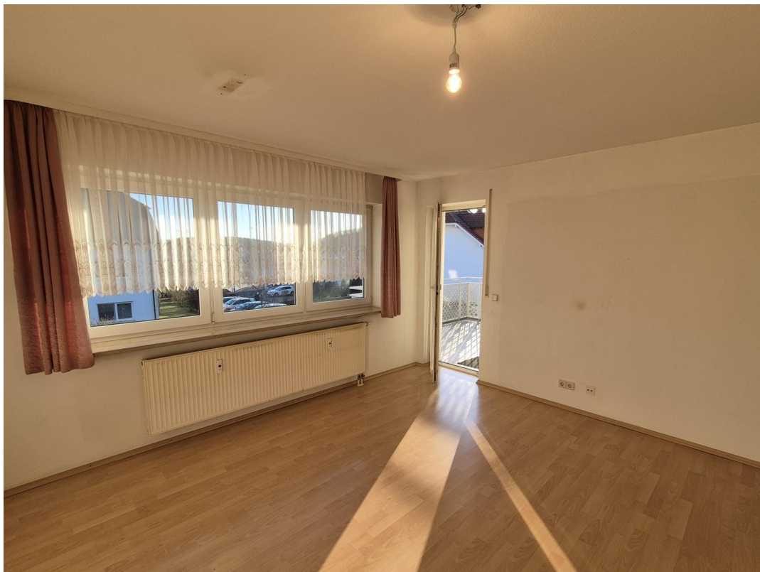
Wohnzimmer Austritt Balkon