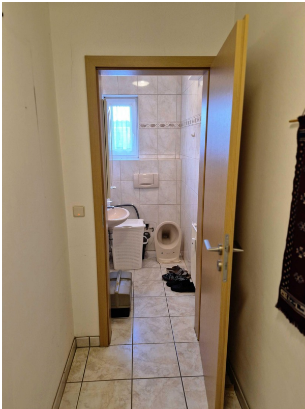
Flur + Gäste WC