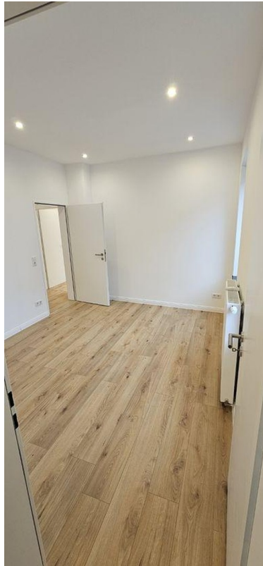
Zimmer 3 EG