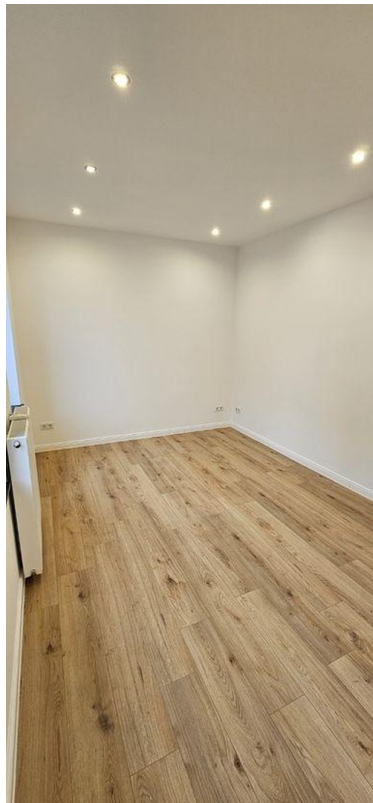
Zimmer 2 EG