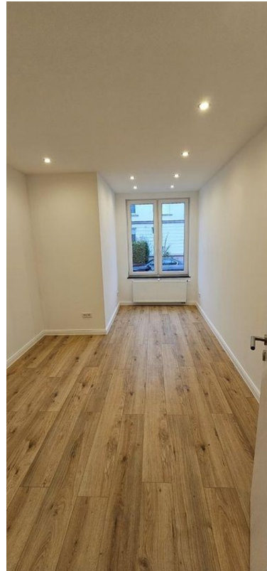
Zimmer 3 EG