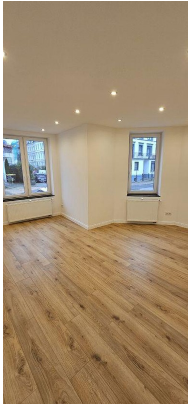
Zimmer 1 EG