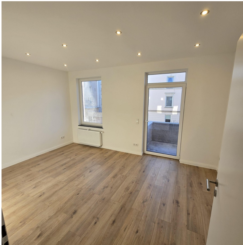
Zimmer 1 2.OG