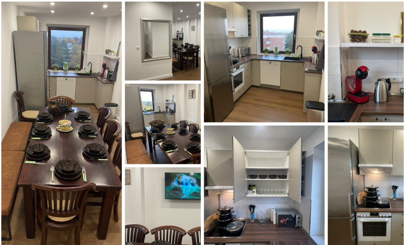
Essbereich mit smart TV