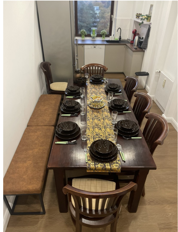
Wohn- / Essbereich