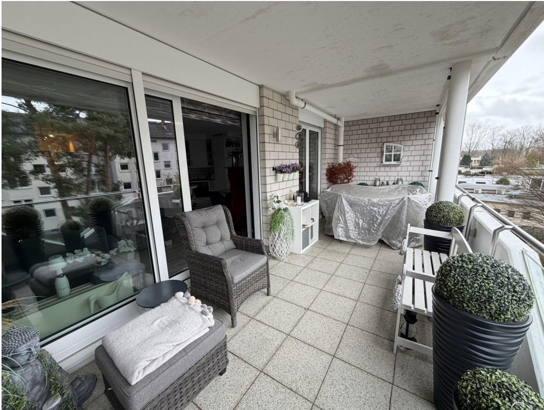
Großer Balkon mit Fensterfront