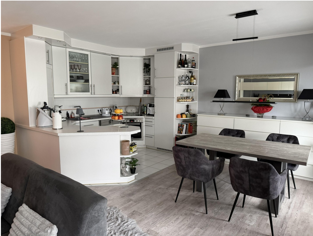
Offene Küche + Essen