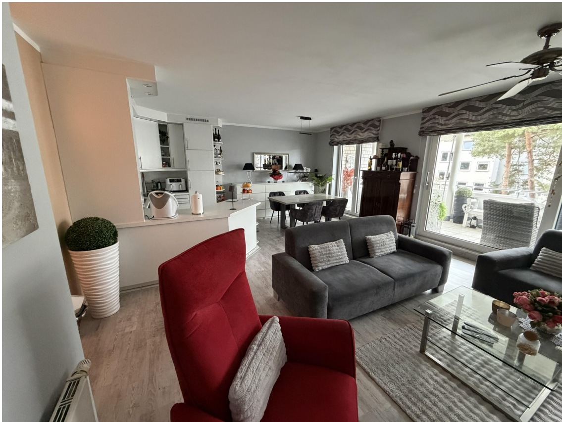
Blick auf's Wohn-Esszimmer