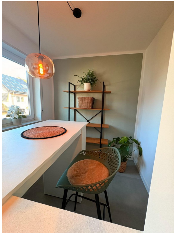
OG: Coffee Corner