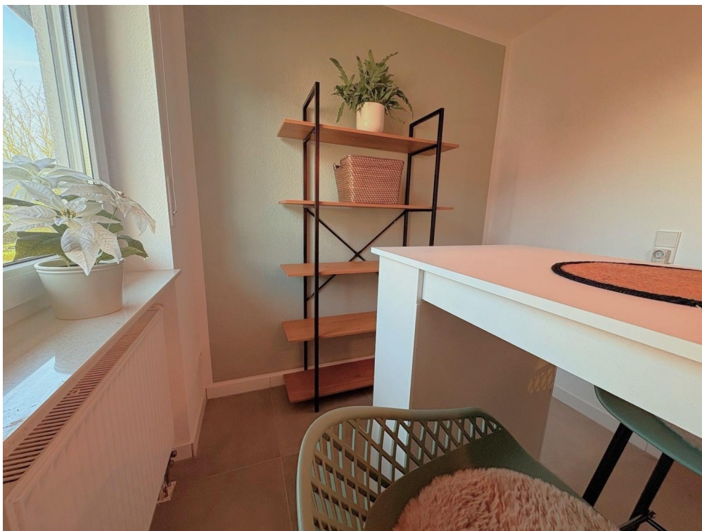
OG: Coffee Corner