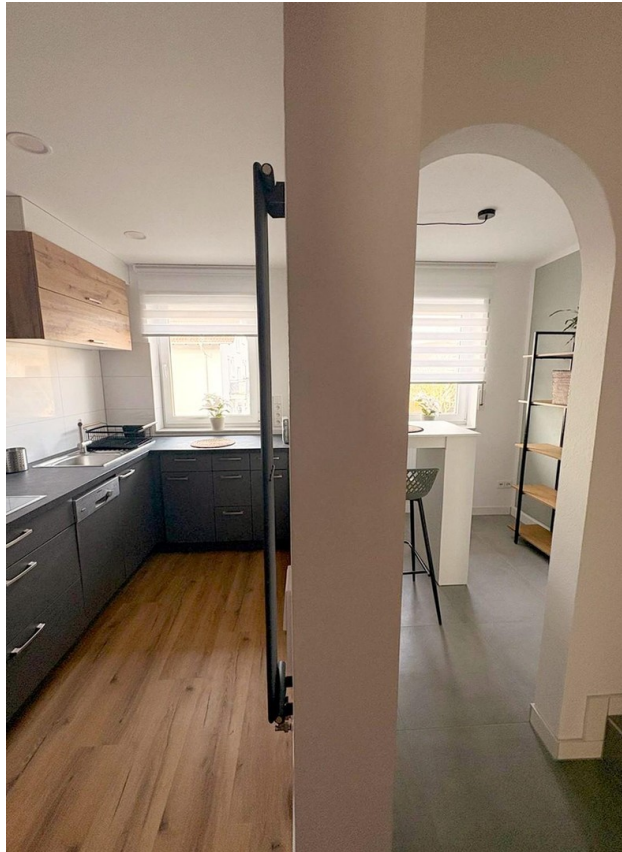
OG: Küche & Coffee Corner