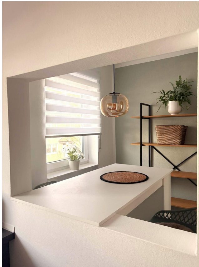
OG: Coffee Corner