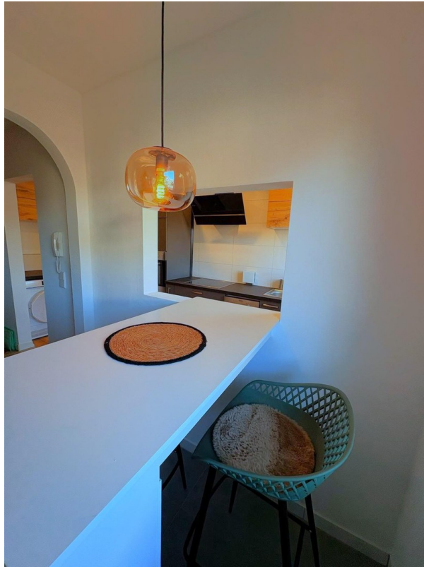
OG: Coffee Corner