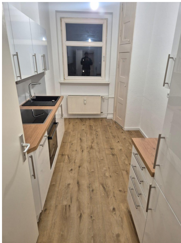
Küche mit großem Einbauschränk