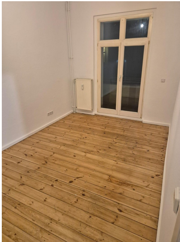
Zimmer II (Zugang zum Balkon)