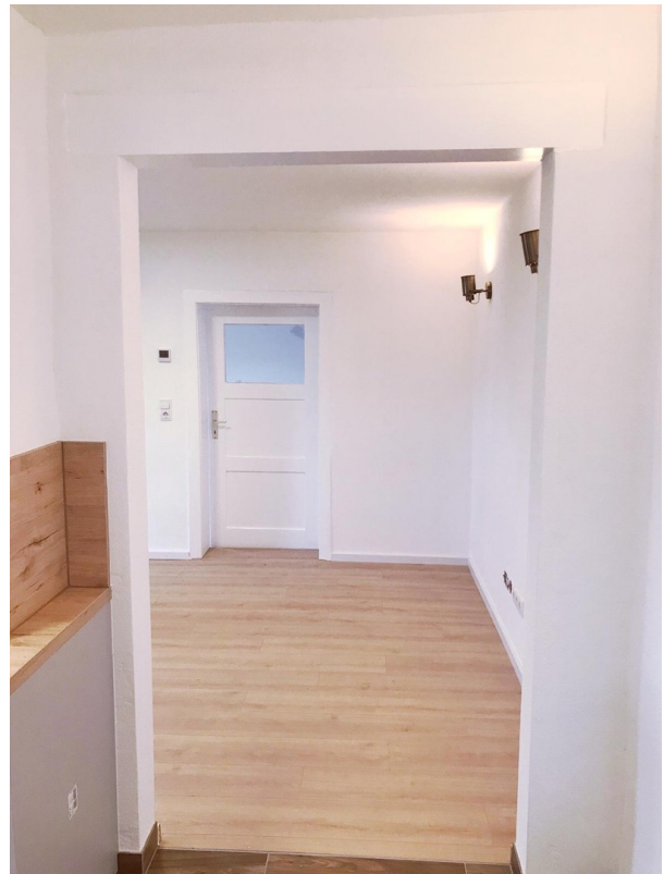
Flur Küche / Wohnen