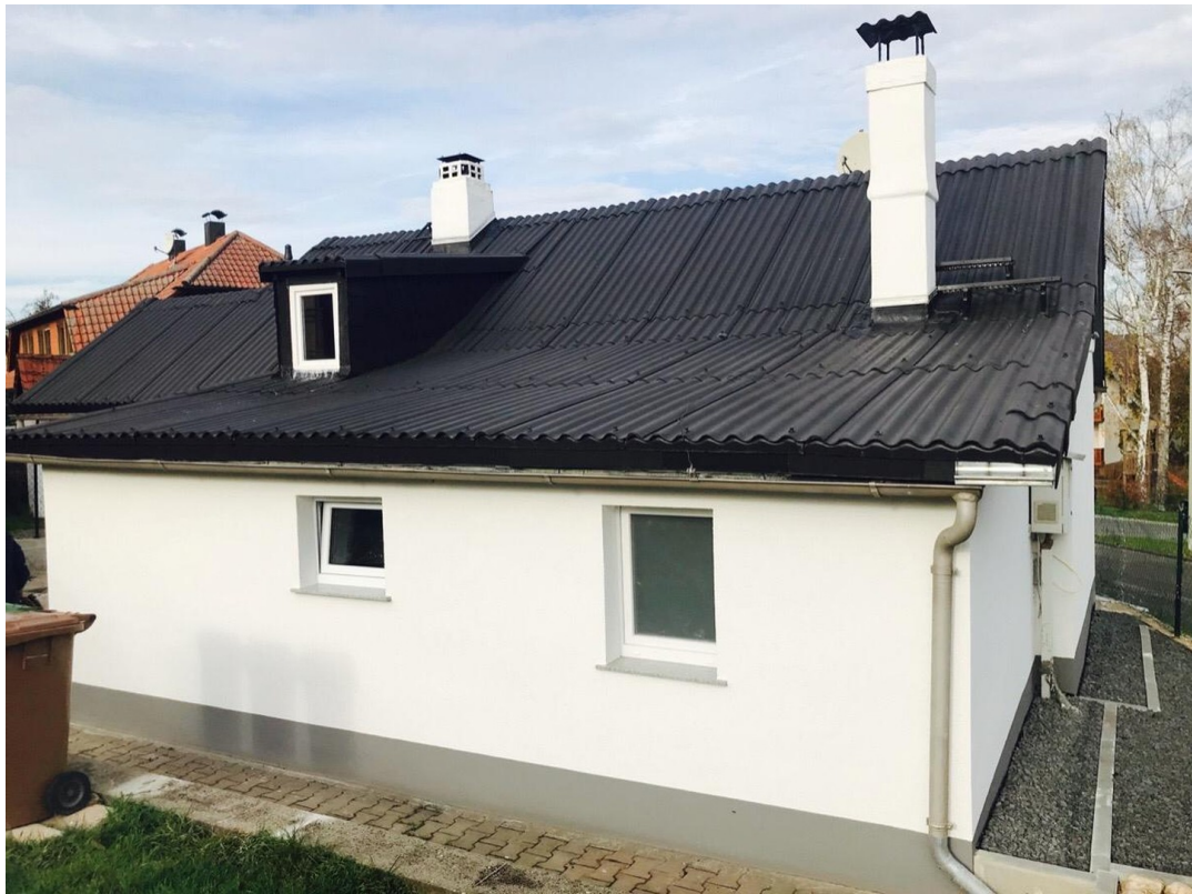
Ansicht Haus von hinten