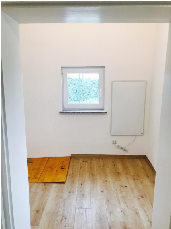
Eingangsbereich / Windfang