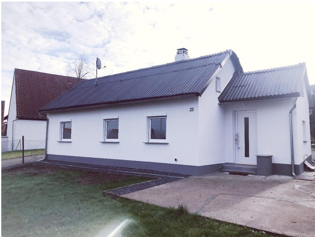
Ansicht Haus von vorneTerrasse