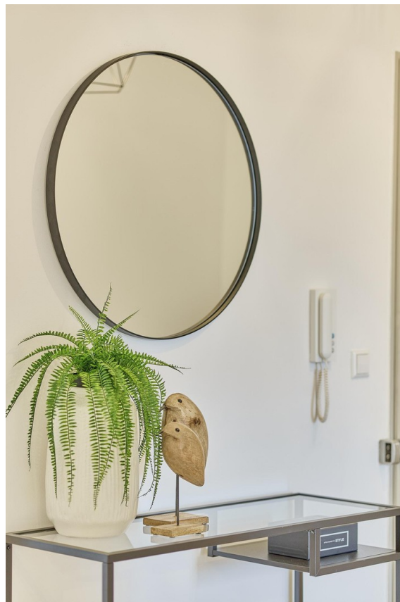
Details - Flur