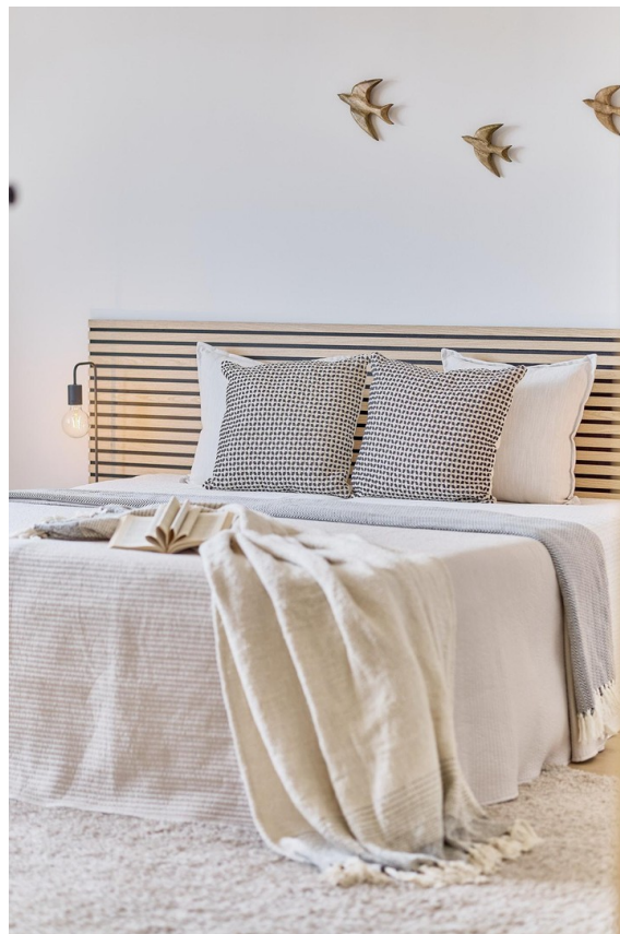
Details - Schlafzimmer