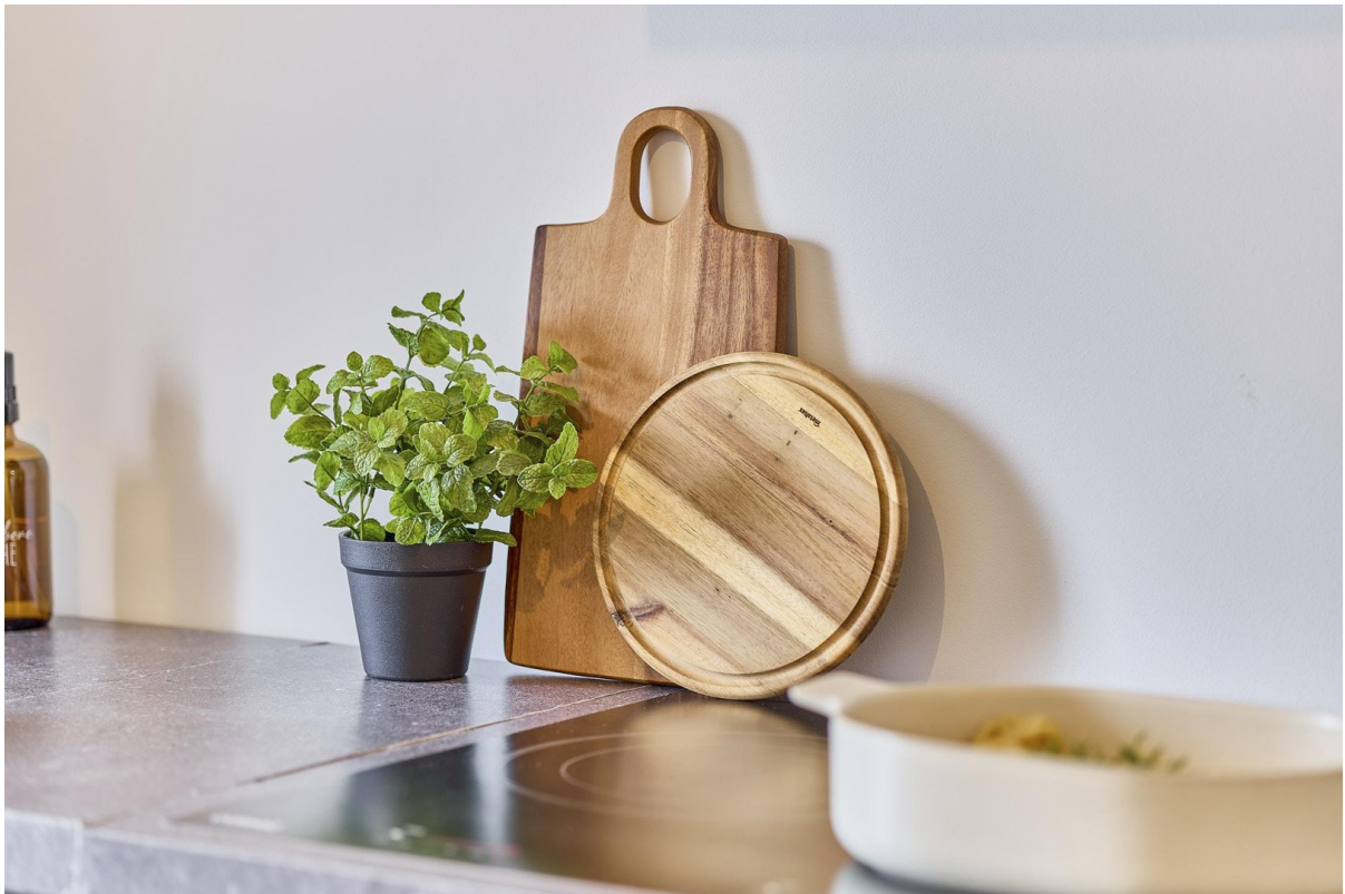
Details - Küche