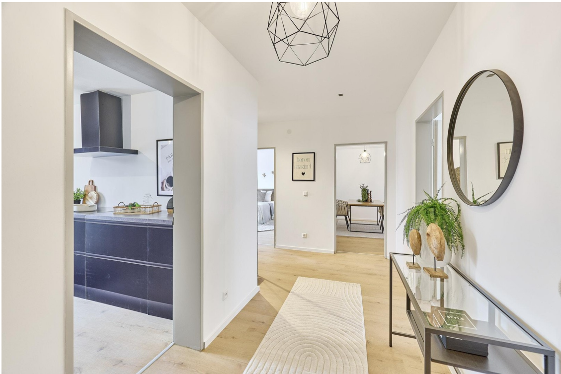
Flur mit Blick vom Eingang