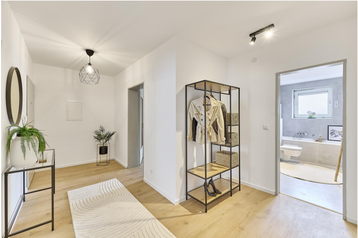
Flur mit Blick zum Eingang