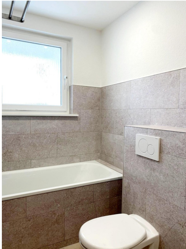
neu renoviertes Bad