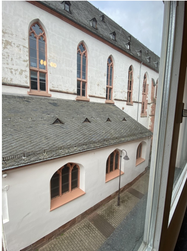
Ausblick auf den Fußgängerweg