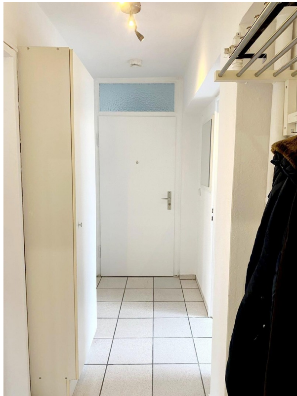
Flur mit Kleiderschrank