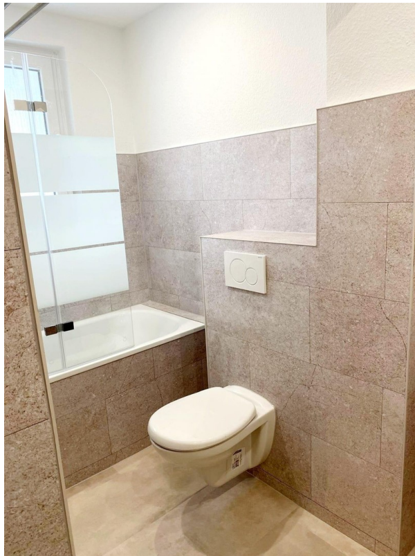
inkl. Badewanne & Trennwand