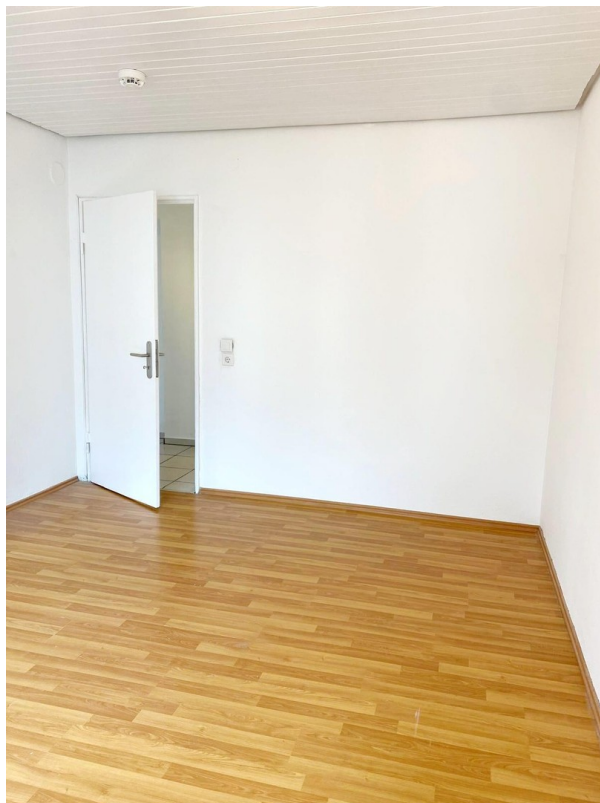
das 15qm großen WG-Zimmer