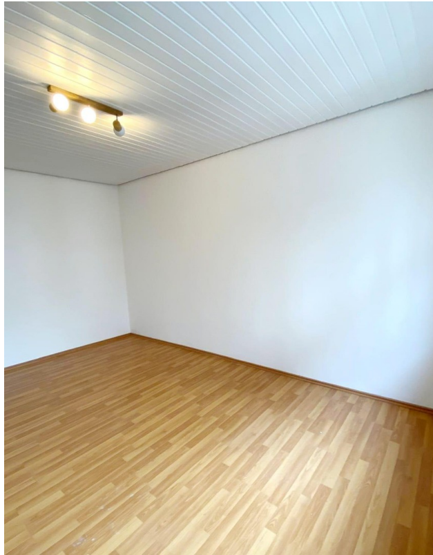
WG Zimmer inkl. Deckenlampe