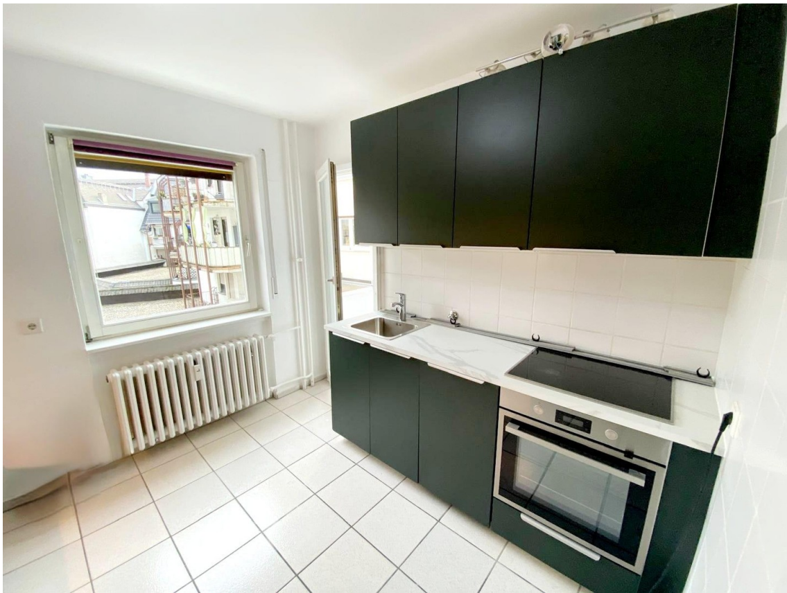
Küchenzeile inkl. Spülmaschine