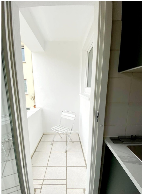
Balkon mit Blick in Innenhof