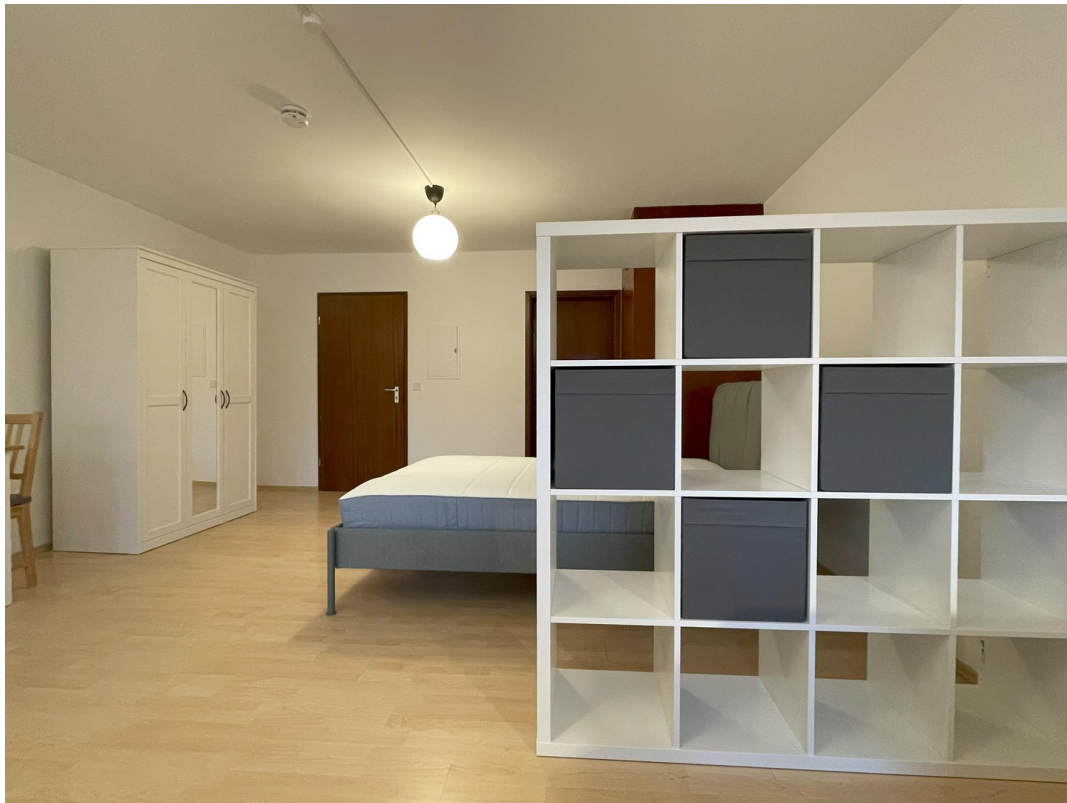
Zimmer Richtung Küche + Bad -2