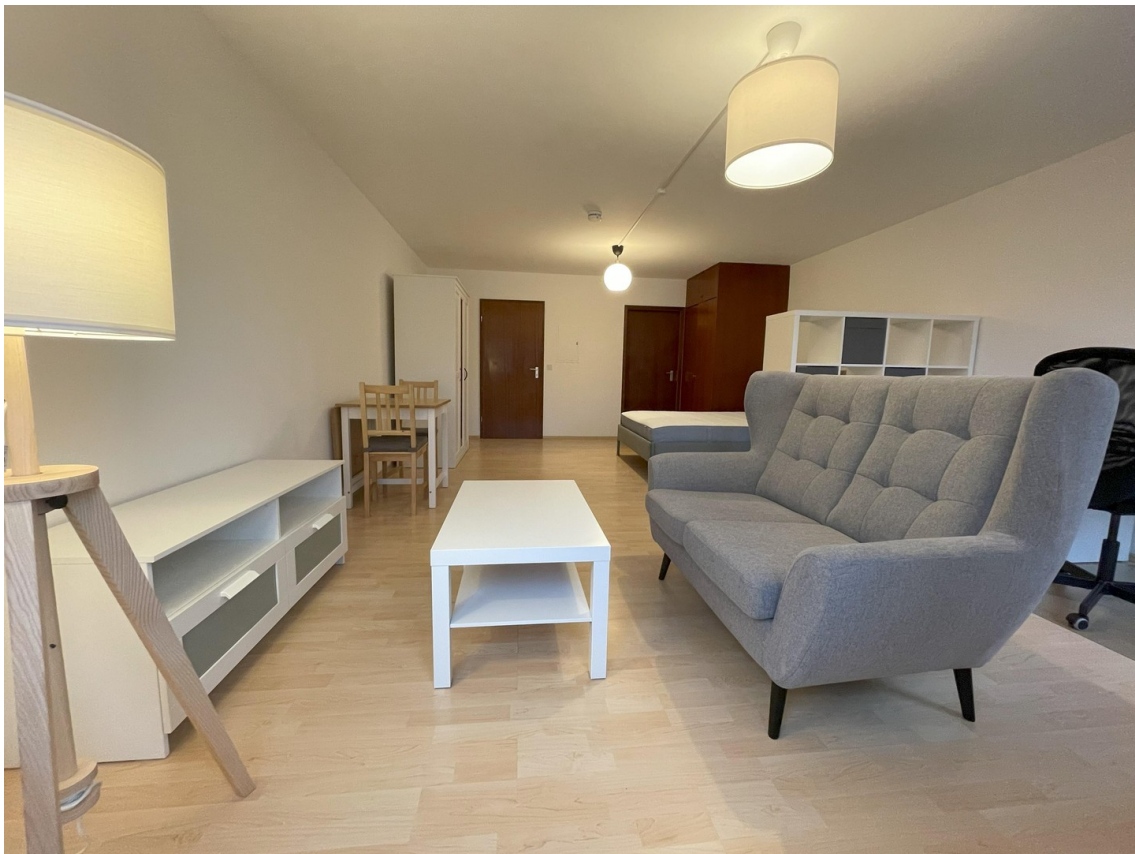
Zimmer Richtung Küche und Bad