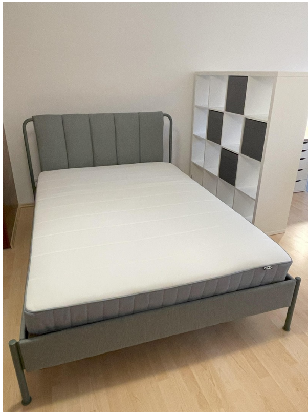
Schlafbereich mit Raumteiler