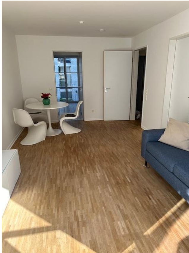
Blick zur Küche