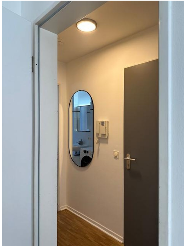
Eingang mit Gegensprechanlage