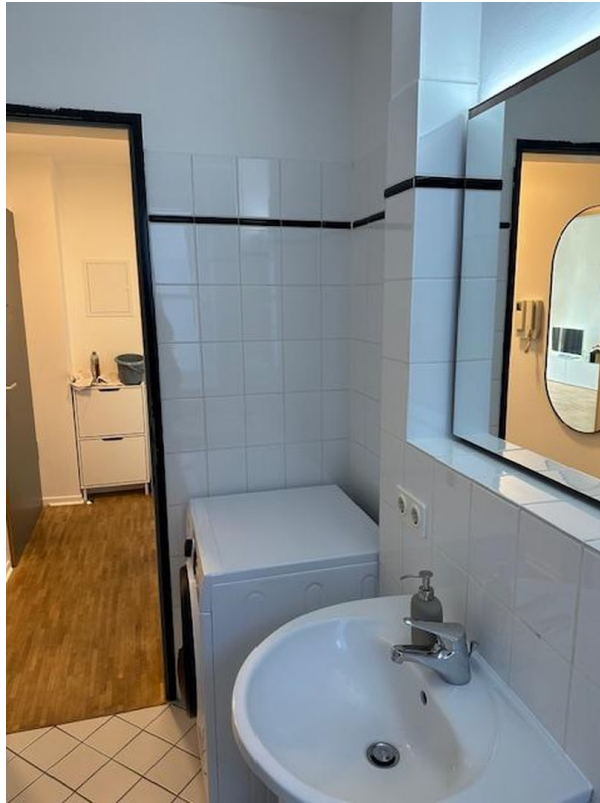
Bd inkl. Waschmaschine