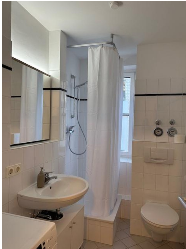
Bad mit Fenster