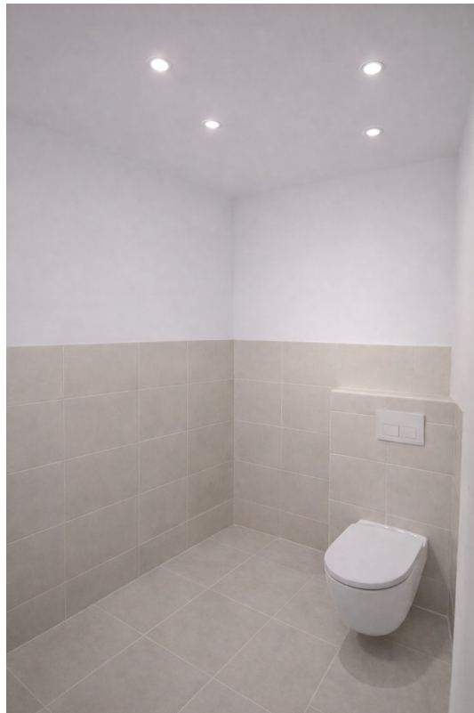
Bad mit Toilette