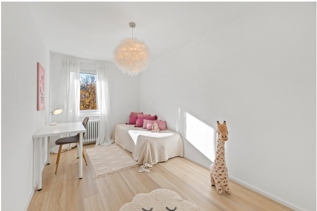
Kind / Zimmer 2