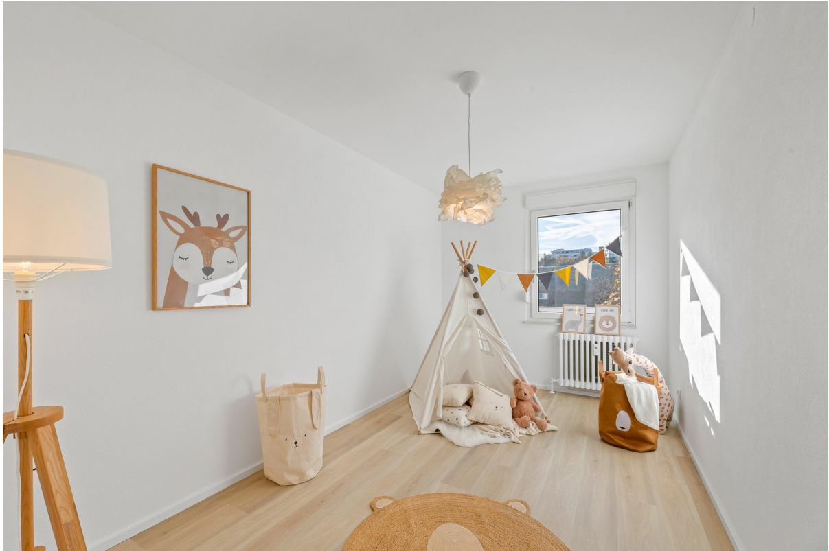
Kind / Zimmer 1