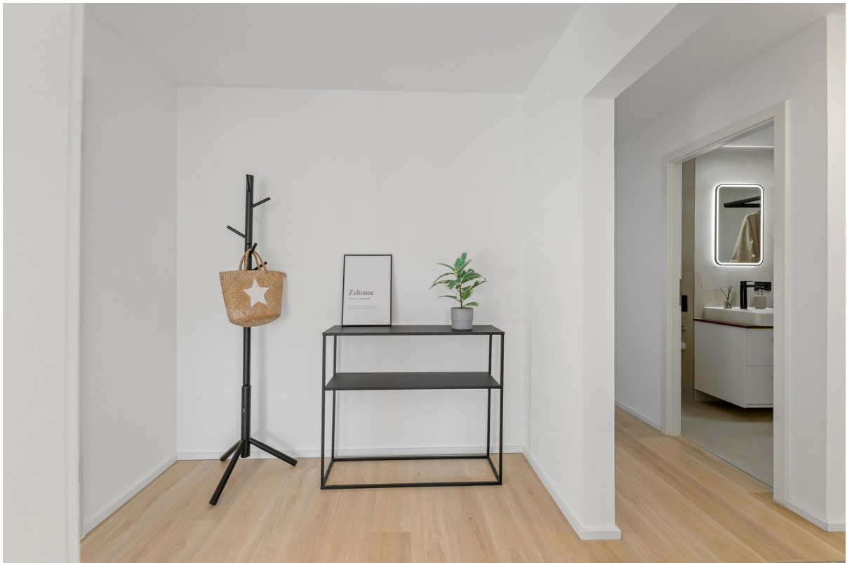
Vorraum im Flur