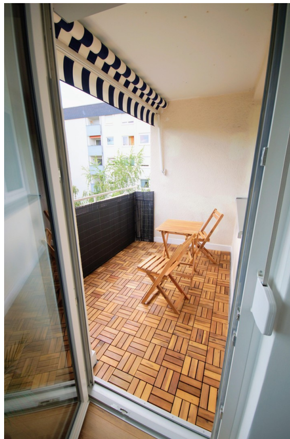
Balkon zu Z 1