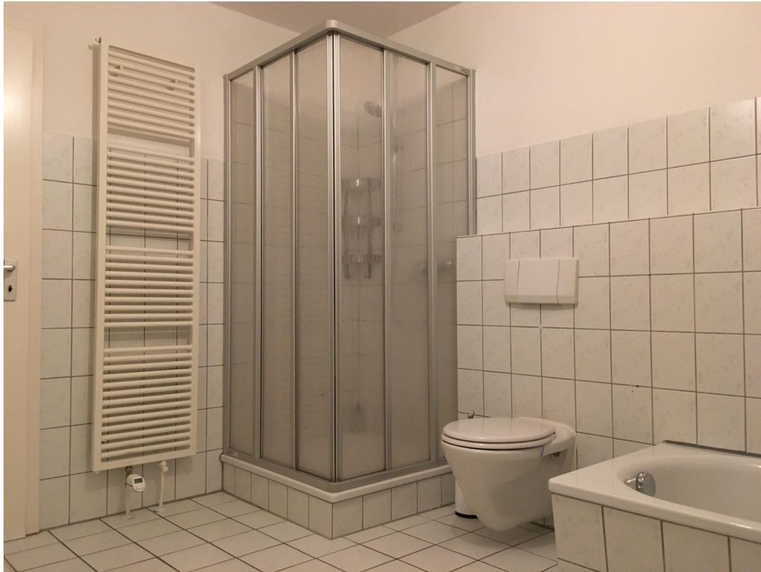
Dusche + Badewanne