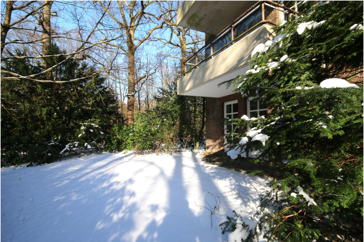
Blick Richtung Alster