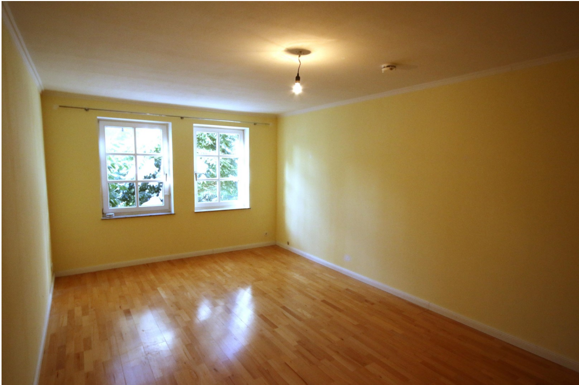
Zimmer 22 qm