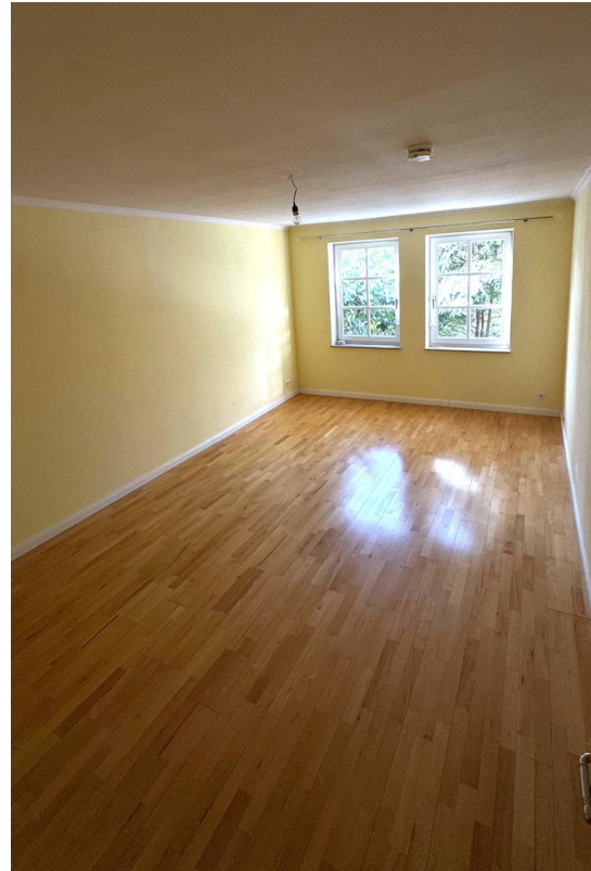
Zimmer 22 qm