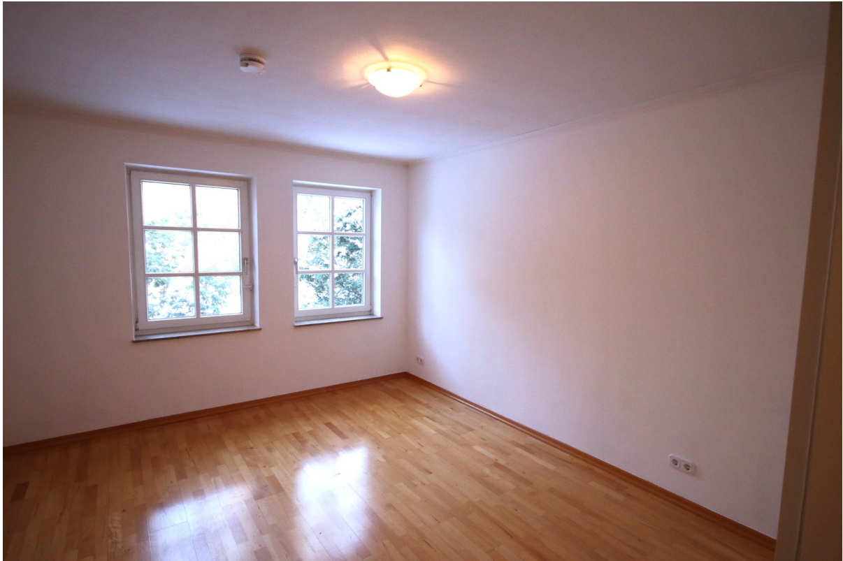
Zimmer 16 qm