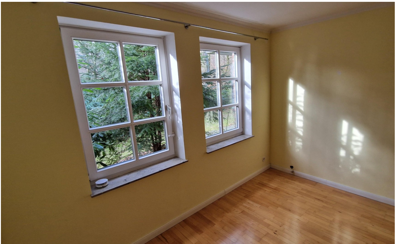
Zimmer 22 qm