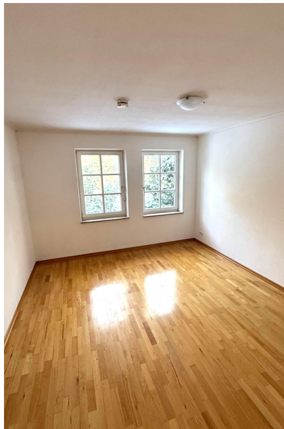
Zimmer 16 qm