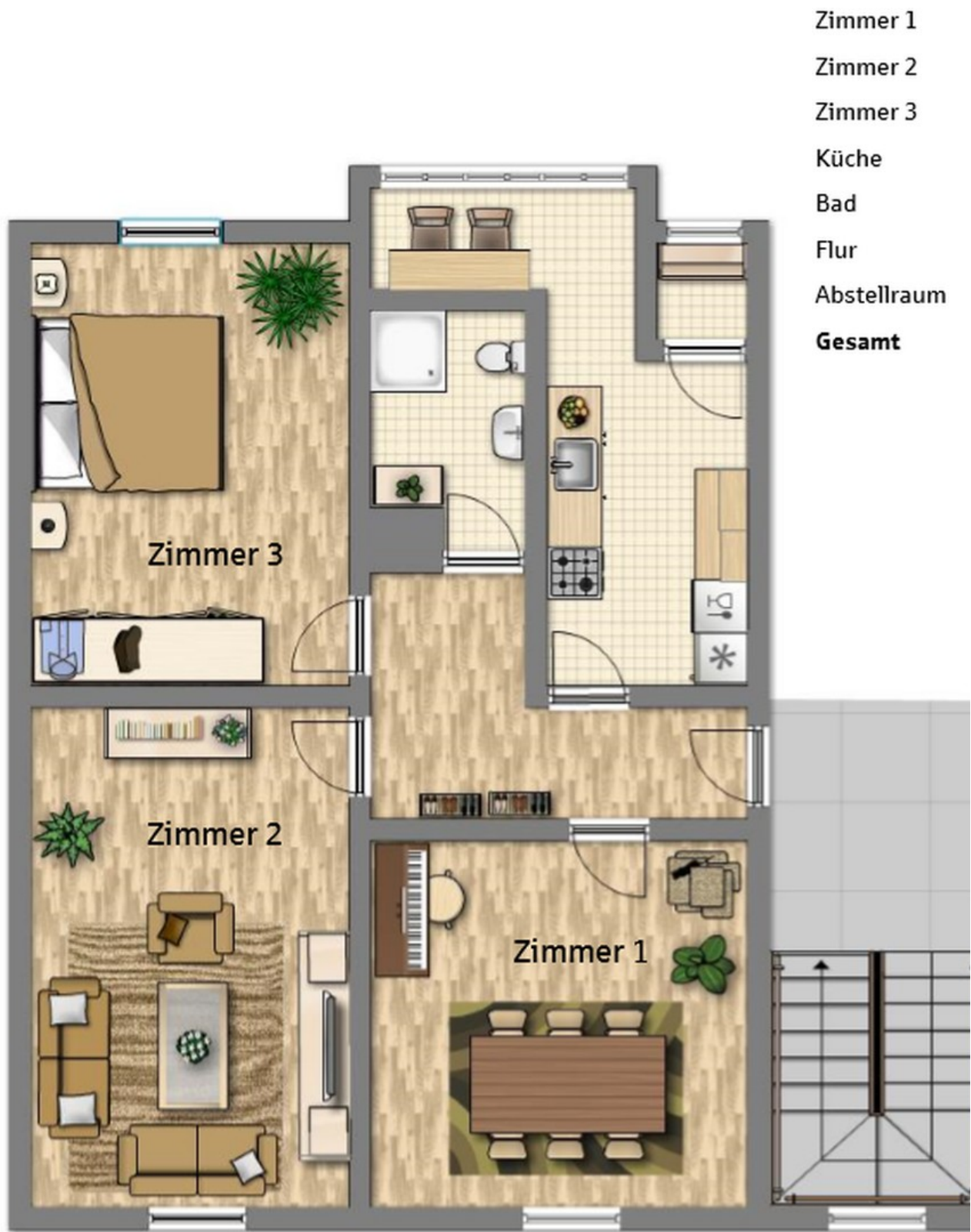
Grundriss 3-Zi-82QM EG