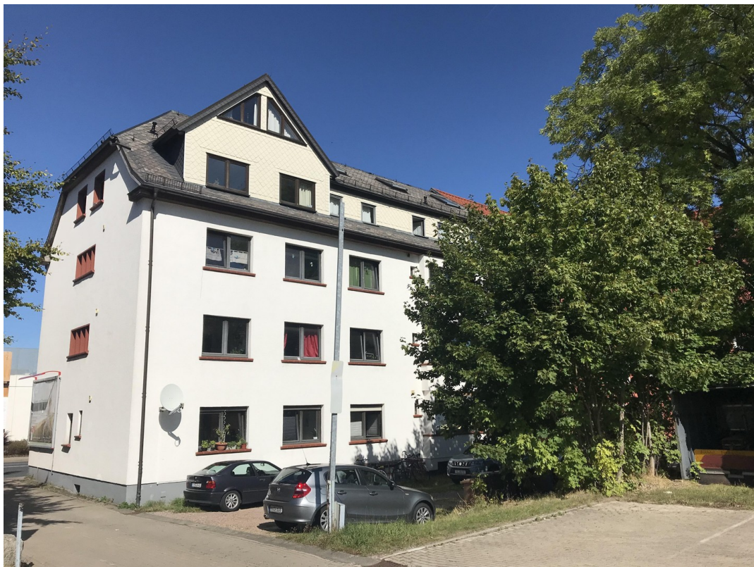
Rückseite mit Parkplätzen