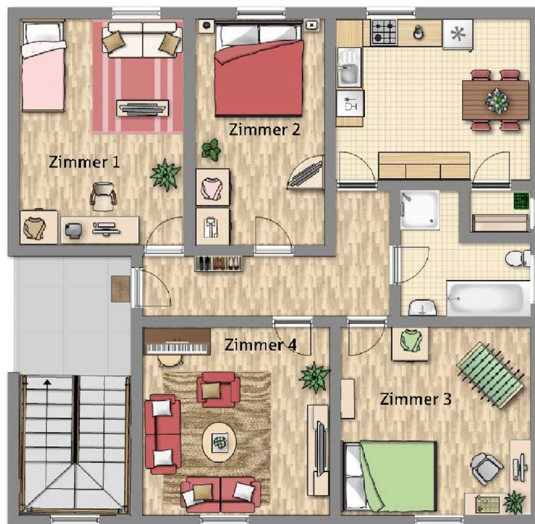
Grundriss 4-Zi- 100 qm 1 OG