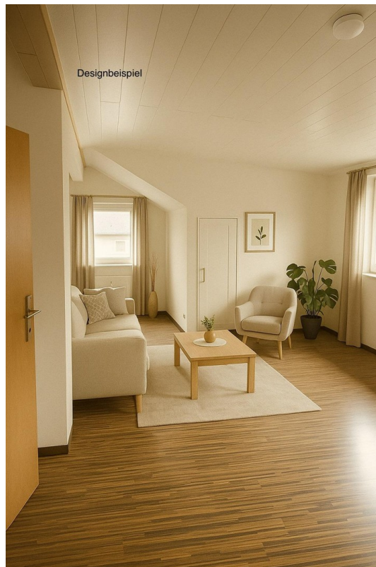
Wohnzimmer DG - Designbeispiel