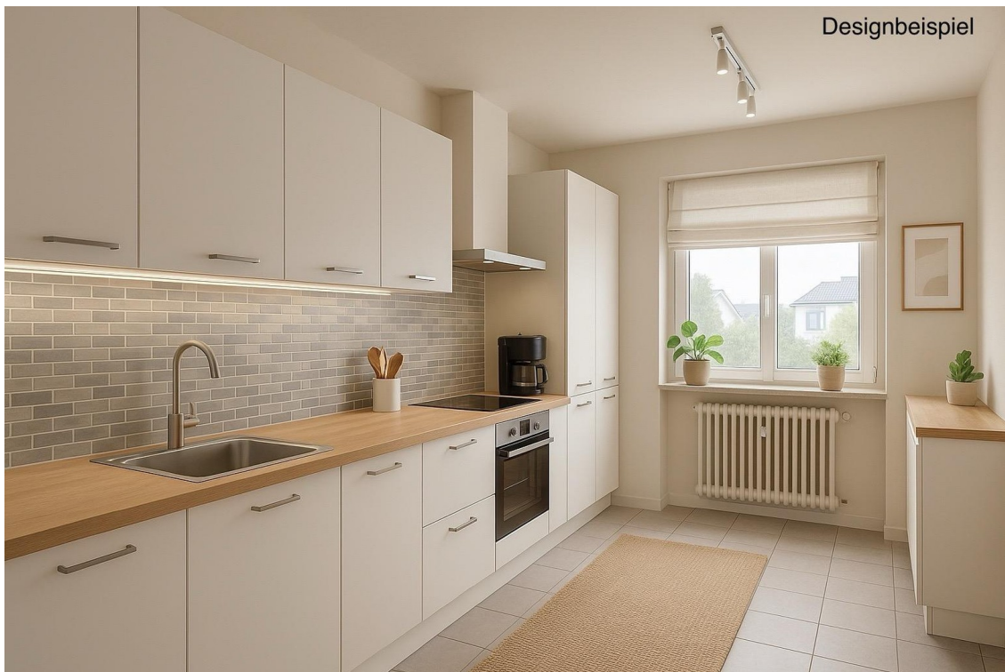
Küche KG Designbeispiel