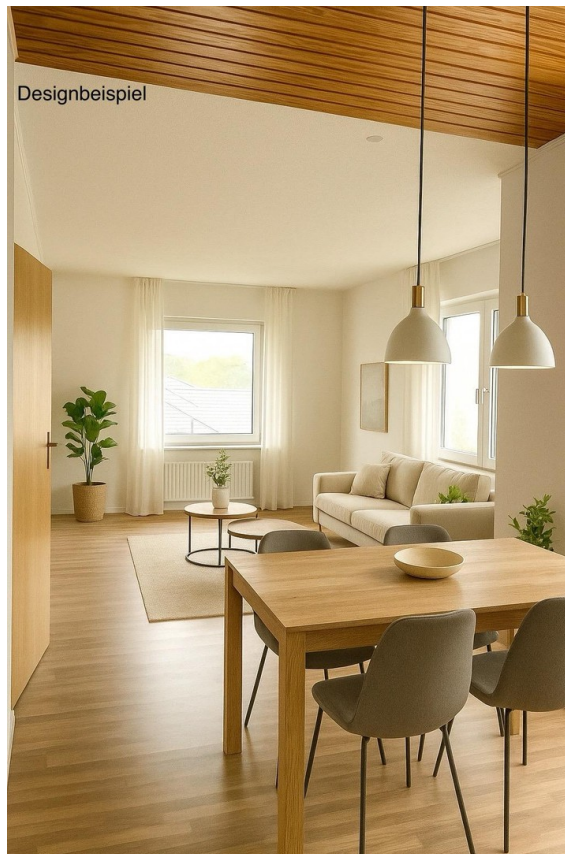
Wohnzimmer EG Designbeispiel