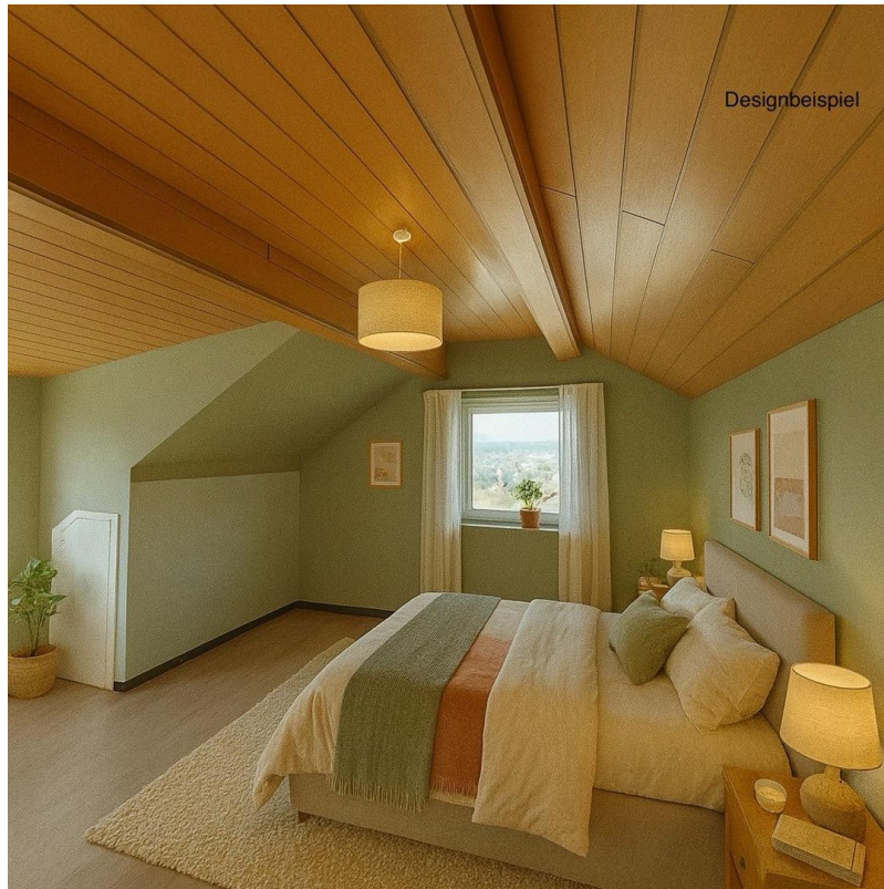
Schlafzimmer DG Designbeispiel