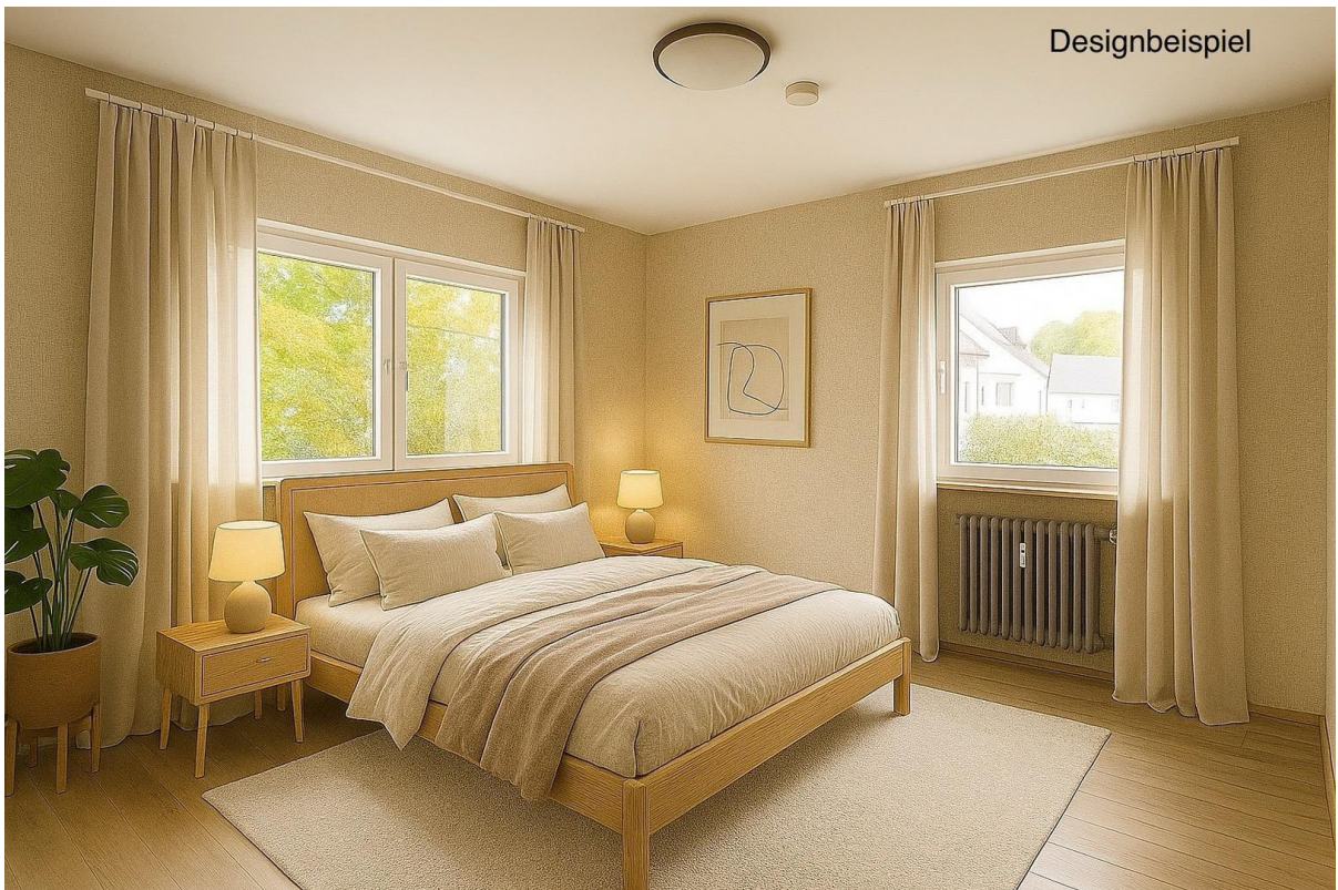
Schlafzimmer EG Designbeispiel