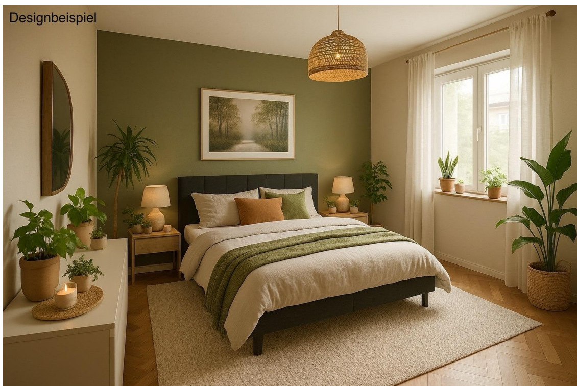
Schlafzimmer KG Designbeispiel