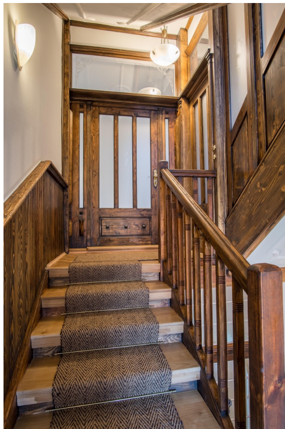
Treppenhaus zur Wohnung