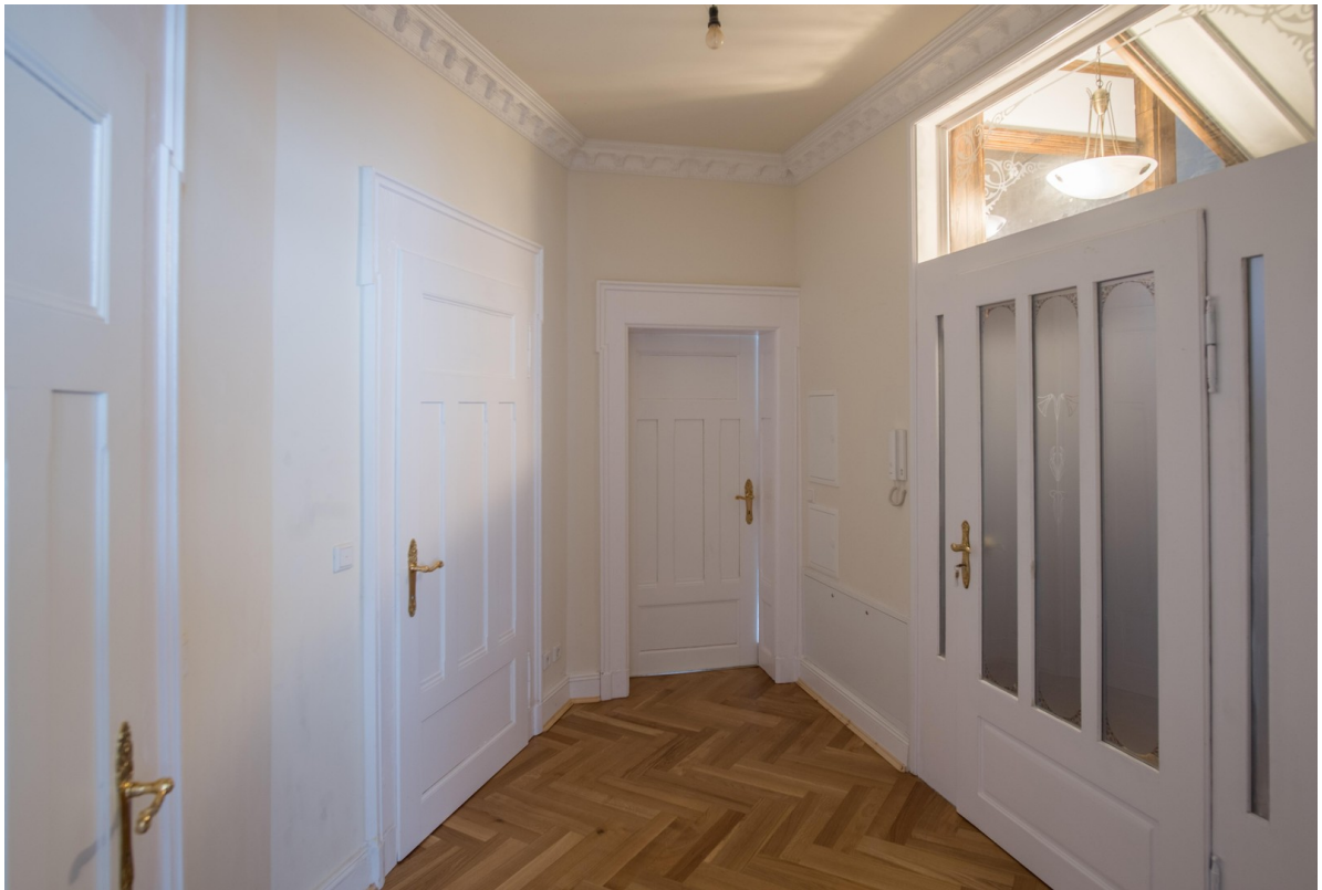
Flur in der Wohnung