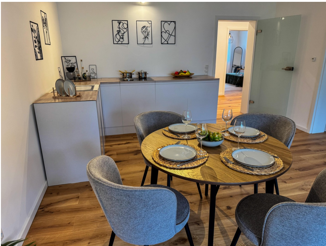
Ess- / Küchenbereich