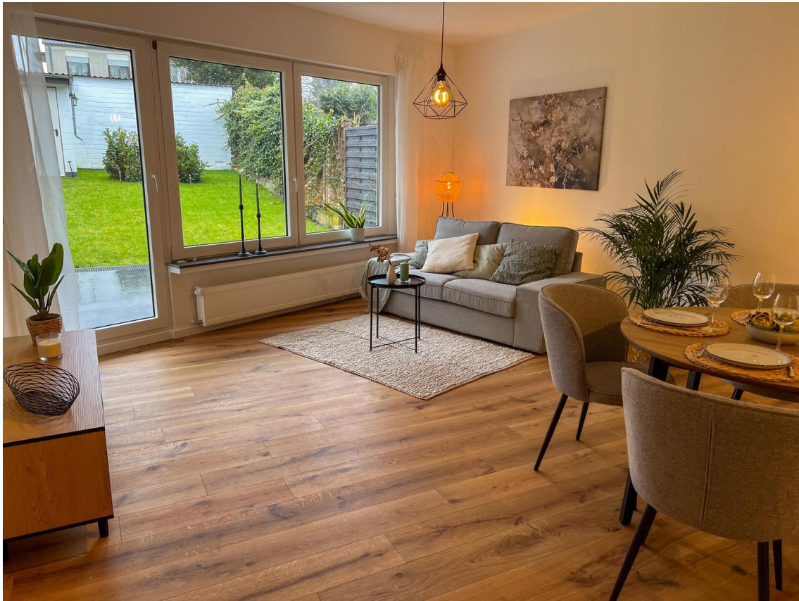
Wohn- / Essbereich