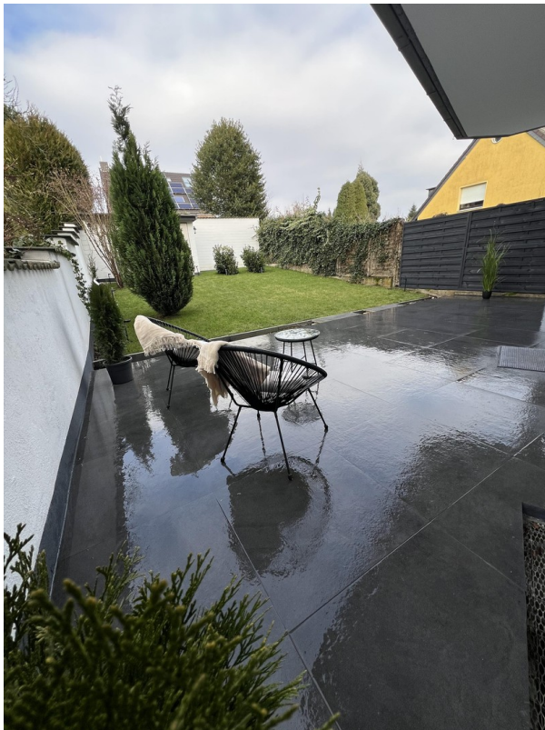
Terrasse und Garten