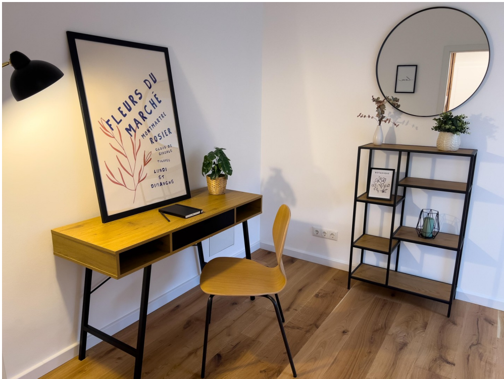
Büro- / Kinderzimmer