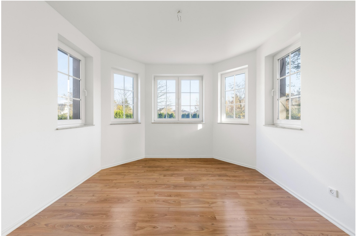
Wohn- und Essbereich 7