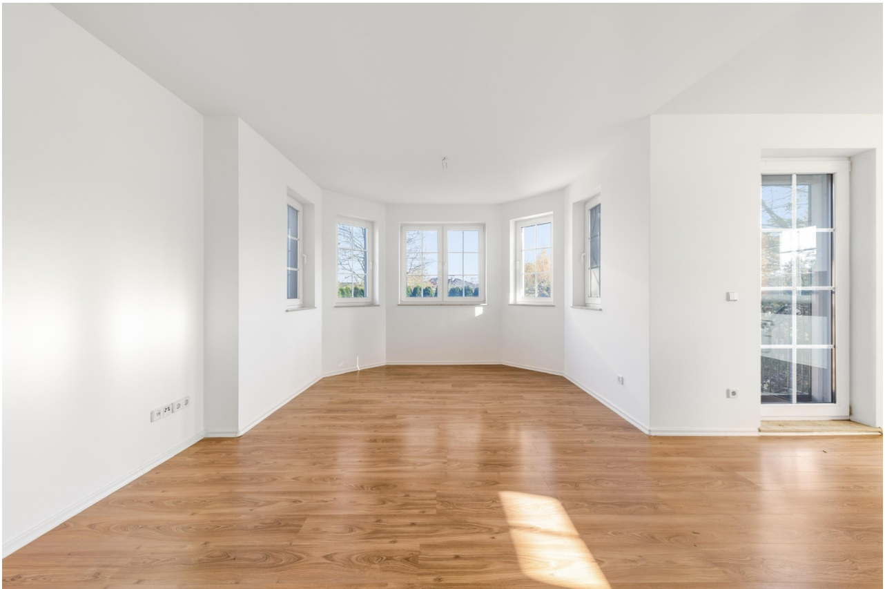
Wohn- und Essbereich 2