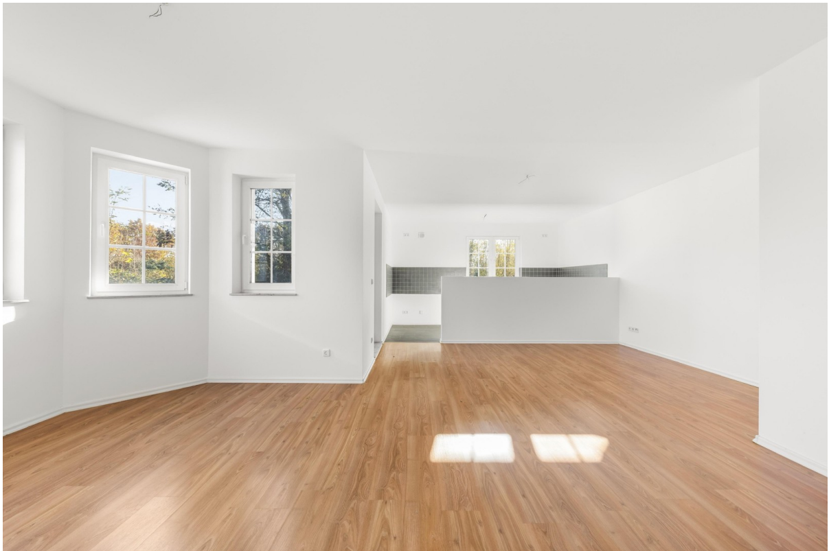
Wohn- und Essbereich 6