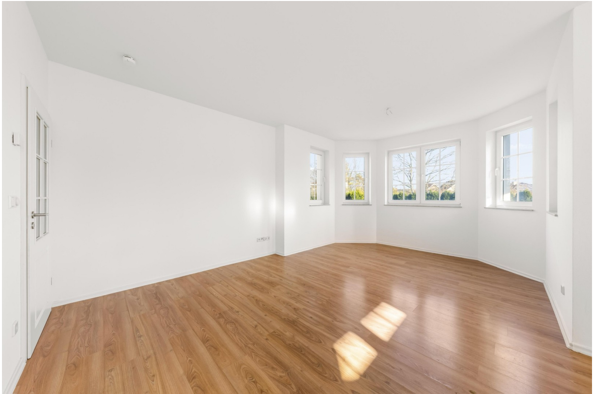
Wohn- und Essbereich 3