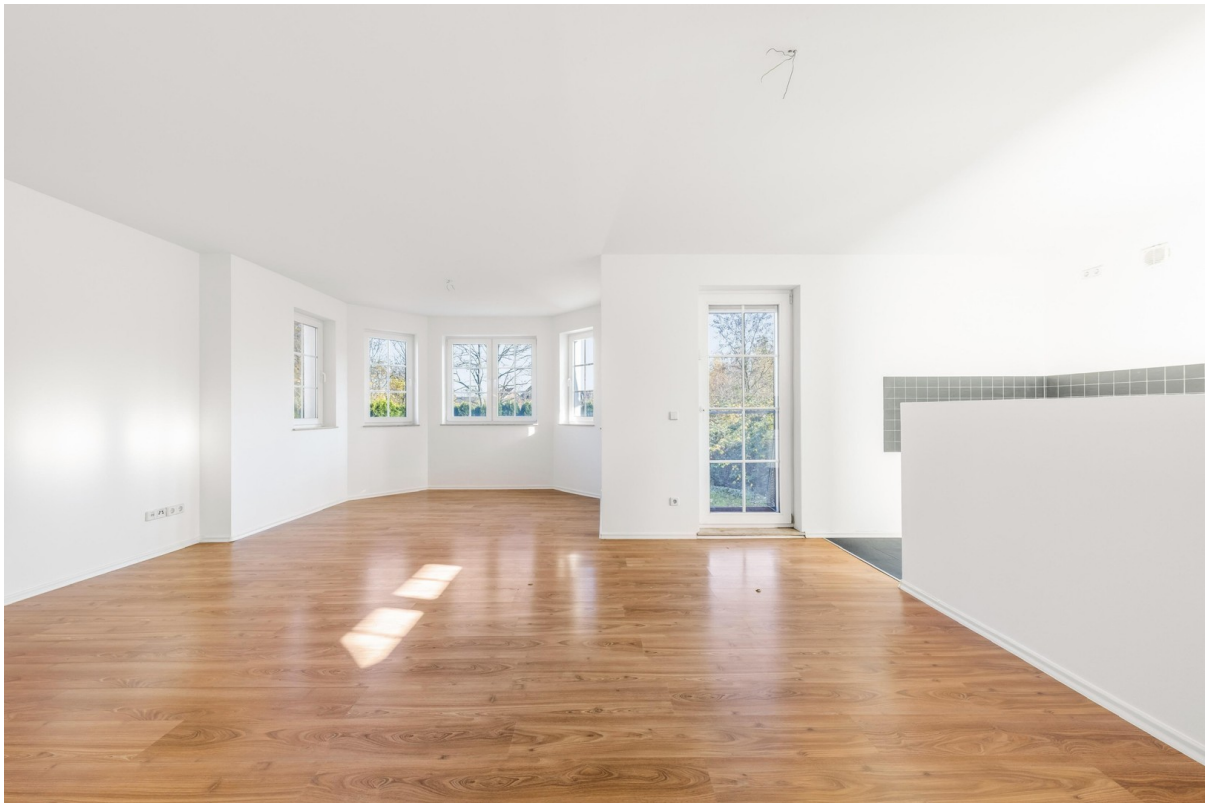
Wohn- und Essbereich 4