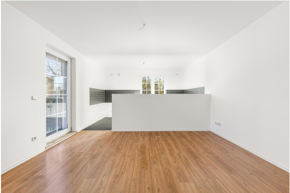
Wohn- und Essbereich 5