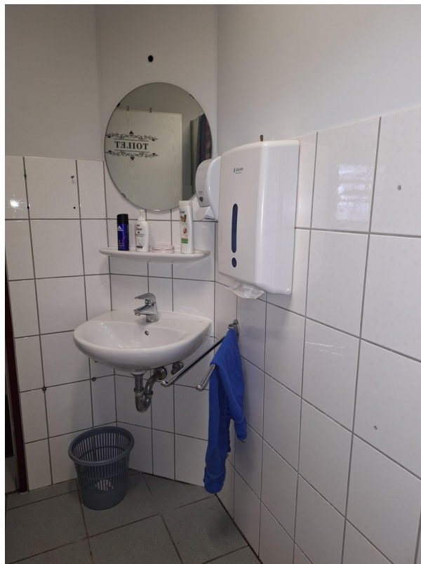
2.Toilette m. Duschgelegenheit