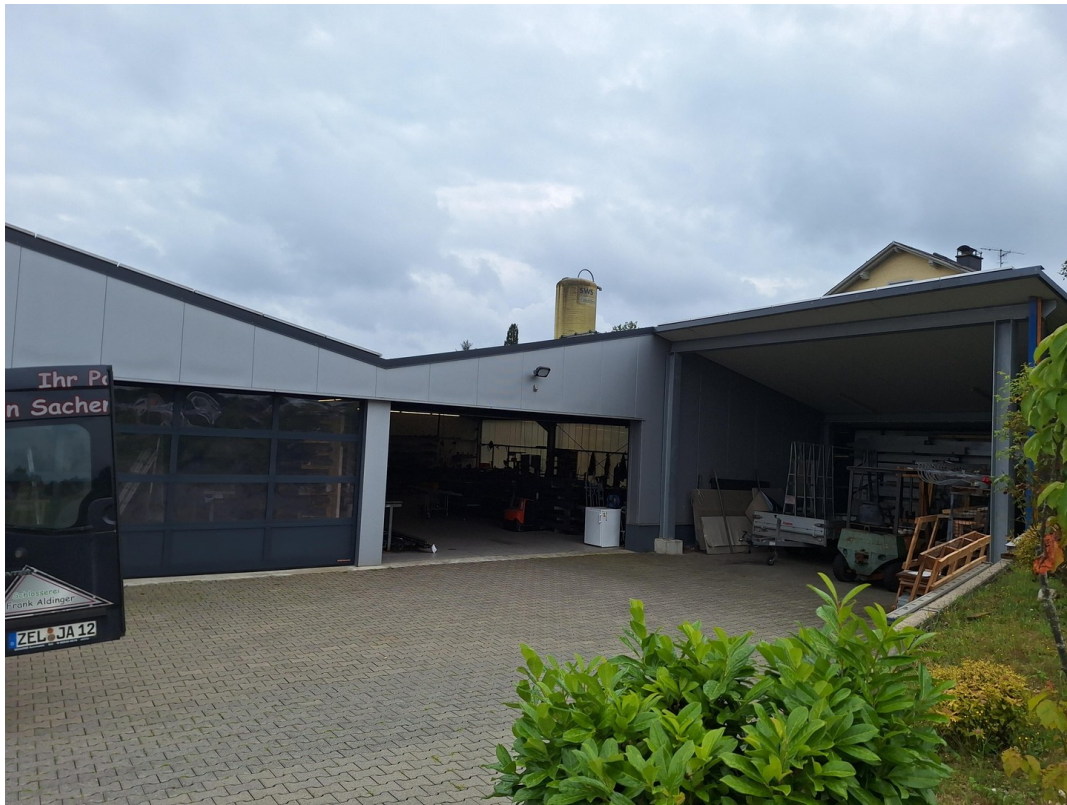
Hof mit Carport