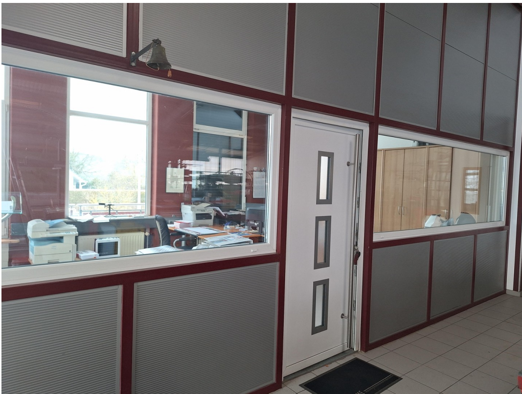
Blick aus der Halle ins Büro