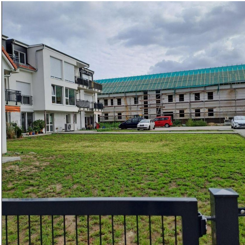
Nachbarbebauung und Neubau C