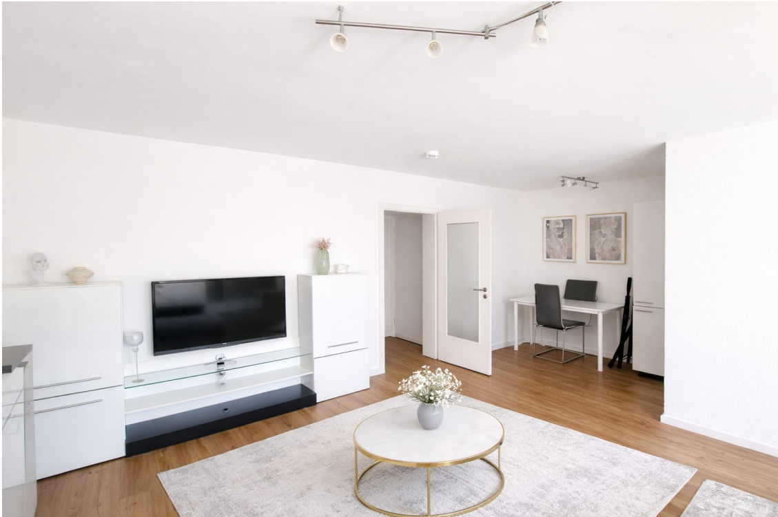
Wohnzimmer Bild 2