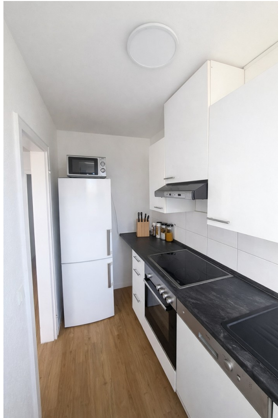
Küche Bild 2