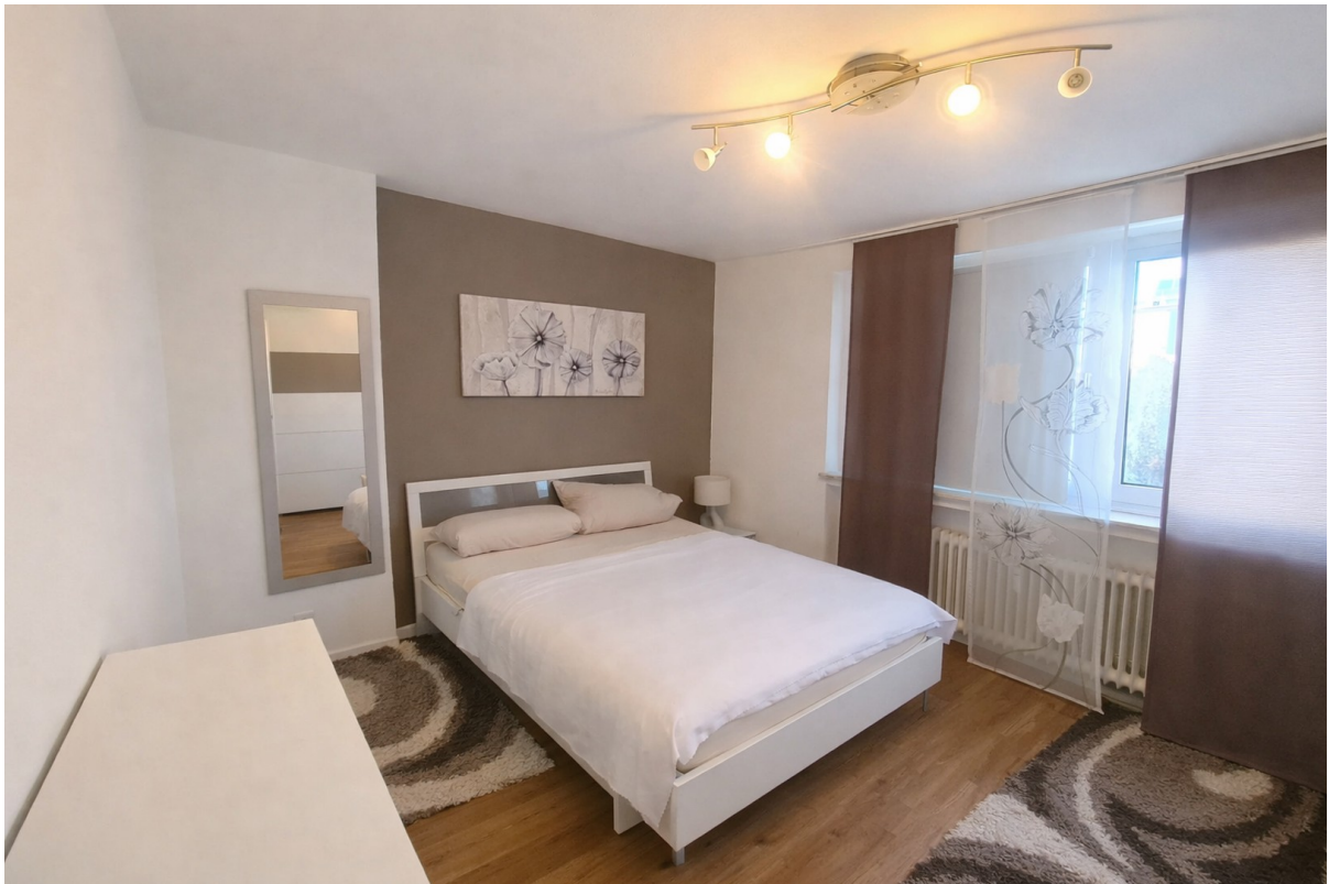
Schlafzimmer Bild 2