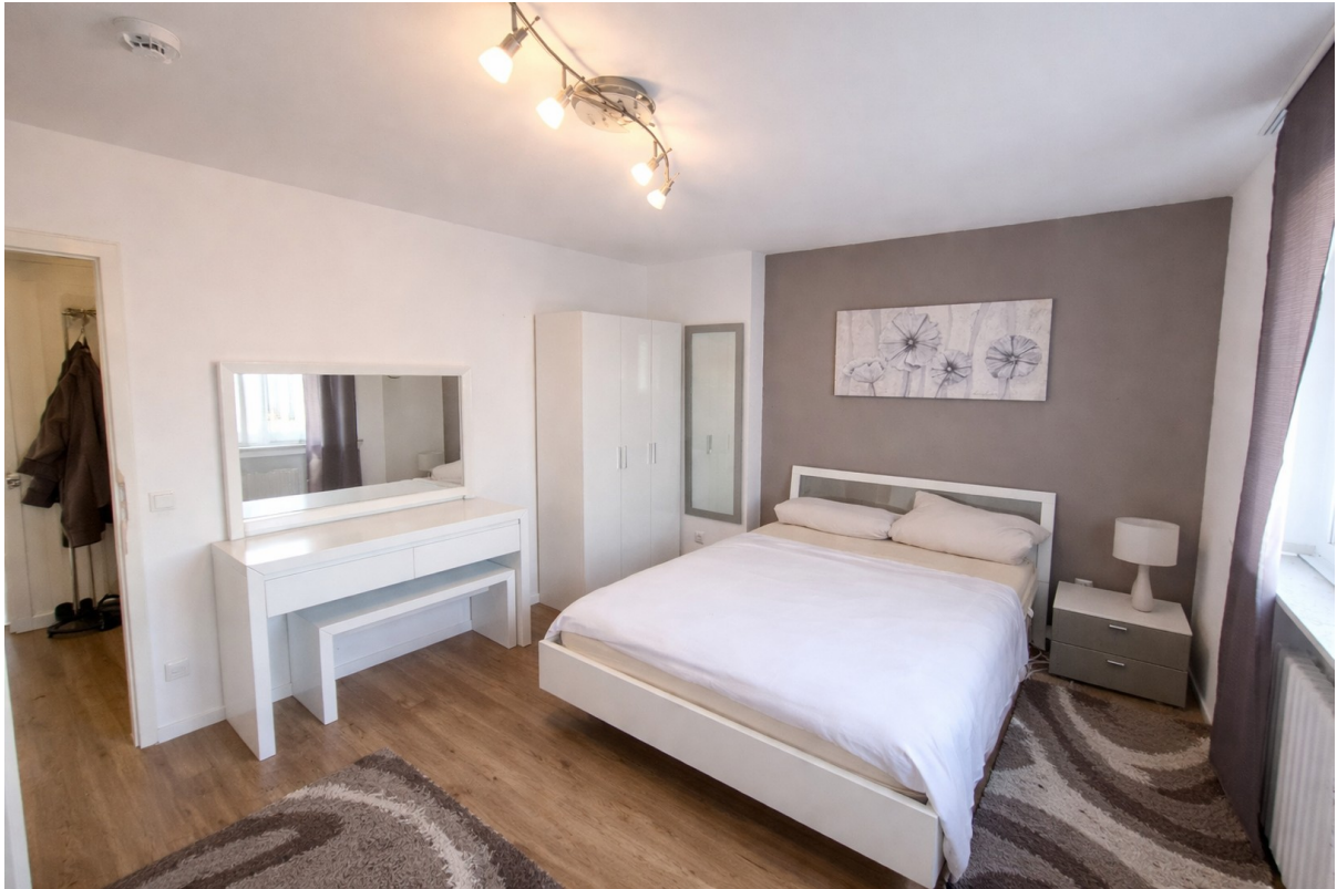
Schlafzimmer Bild 1