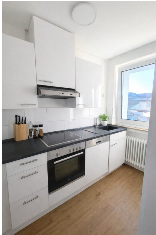
Küche Bild 1