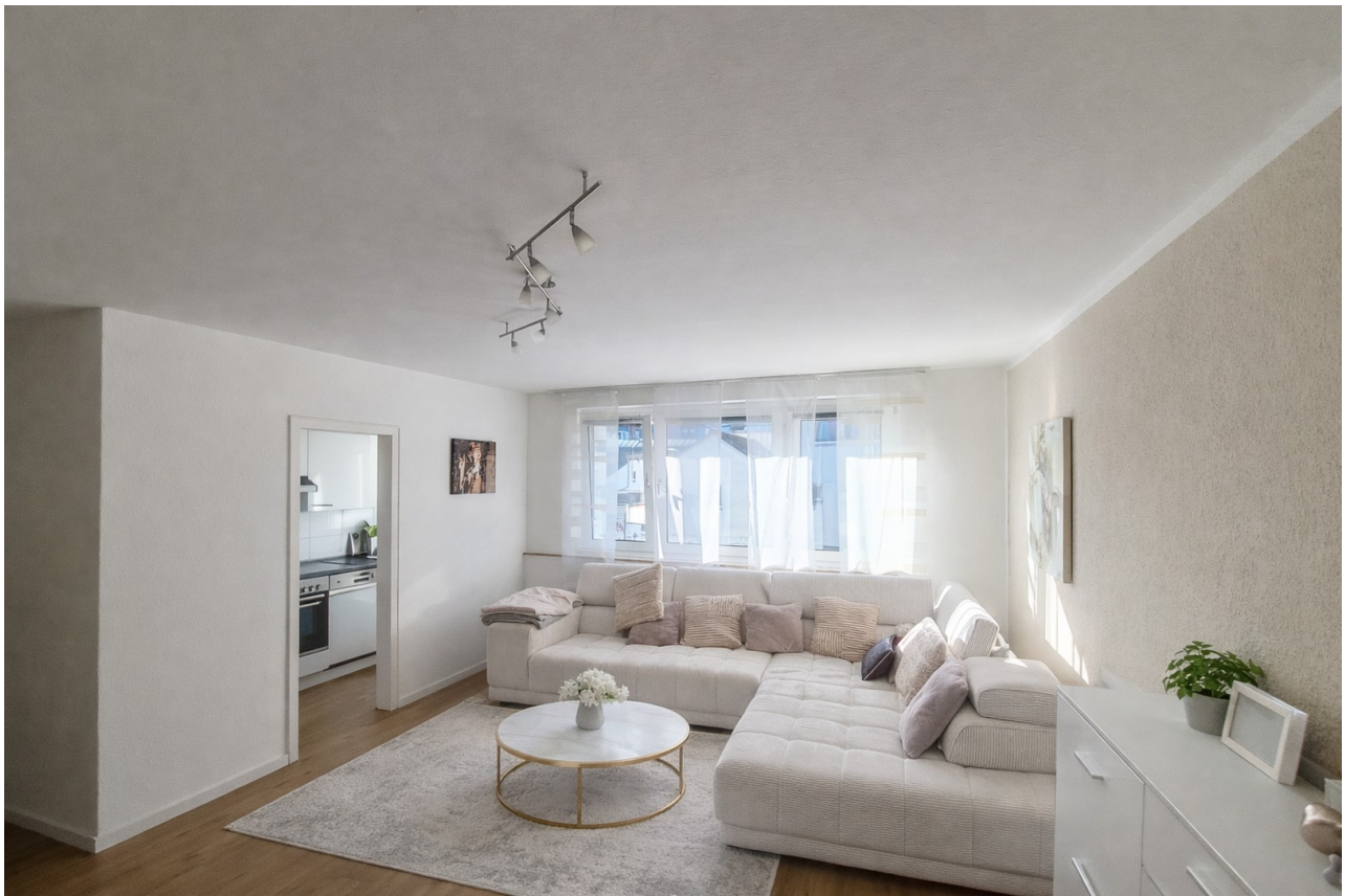
Wohnzimmer Bild 1