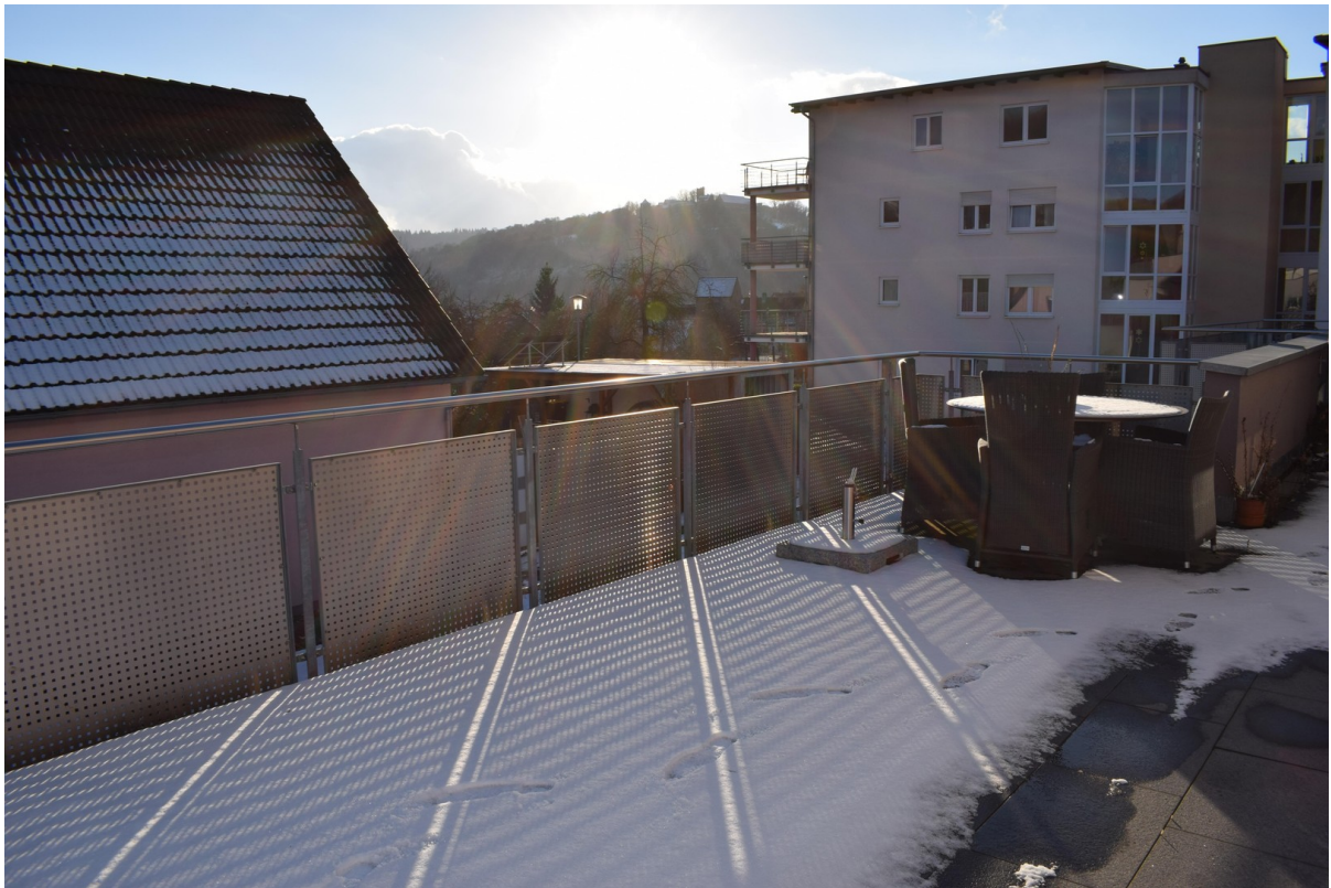
Terrasse, Blick zur Burg