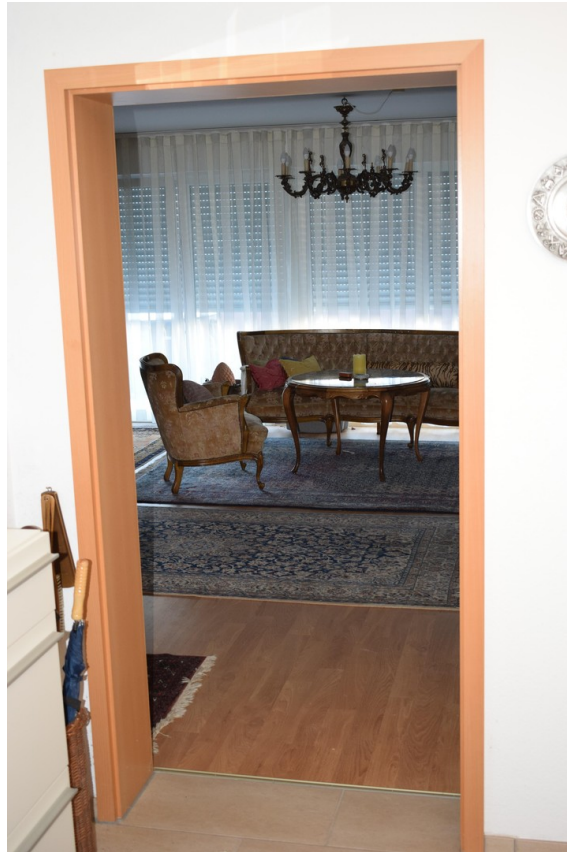
Blick ins Wohnzimmer