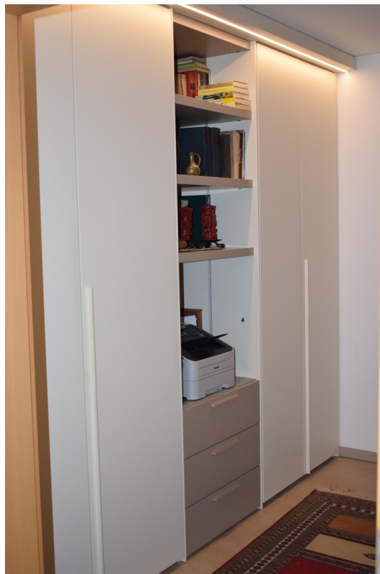
Einbauschranks in der Diele