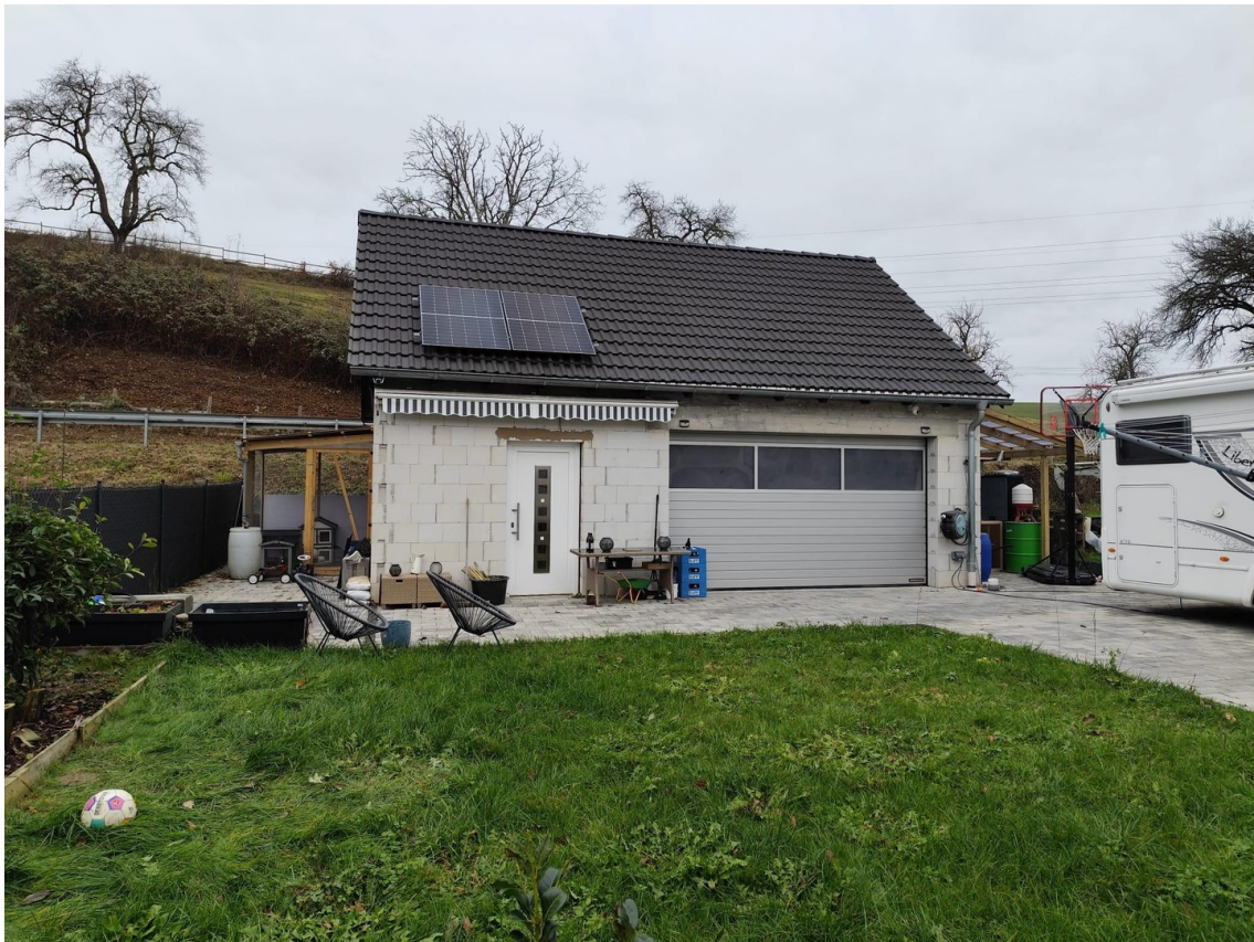
Garage mit Garten