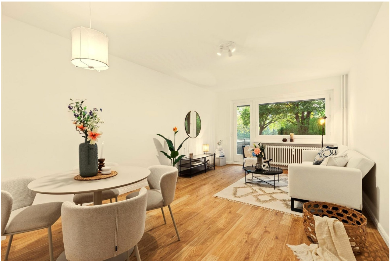
Wohnzimmer mit Balkon