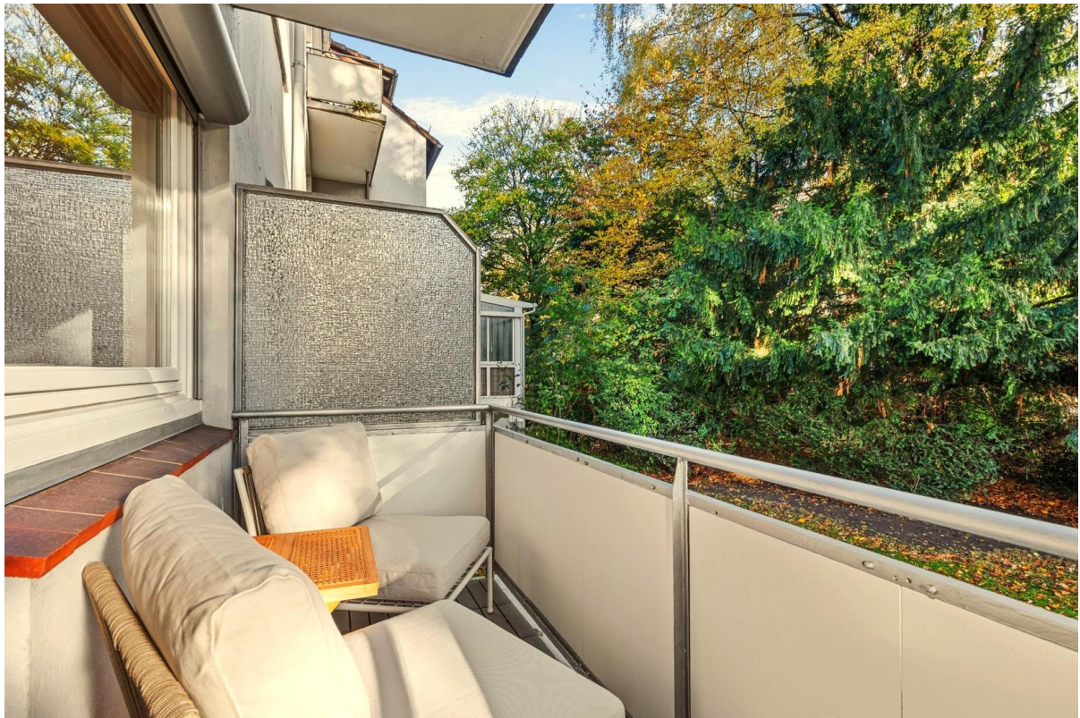
Balkon zum Gemeinschaftsgarten