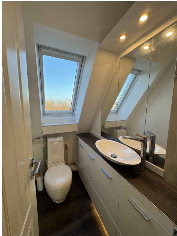
Toilette mit Fenster