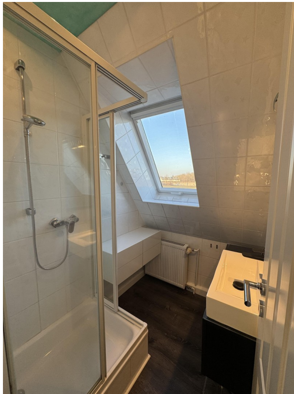
Badezimmer mit Fenster