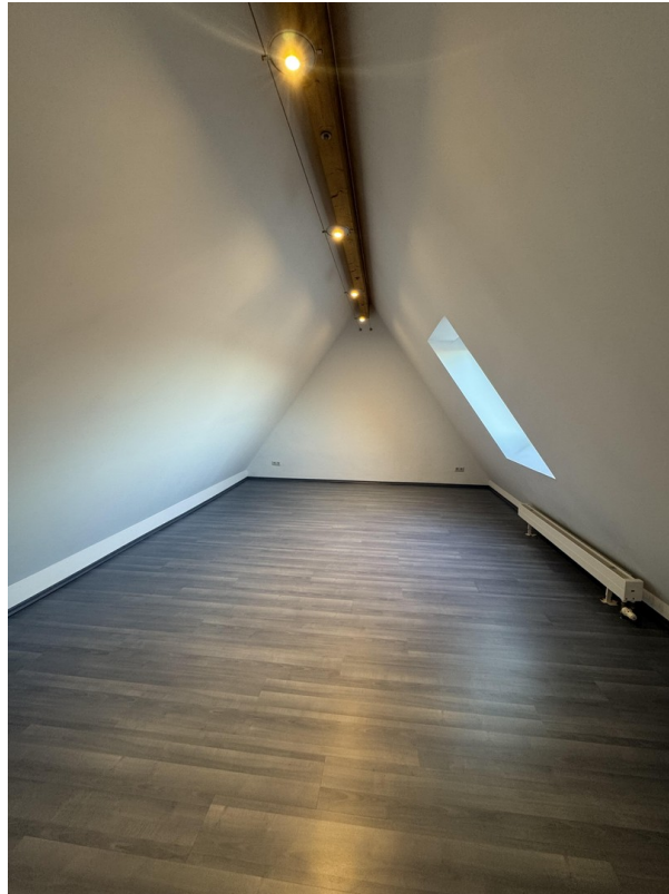
Zimmer 3 Dachgeschoss