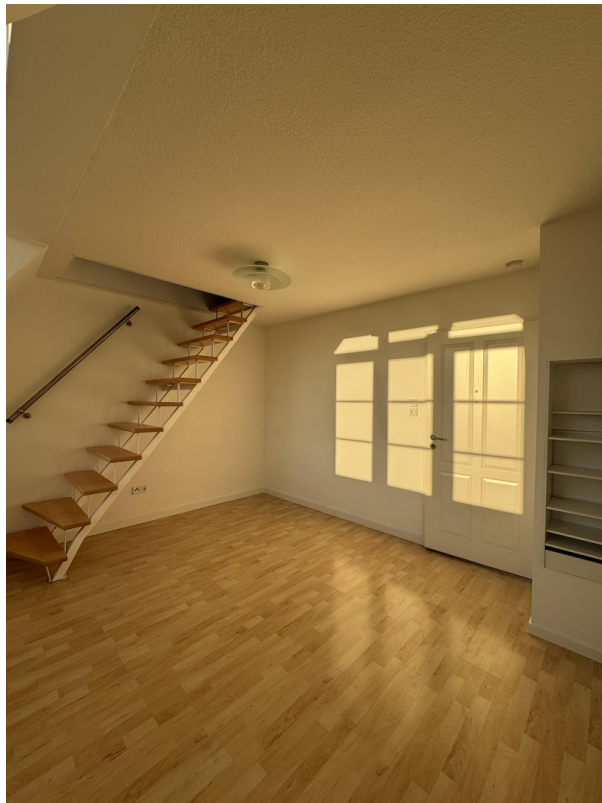
Zimmer 2 mit Ausgang