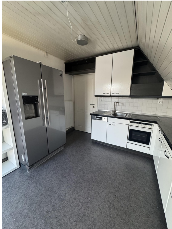
Küche mit Side-by-Side