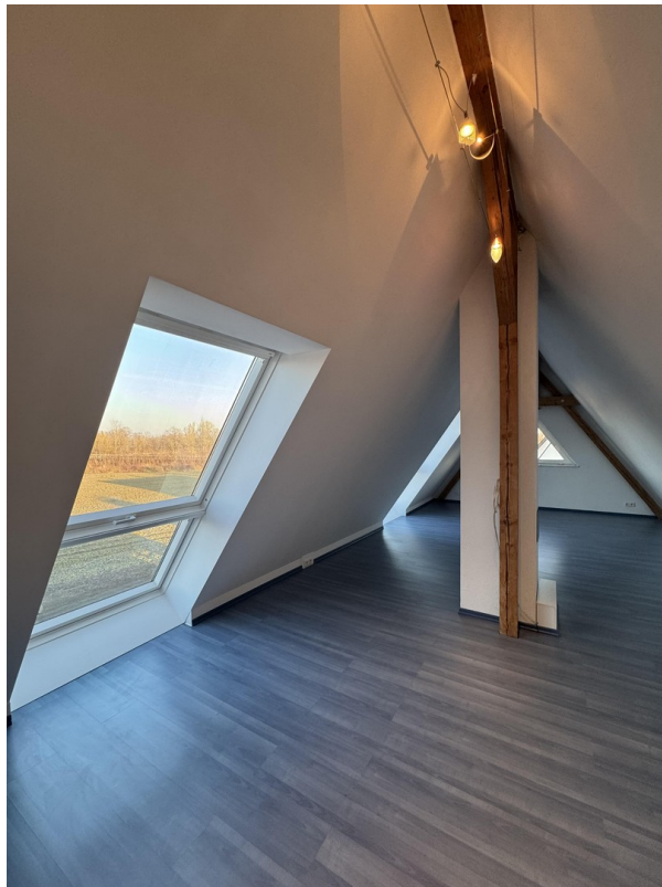
Zimmer 3 Dachgeschoss