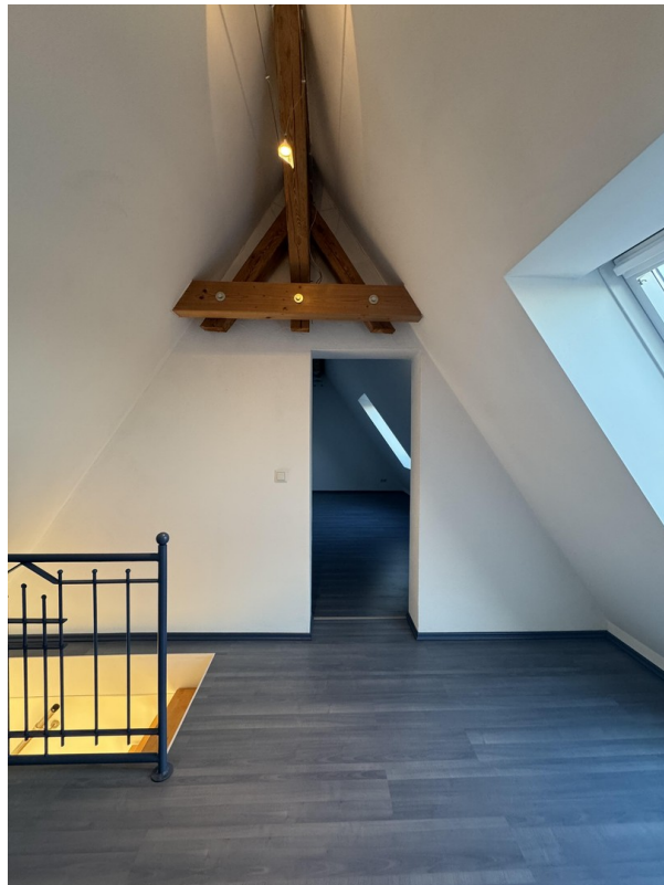
Zimmer 3 Dachgeschoss