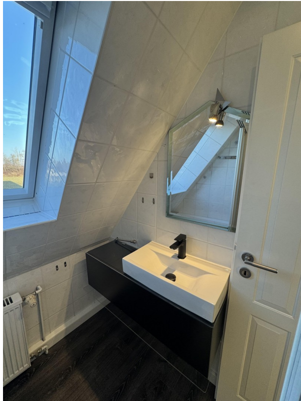
Badezimmer mit Fenster