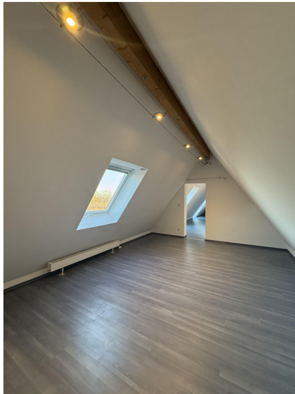
Zimmer 3 Dachgeschoss