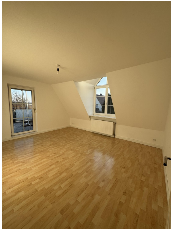
Zimmer 1 mit Balkonzugang