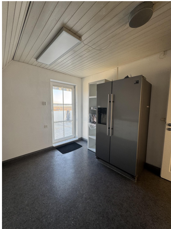
Küche mit Balkonzugang