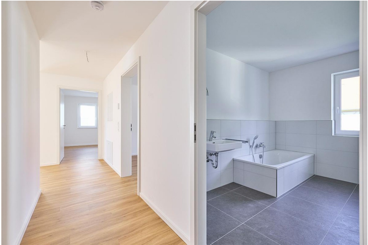
Blick in den Flur + Badezimmer