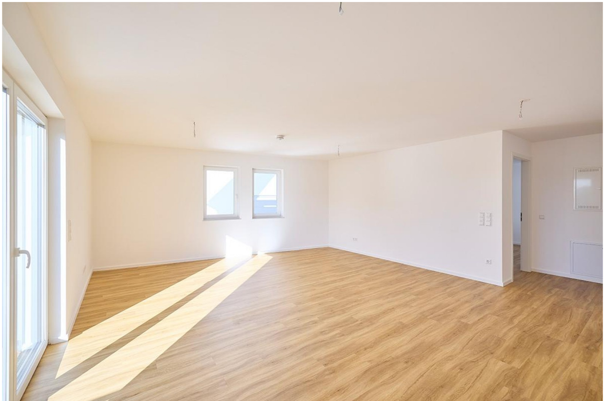
Blick von der Küchen ins Wohnz