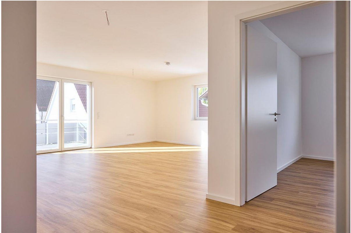
Blick in die Wohnküche + Balko