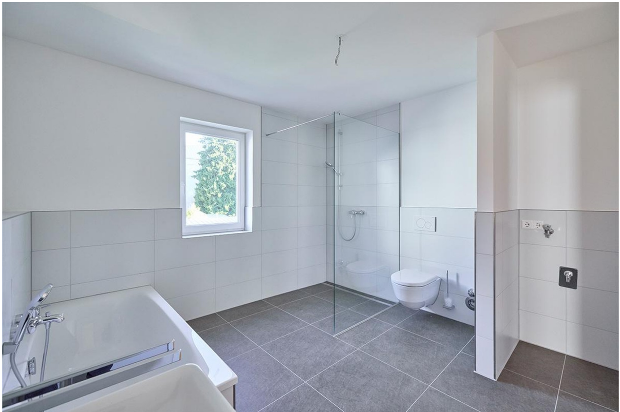
Badezimmer mit Dusche und Wan.