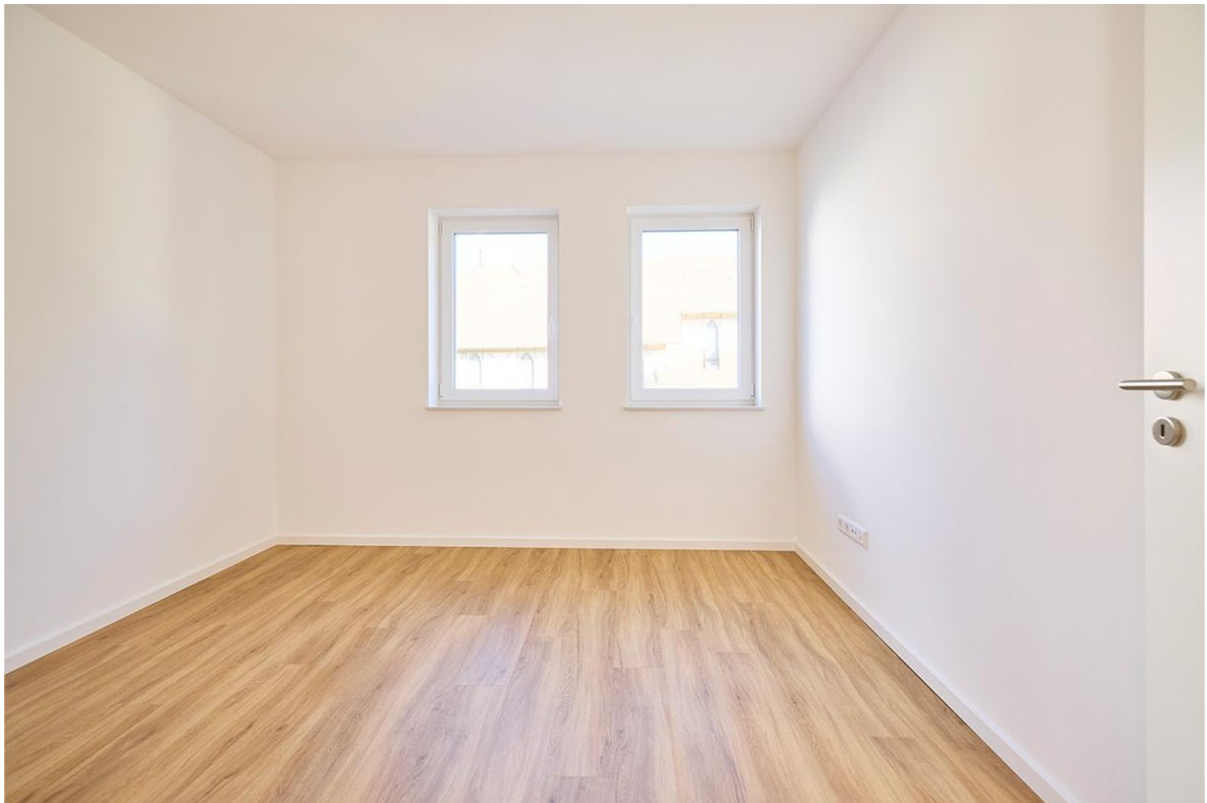
Kinderzimmer / Büro