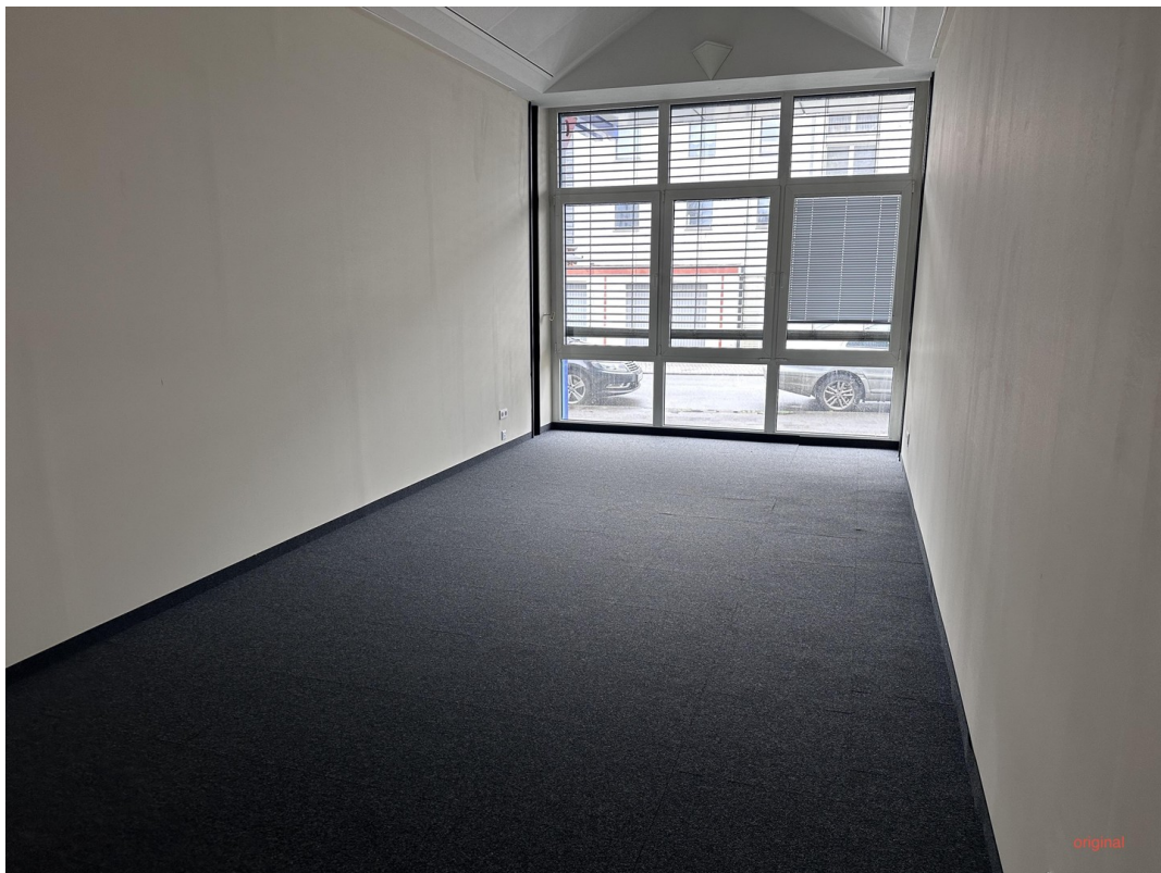
Originalbild ohne Büroeinricht