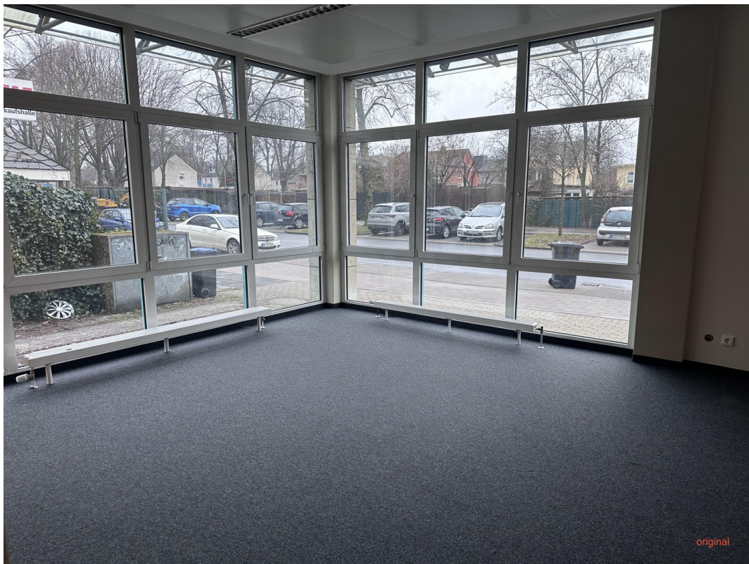
Originalbild ohne Büroeinricht