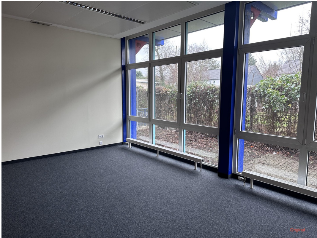
Originalbild ohne Büroeinricht