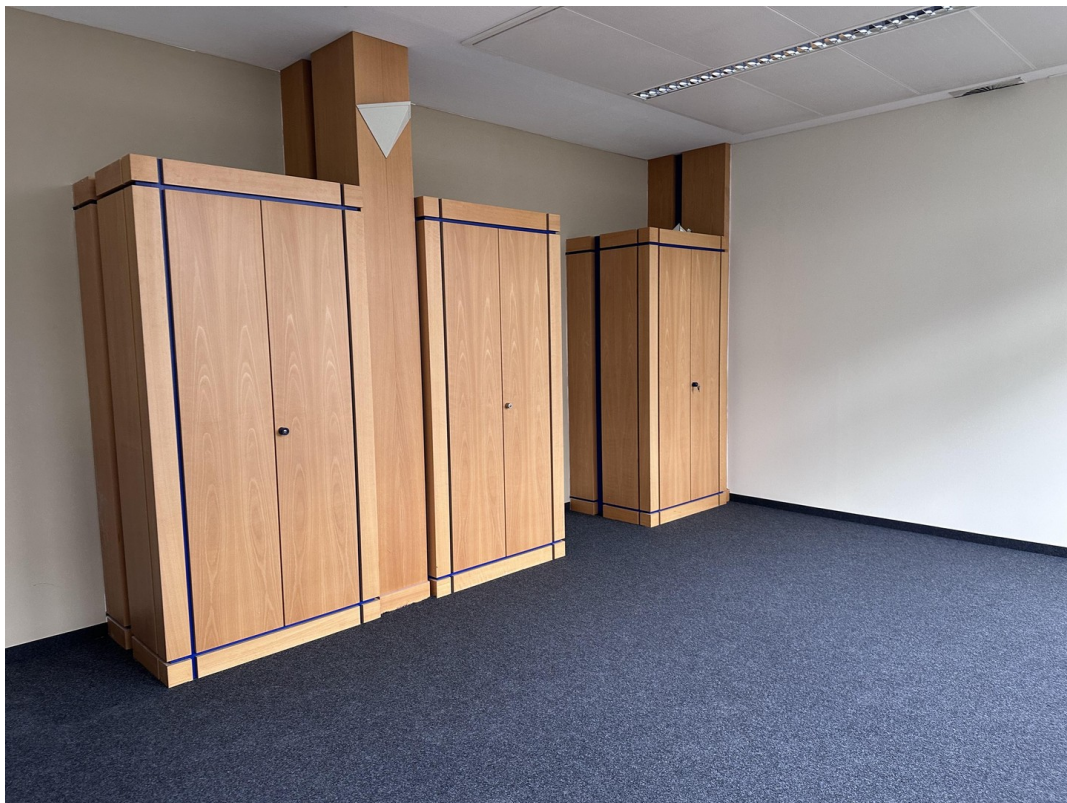
Originalbild ohne Büroeinricht