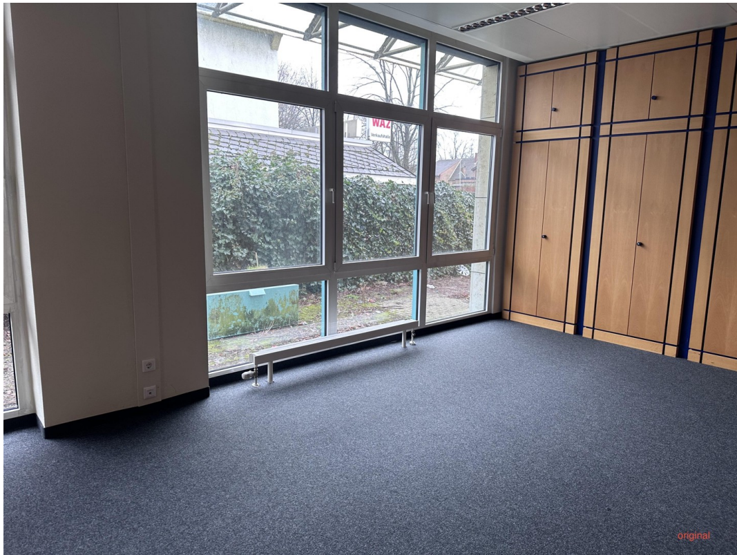
Originalbild ohne Büroeinricht