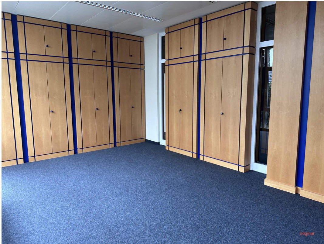
Originalbild ohne Büroeinricht