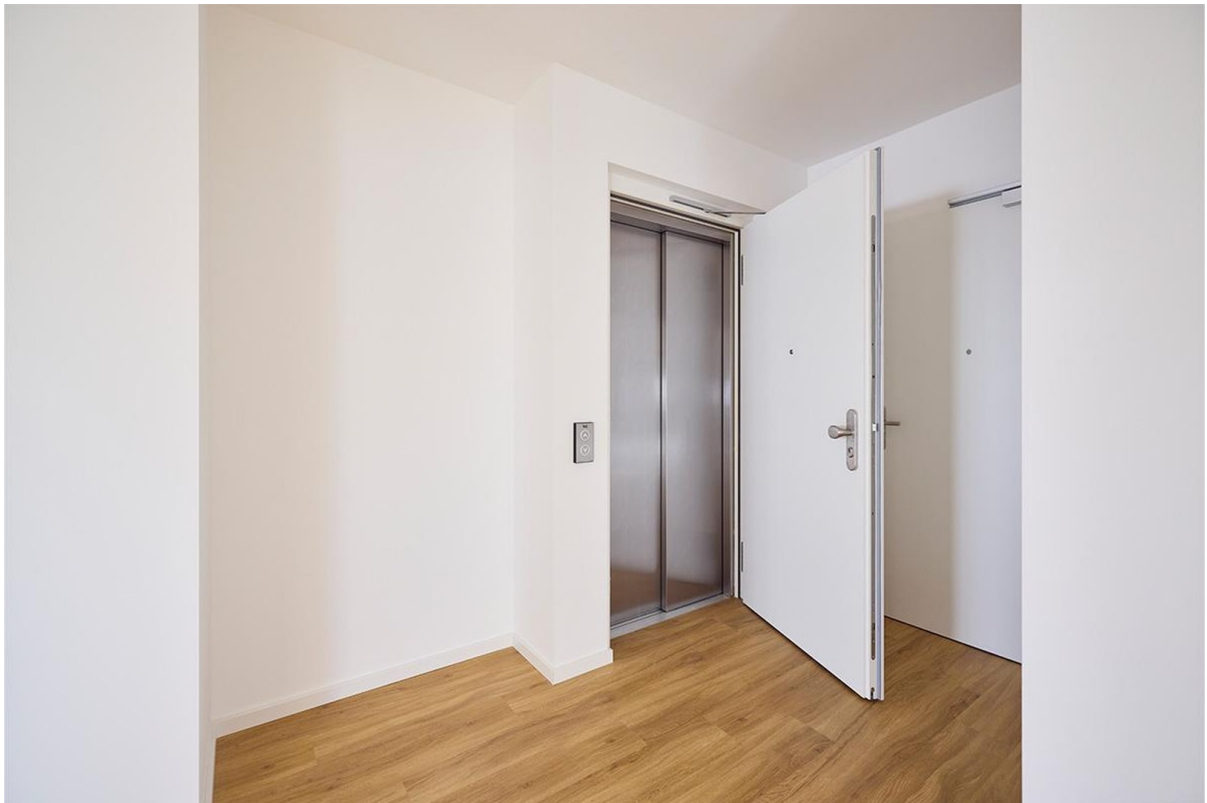
Aufzug führt direkt in die W.