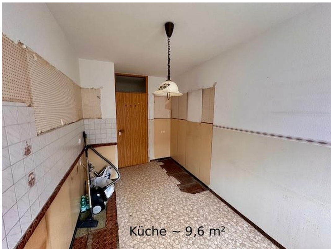
Küche ~ 9,6 m 2