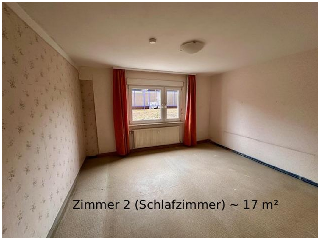
Zimmer 2 (Schlafzimmer) ~ 17 m 2