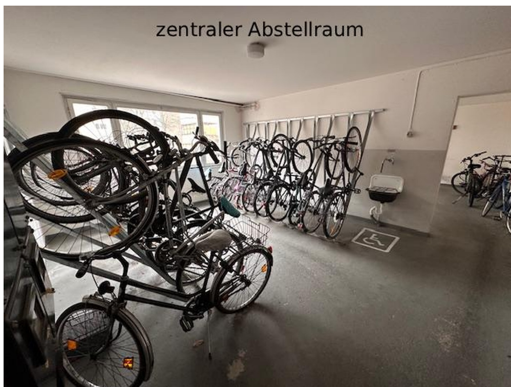
Zentraler Raum für Fahrräder