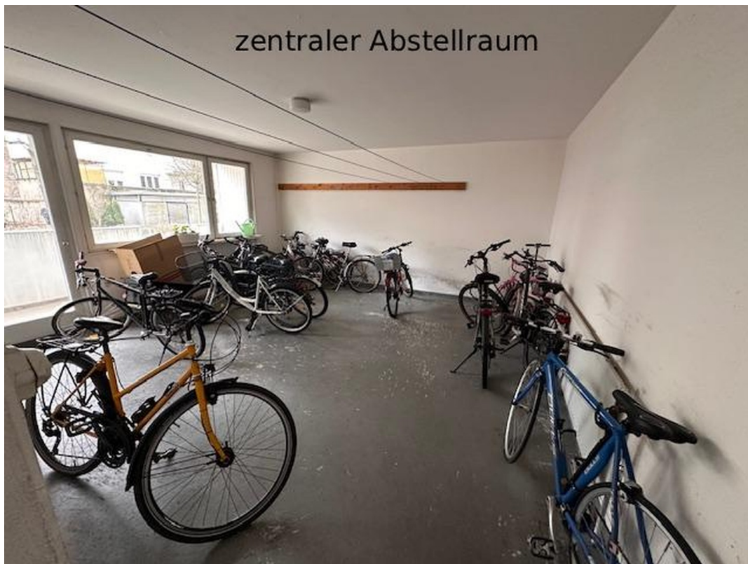
Zentraler Raum für Fahrräder