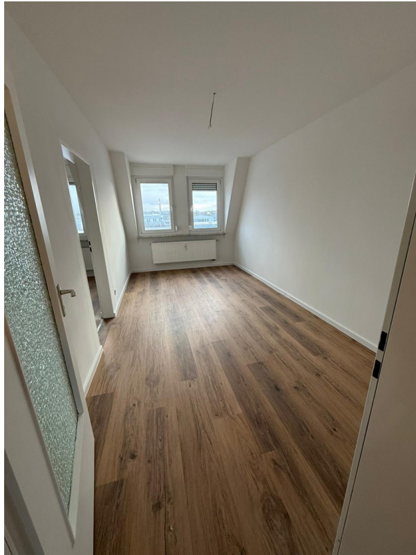
Wohnzimmer 4. OG