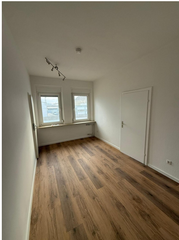
Wohnzimmer 1. OG