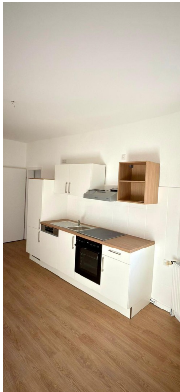
Küche 1. & 4. OG