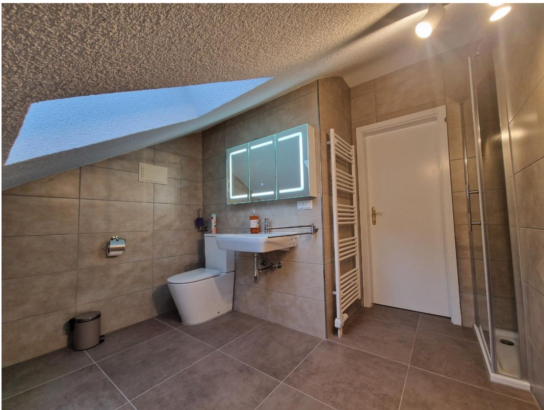
Bad DG - Bild 2