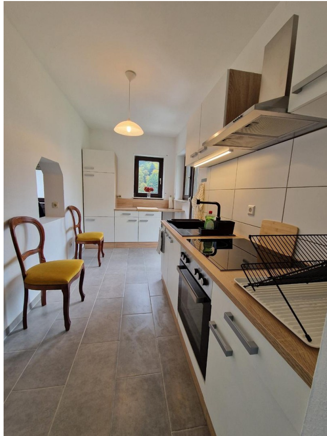
Küche - Bild 2