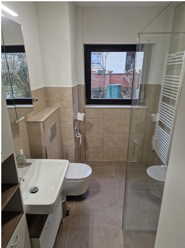
Bad OG - Bild 2