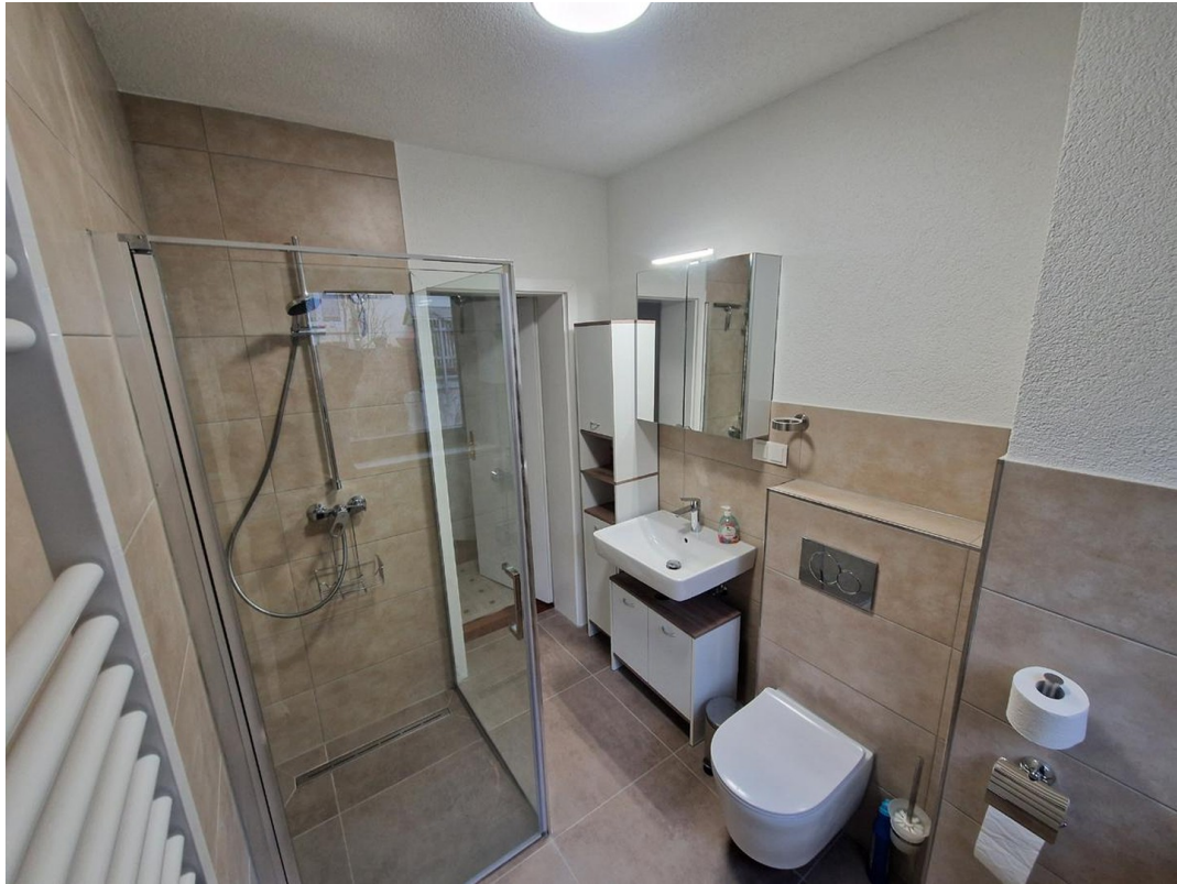
Bad OG - Bild 1