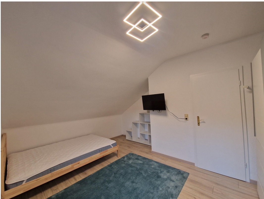
WG-Zimmer - Bild 4