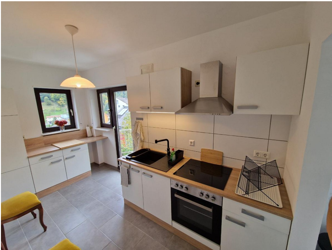
Küche - Bild 1