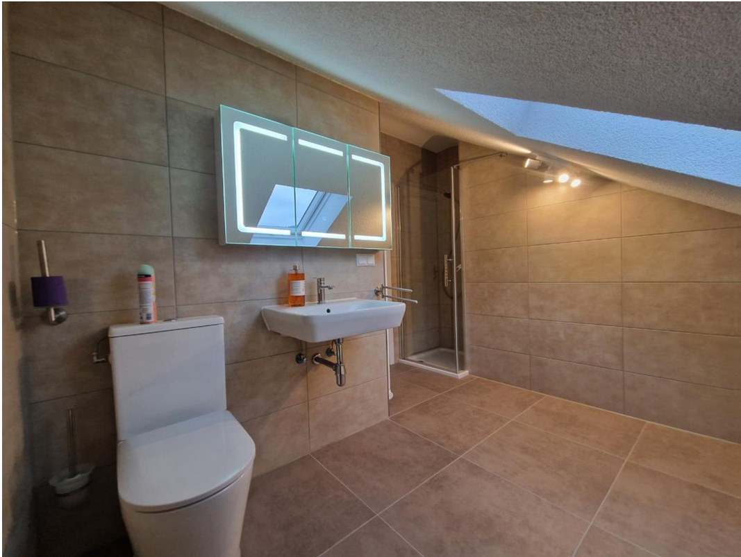
Bad DG - Bild 1