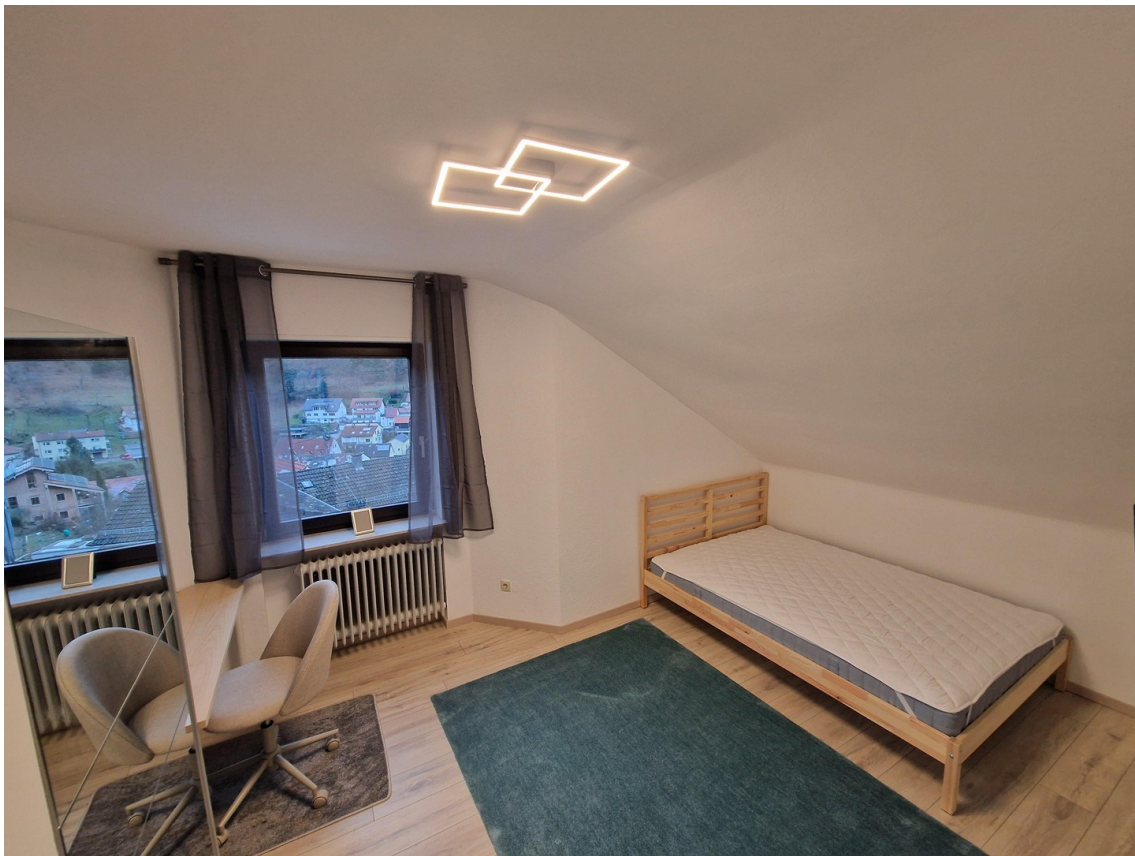
WG-Zimmer - Bild 2