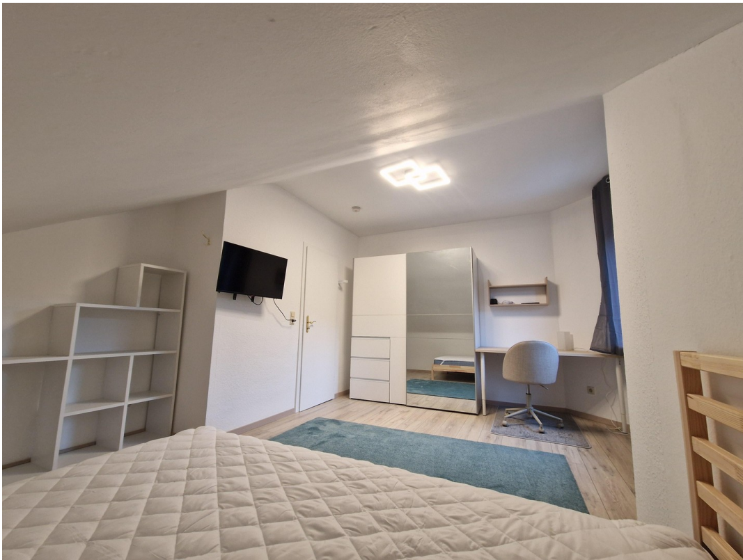
WG-Zimmer - Bild 3