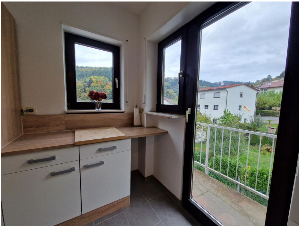
Küche - Bild 3