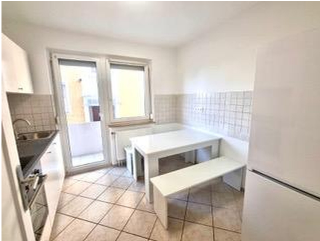
Treffpunkt der WG