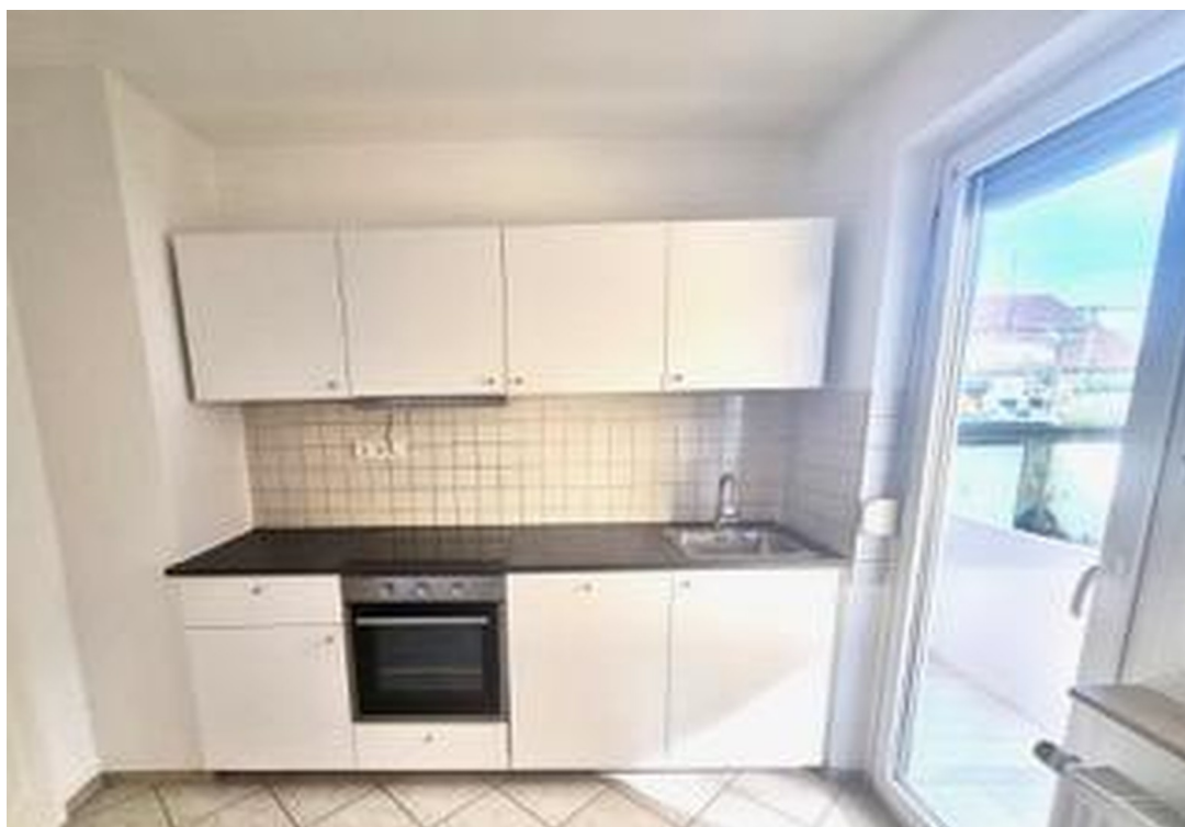
Hier macht kochen Spaß!